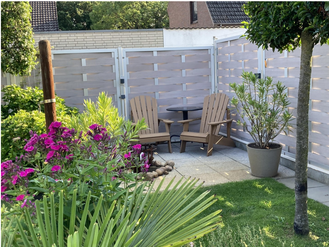
Sitzecke / Feuerstelle