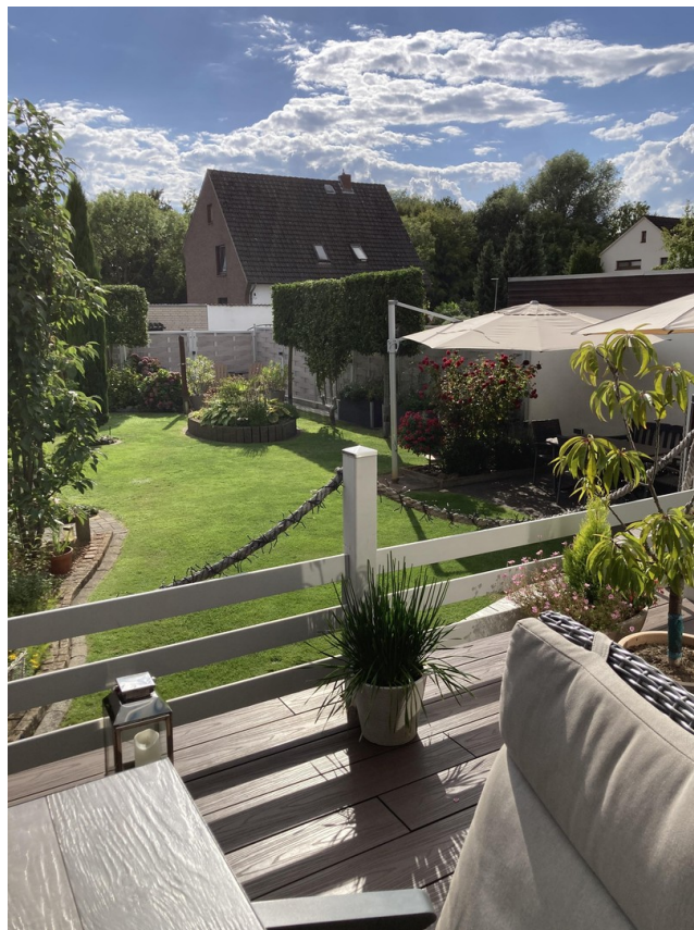
Terrasse / Garten