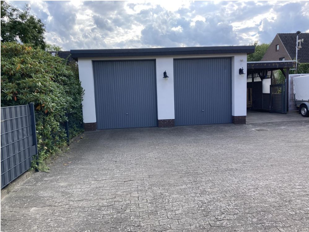
Doppelgaragen und Carport