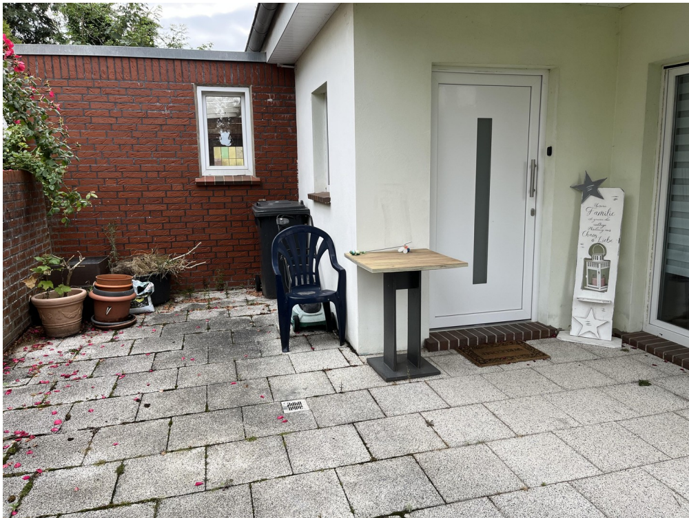
Eingangsbereich der Whg