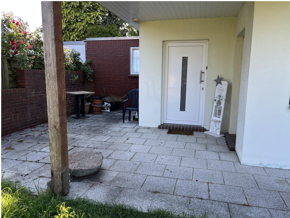
Eingangsbereich der Whg