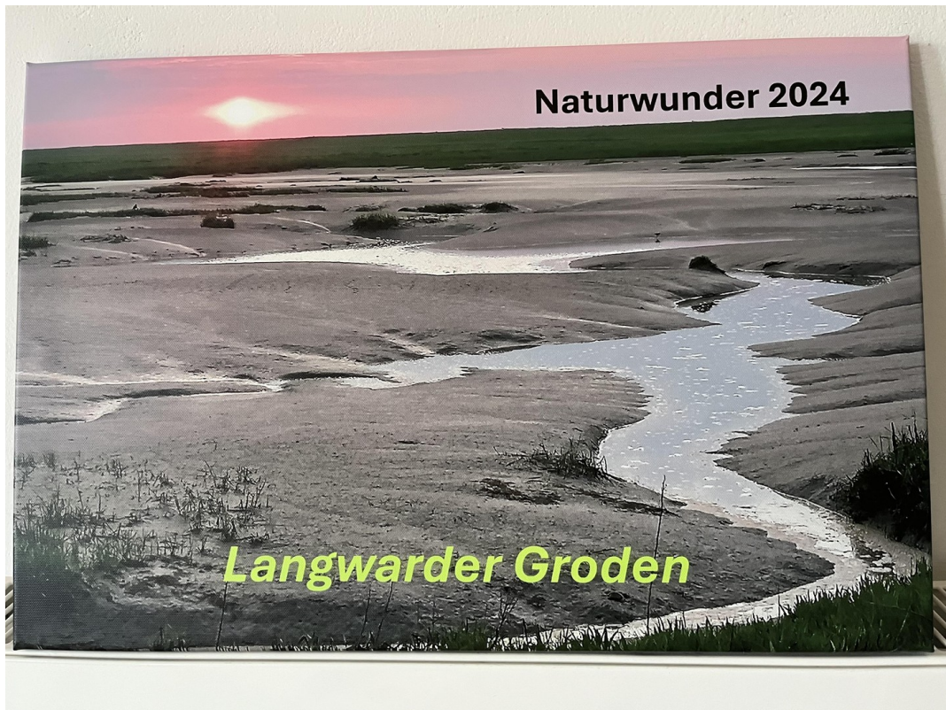
Siegerbild Naturwunder 2024