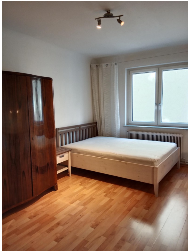
Das Zimmer hofseitig