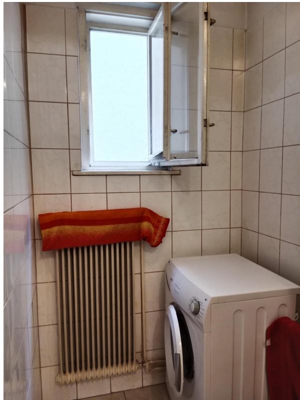
Badzimmer mit Waschmaschine