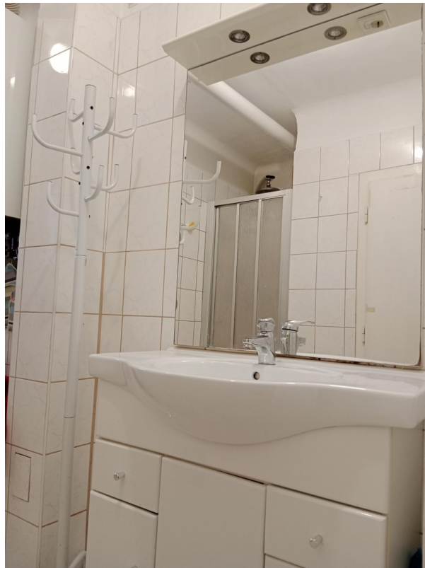
Badzimmer Dusche und Abwasch