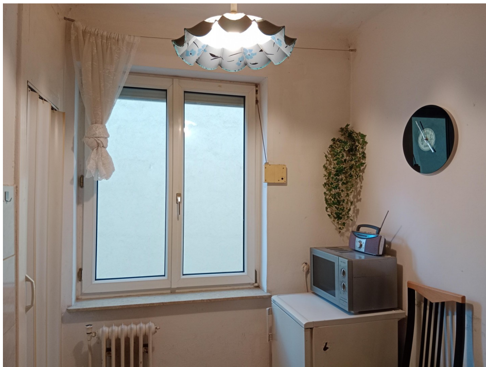
Küche mit kleinem Abstellraum