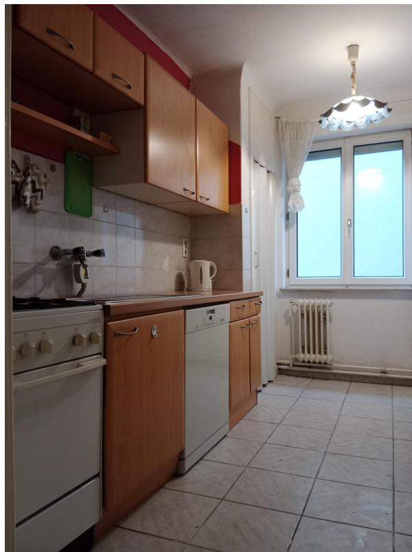
Küche mit Fenster