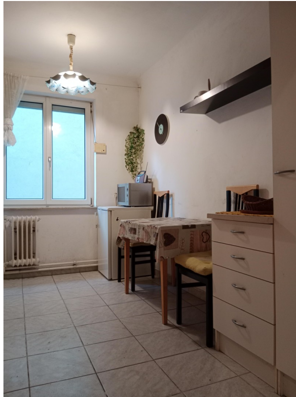
Küche Sitzplatz mit Fenster