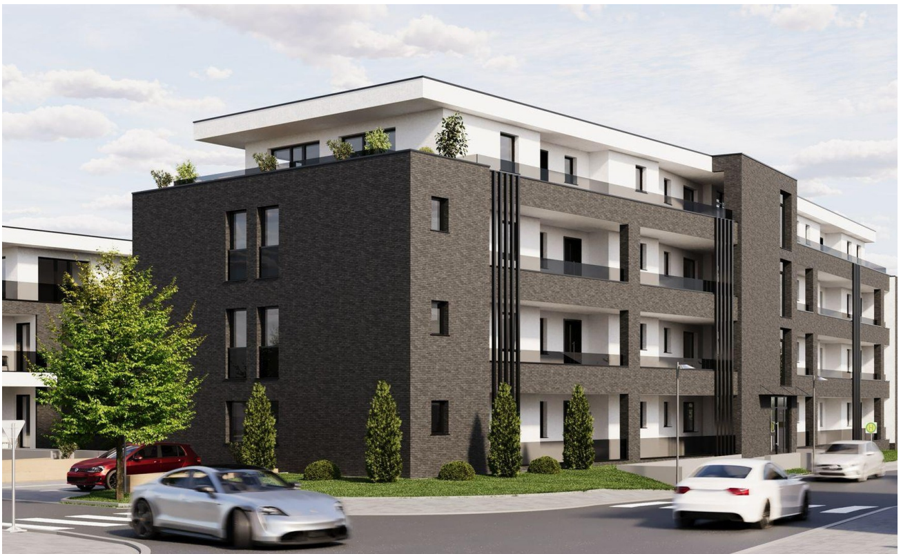
Hauptstr. 10 Geb. A