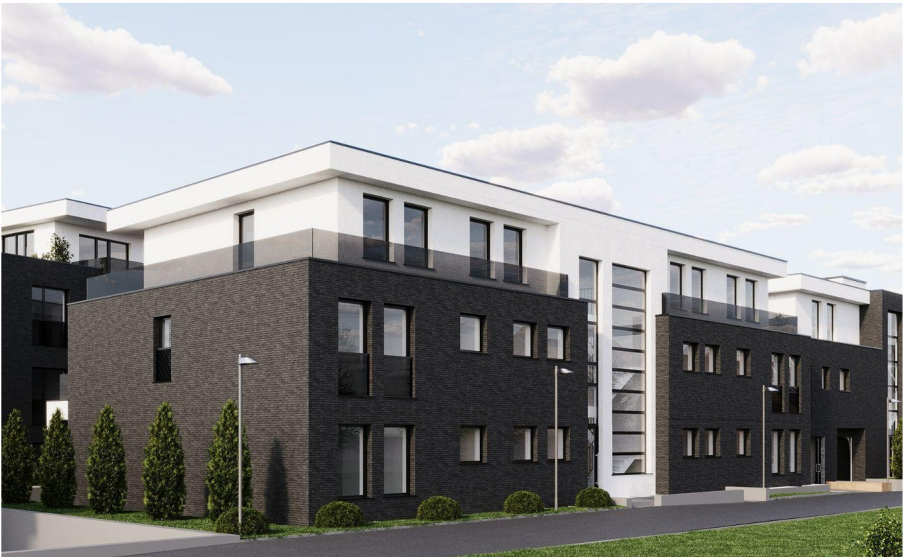
Front Geb. C+B