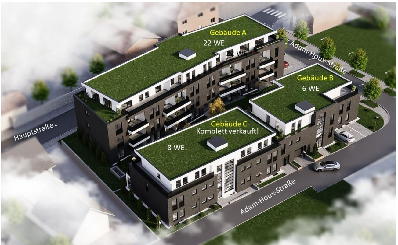
Drei Gebäude A * B * C