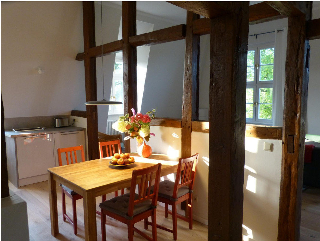
Kochen / Essen