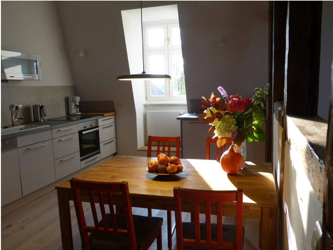
Kochen / Essen