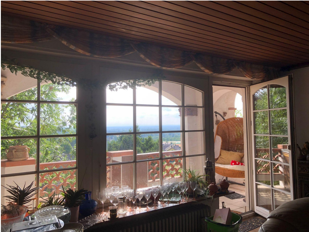
Blick v. Wohnzimmer a. Balkon