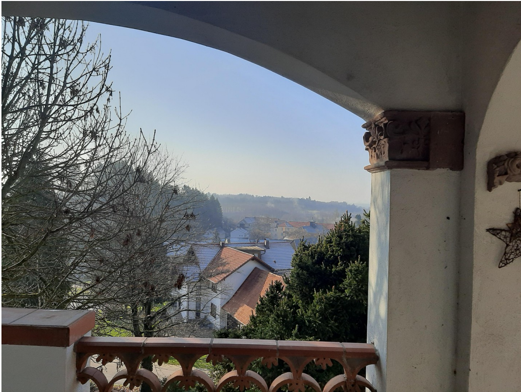
Blick von Balkon i. Rheinebene