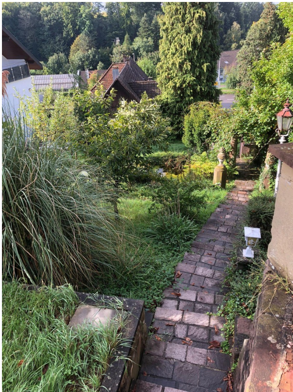
Treppenanlage und Garten