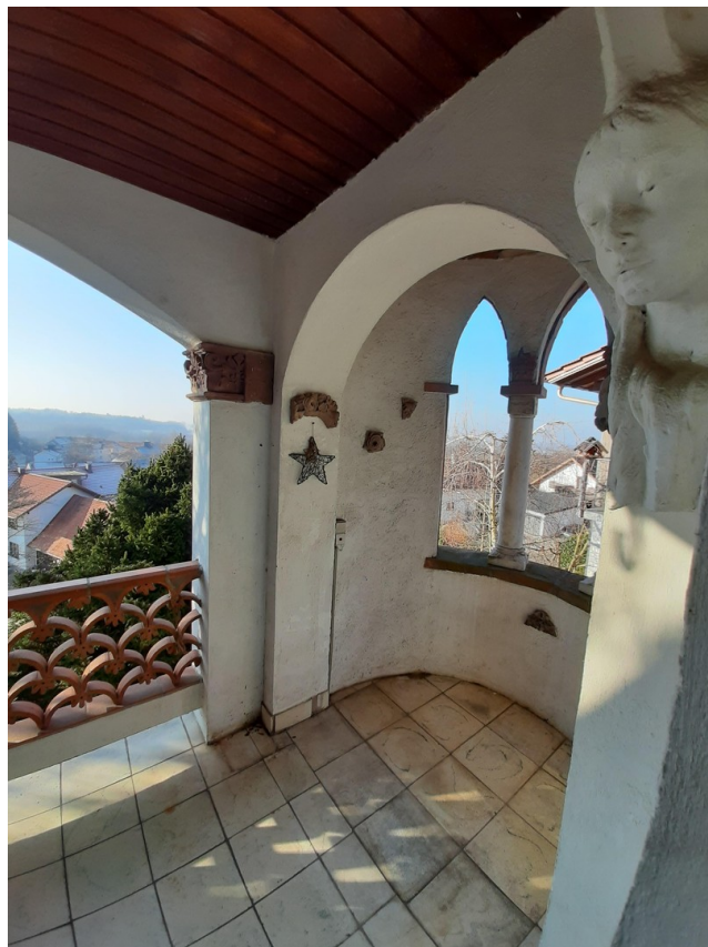
Balkon mit kleinem Turm