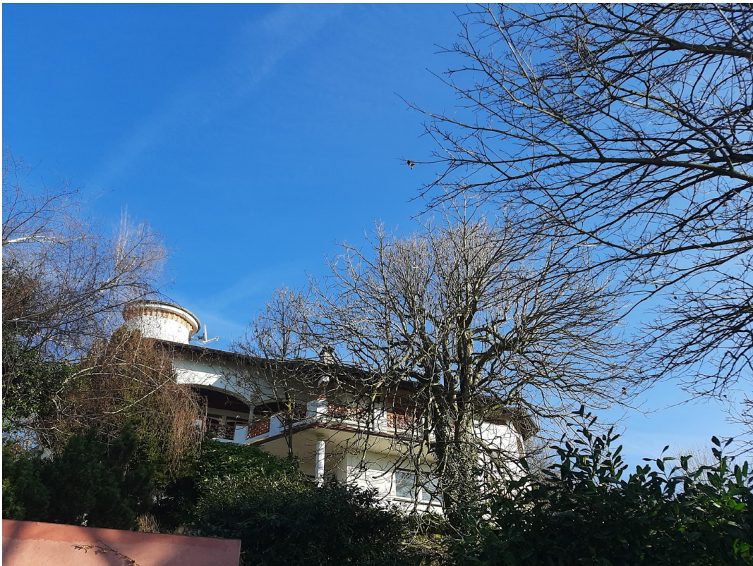
Hausansicht von Straße