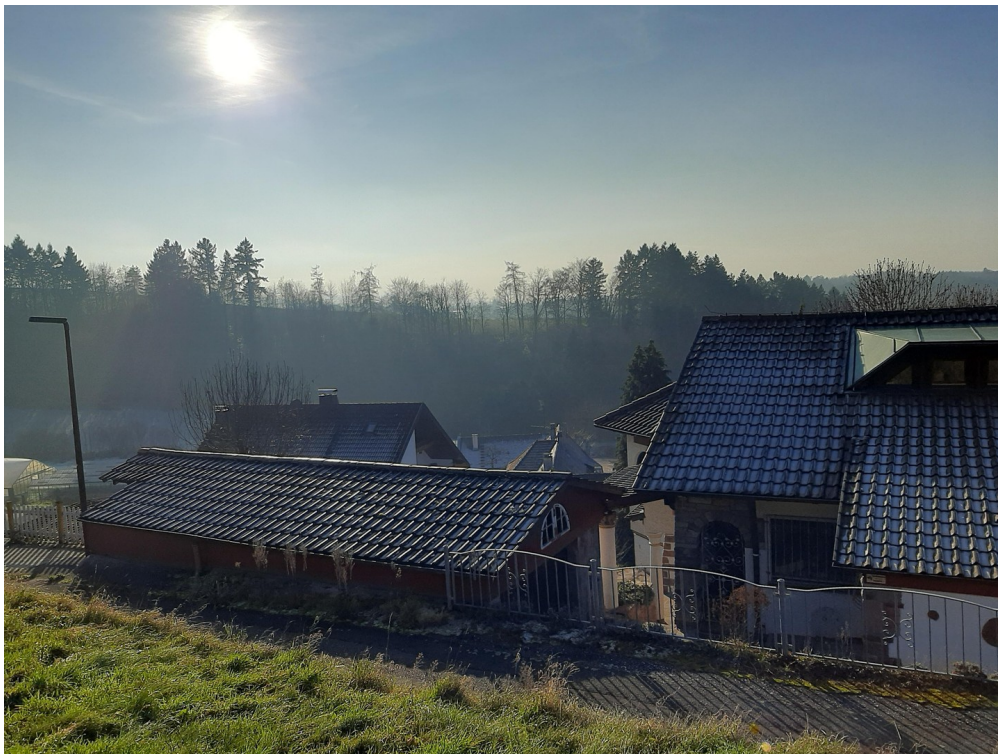
Weg und obere Einfahrt