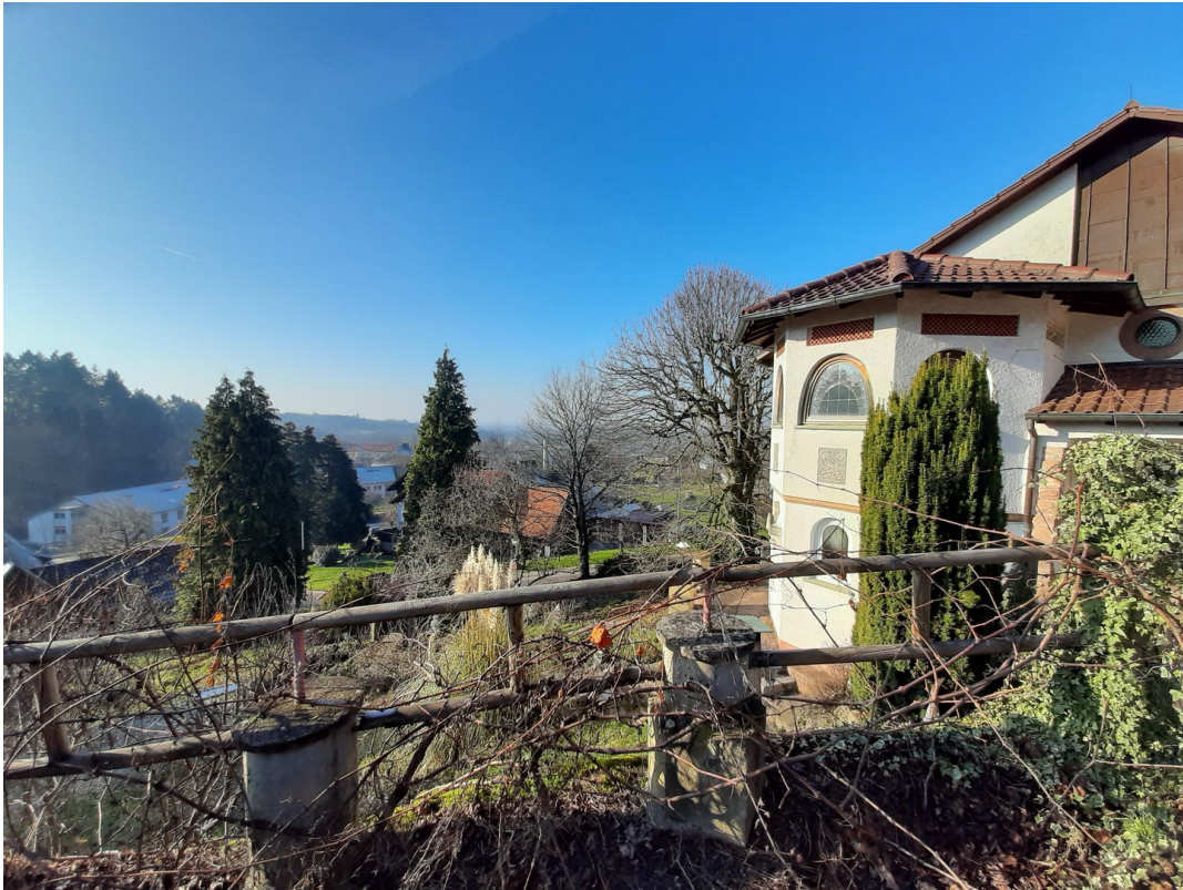
Blick v. Werkstatt auf Haus