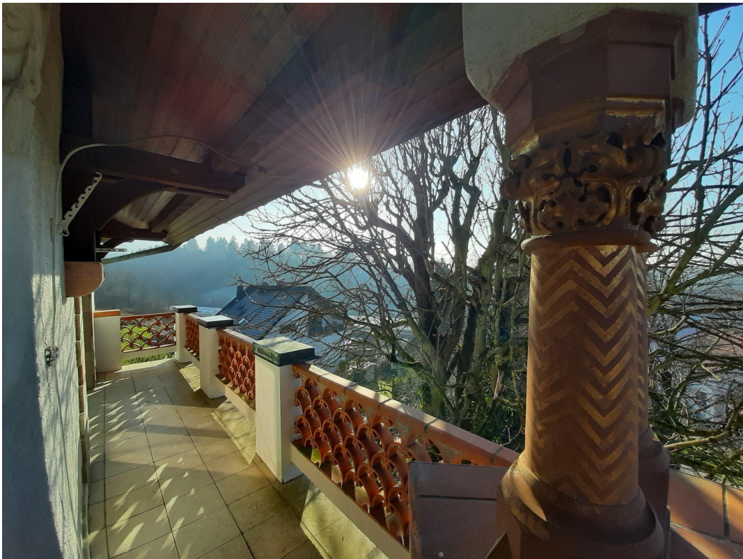
Balkon mit Blick n. Osten