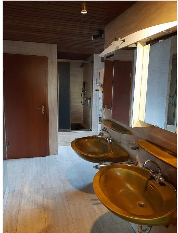
Bad in Hauptwohnung