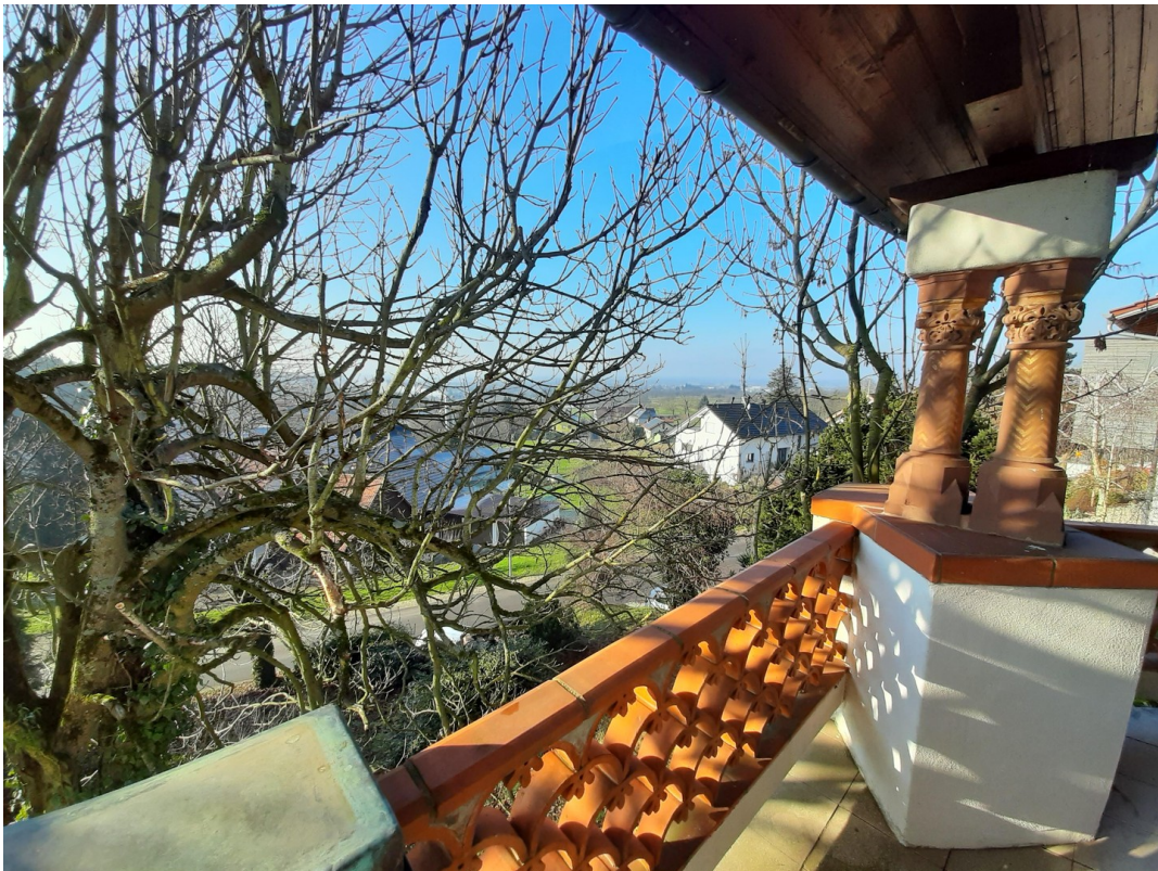
Blick vom Balkon vor Schlafz.