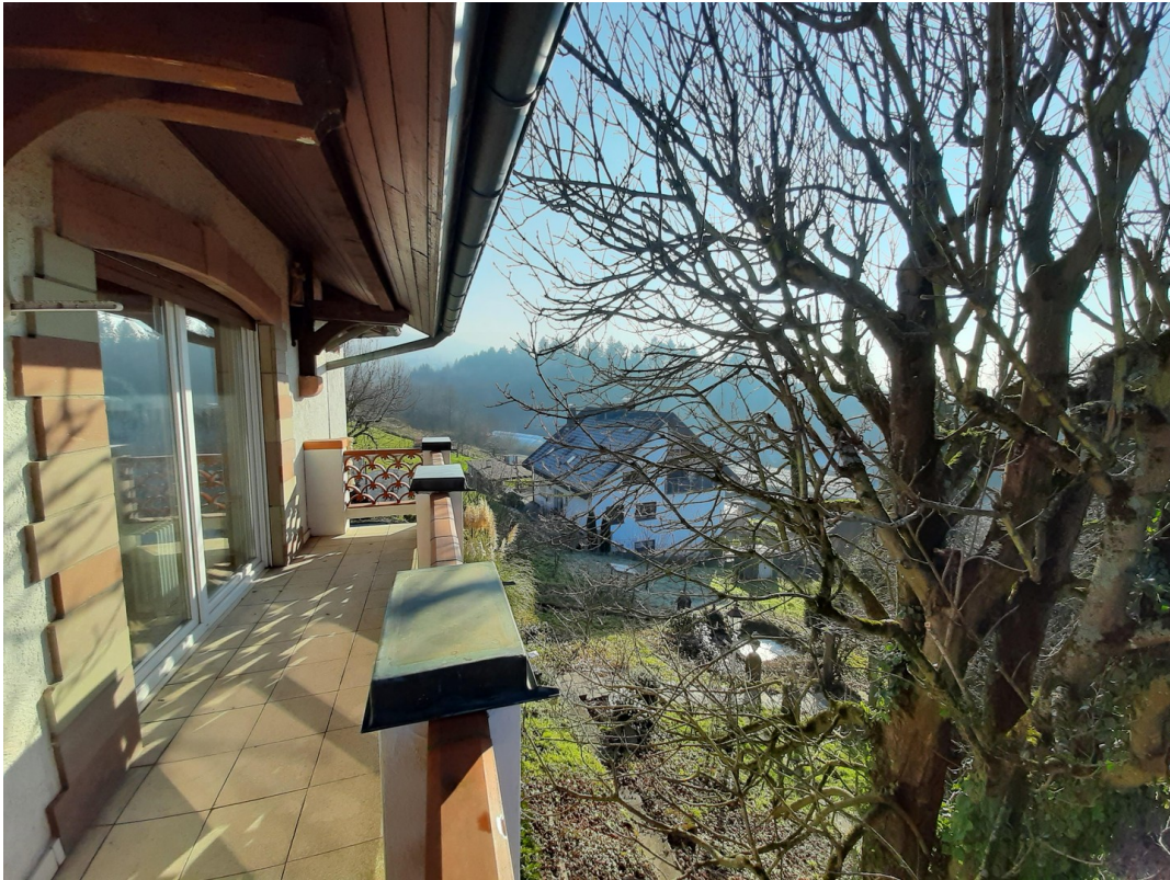
Balkon vor Schlafzimmer