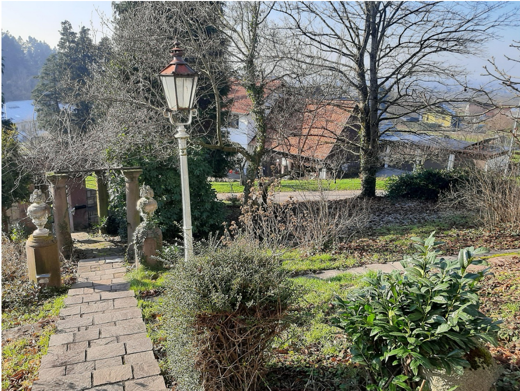
Treppenanlage von oben