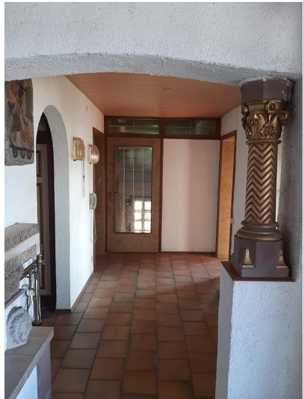
Blick v. Wohnzimmer in Flur