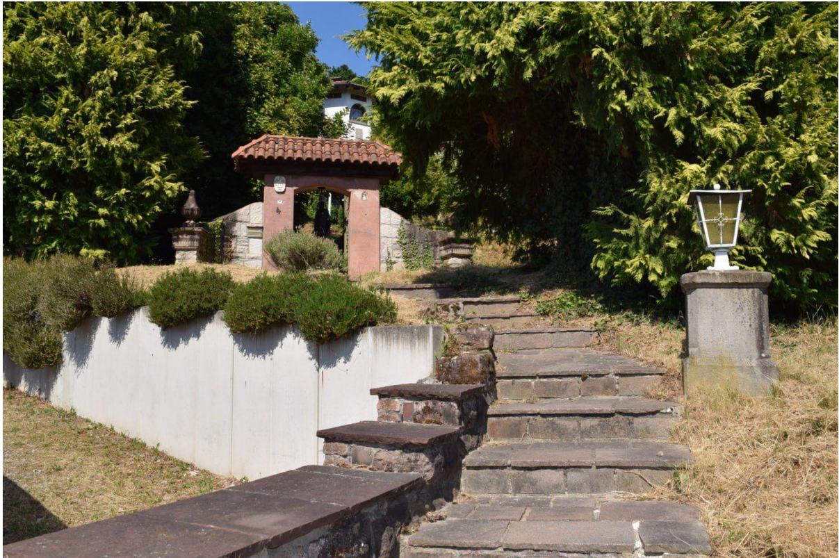
Ansicht Eingang Treppe