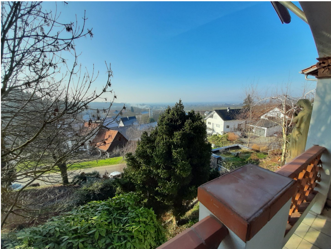
Blick v. Balkon in Rheinebene