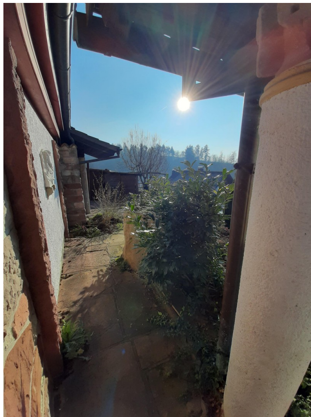
Weg zur Werkstatt