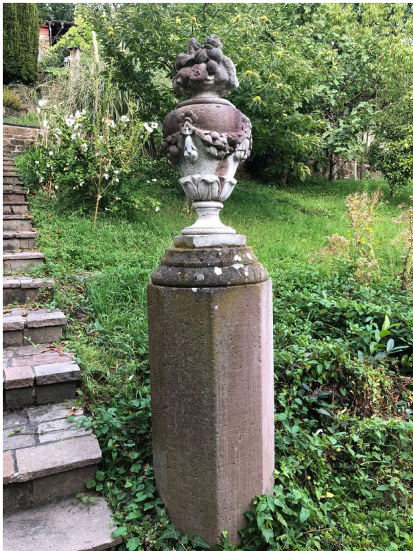
Steinsäule an Treppe