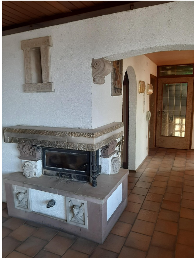
Heizkamin im Wohnzimmer