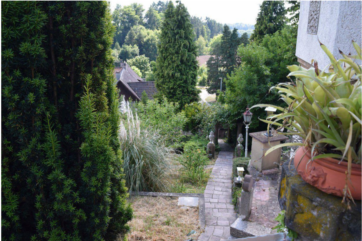
Blick v.Haupteingang i. Garten