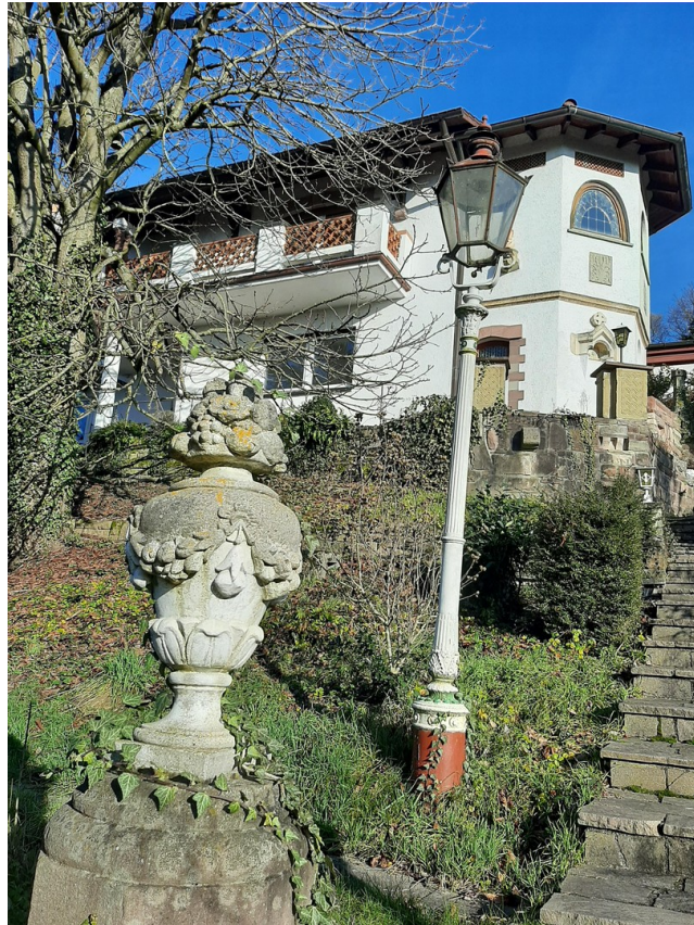
Hausansicht v. Garten