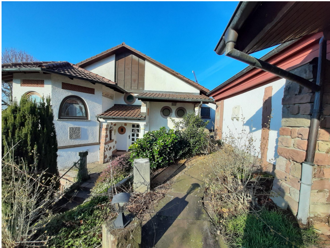
Weg zu Werkstatt