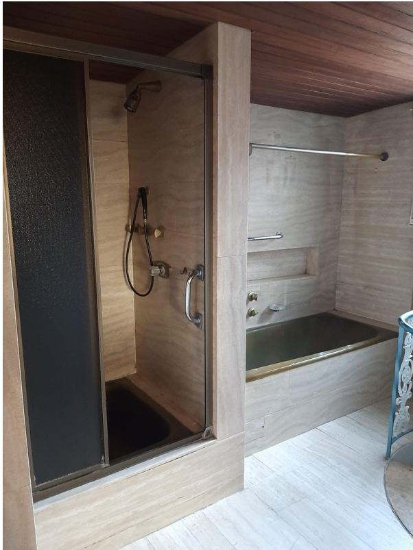
Bad in Hauptwohnung