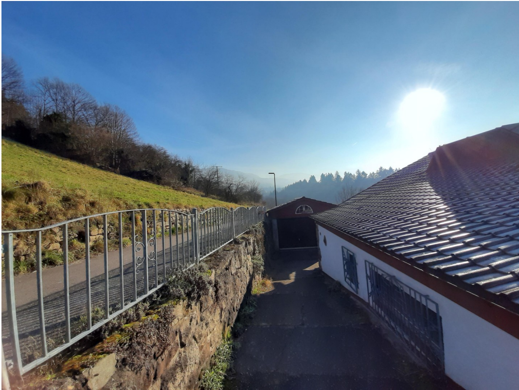
Wegeinfahrt mit Garage