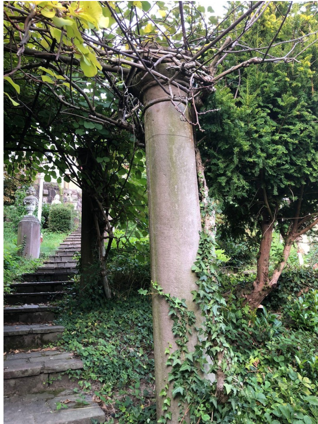
Säulenanlage an Treppe