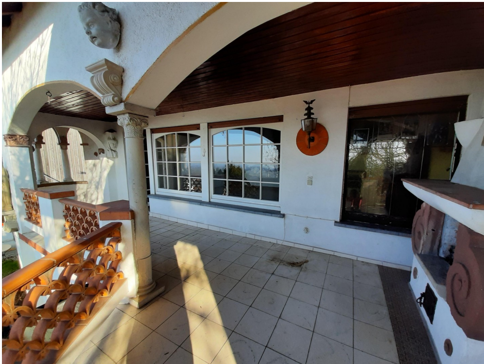
Balkon m. offenem Kamin