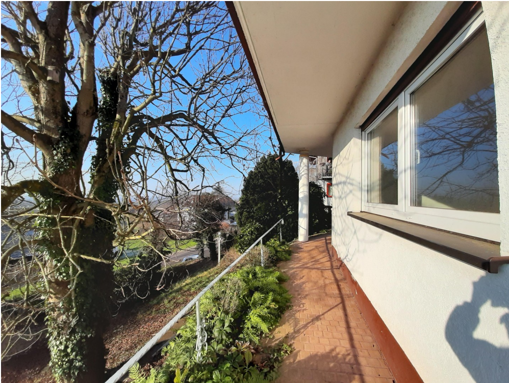
Zugang zur Einliegerwohnung