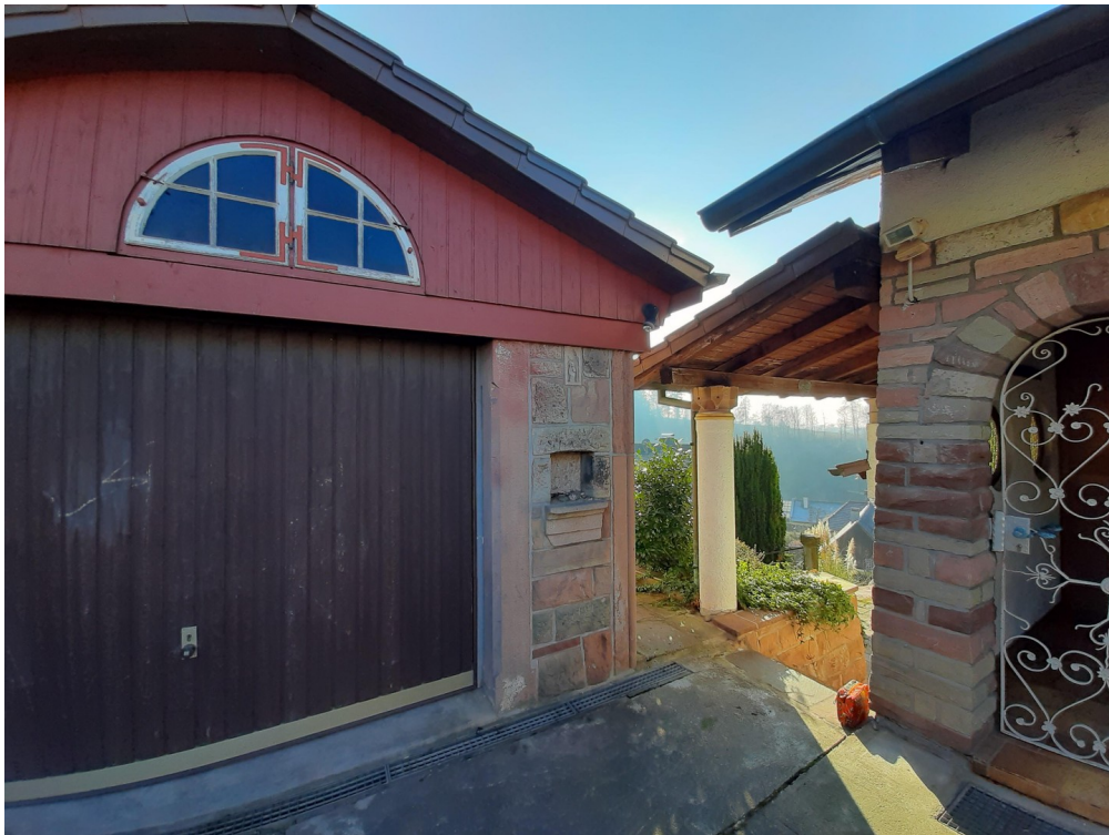
Garage bei Wegeeinfahrt