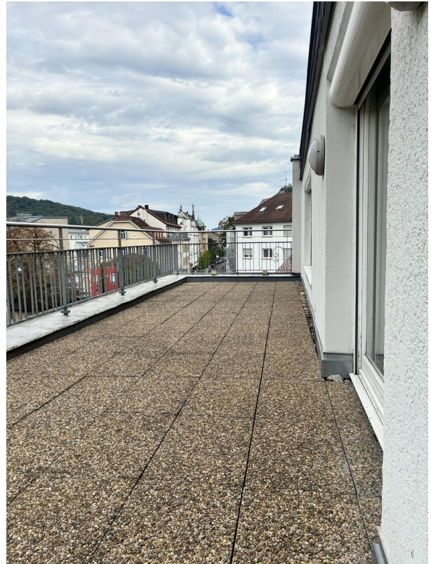
Dachterrasse mit Blick City