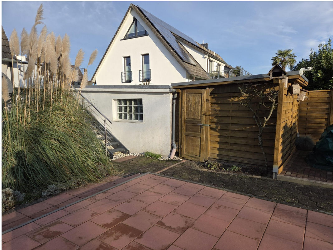
Gartenschuppen und Garage