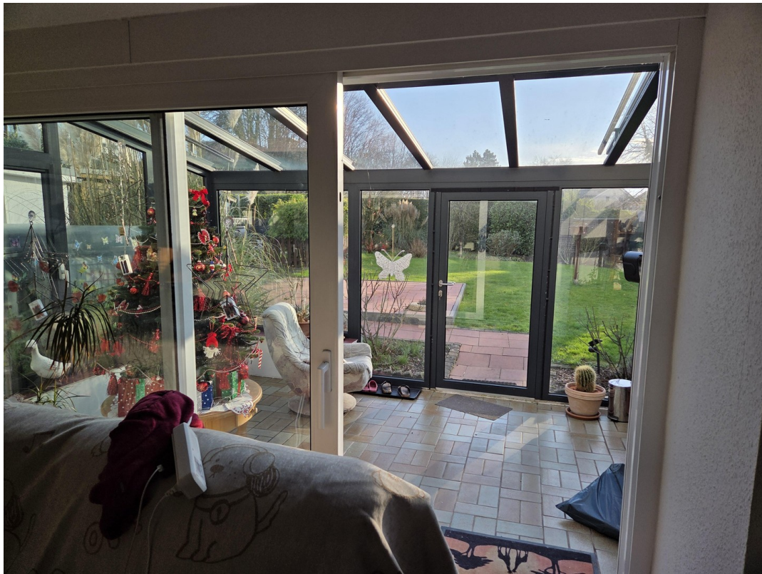
Blick WZ EG in Wintergarten