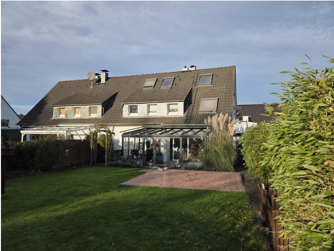
Gartenansicht mit Wintergarten