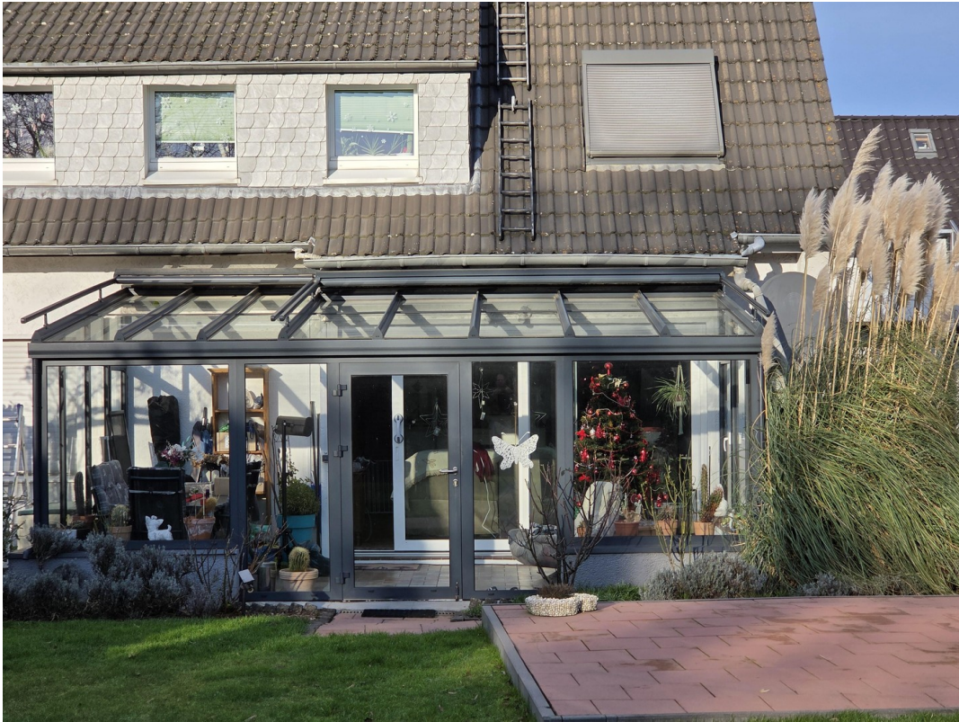
Wintergarten von Rückseite