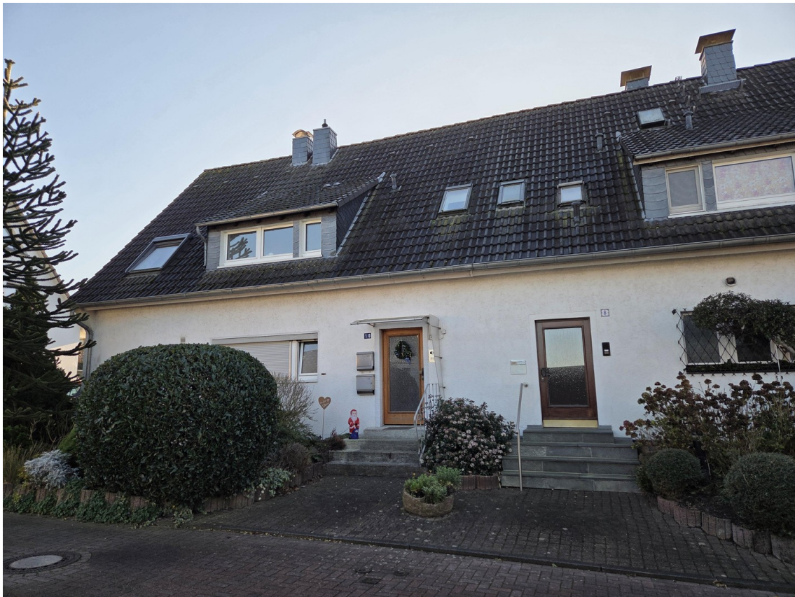
Ansicht von der Straße