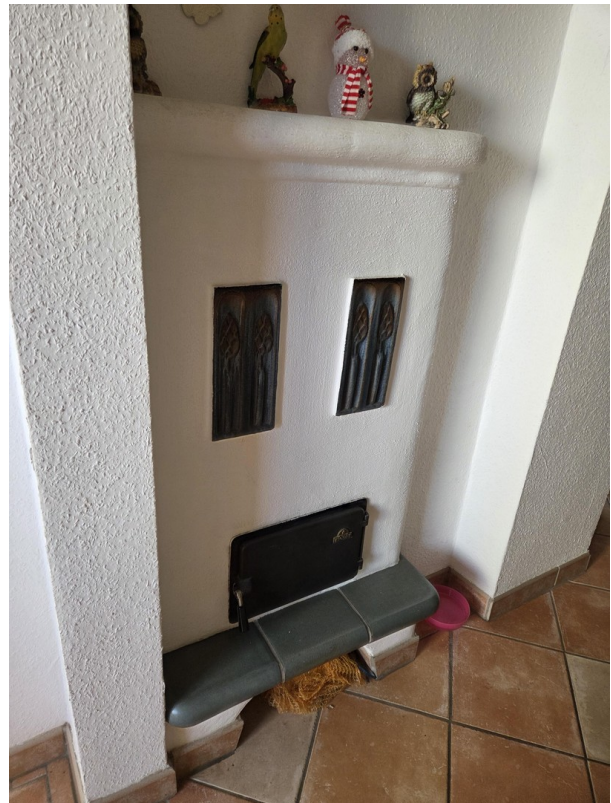
Ofen von Flurseite EG