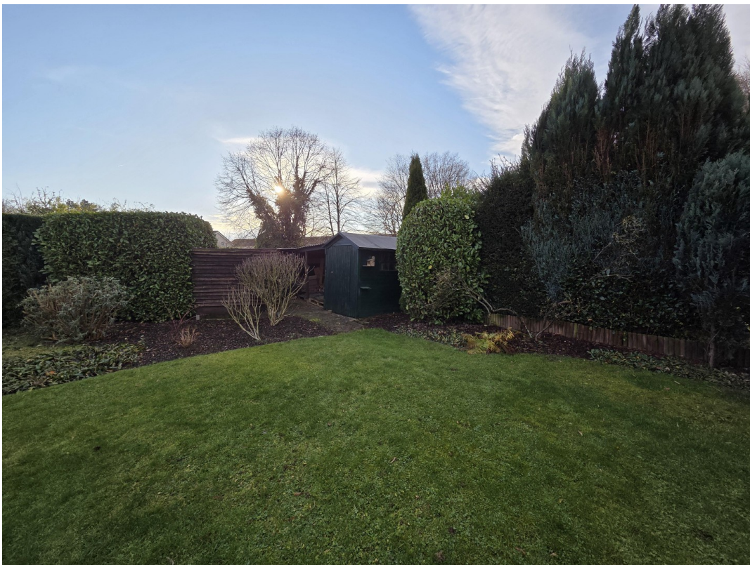
Garten mit Schuppen