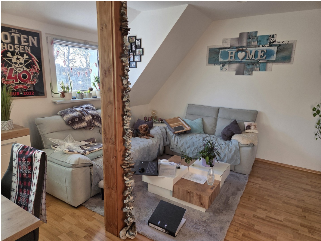
Wohnzimmer 1. OG