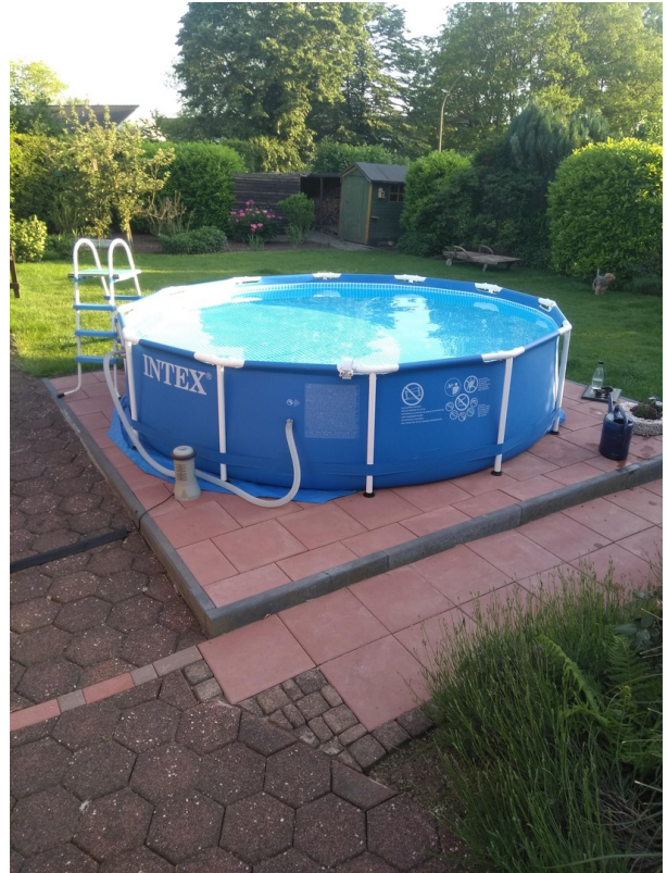
Aufstellpool im Garten