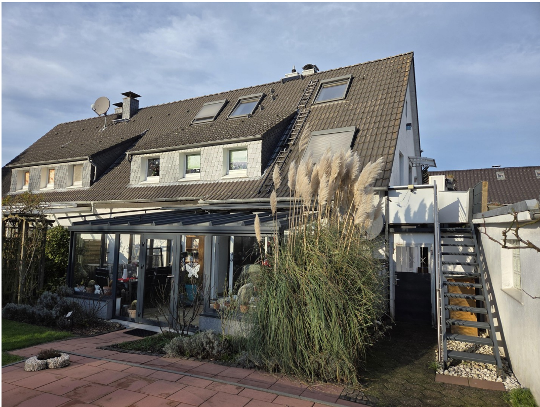
Außentreppe zum 1. OG