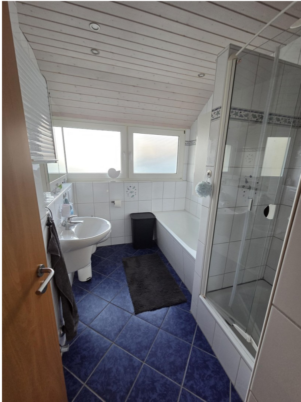
Masterbad 1. OG