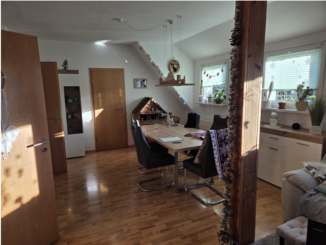
Eßzimmer 1. OG