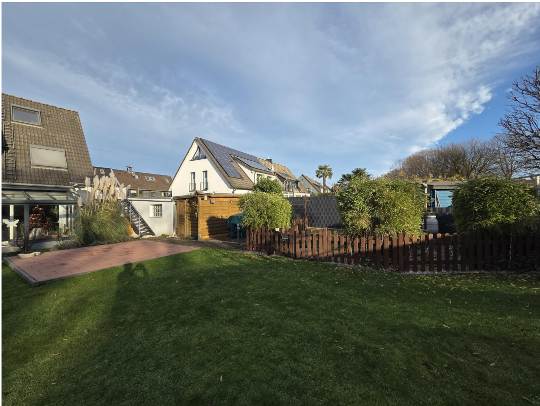
Haus und Garten