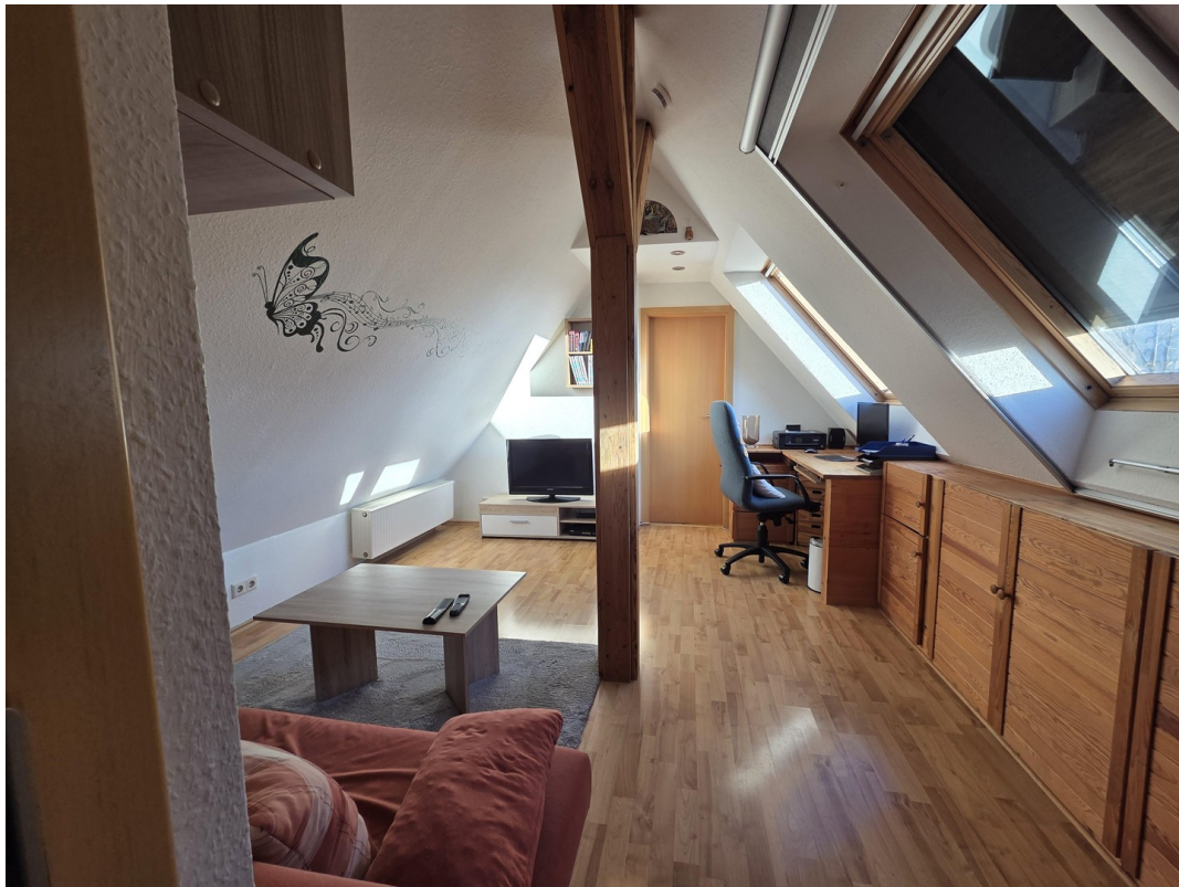
1. Zimmer 3. OG