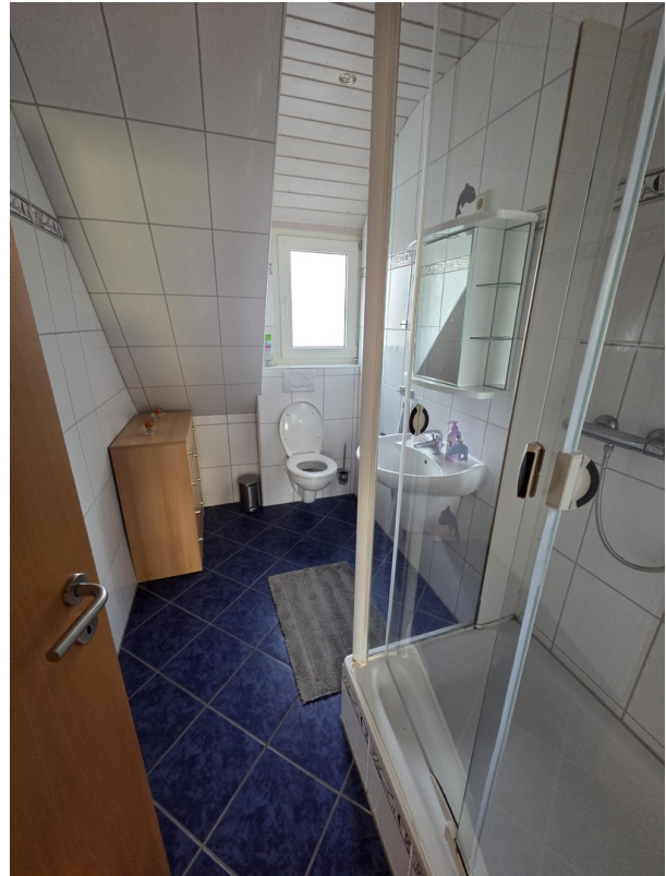
Gästebad/Bad für 3.OG