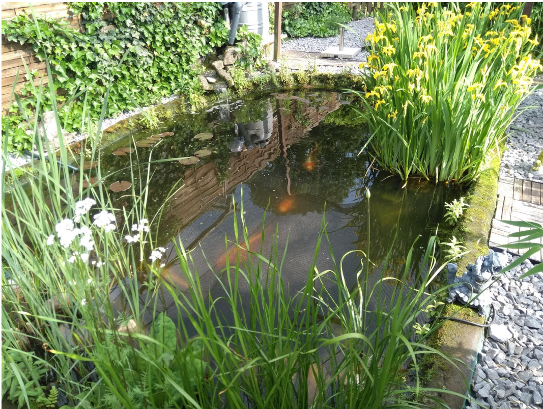
Teich mit großen Kois