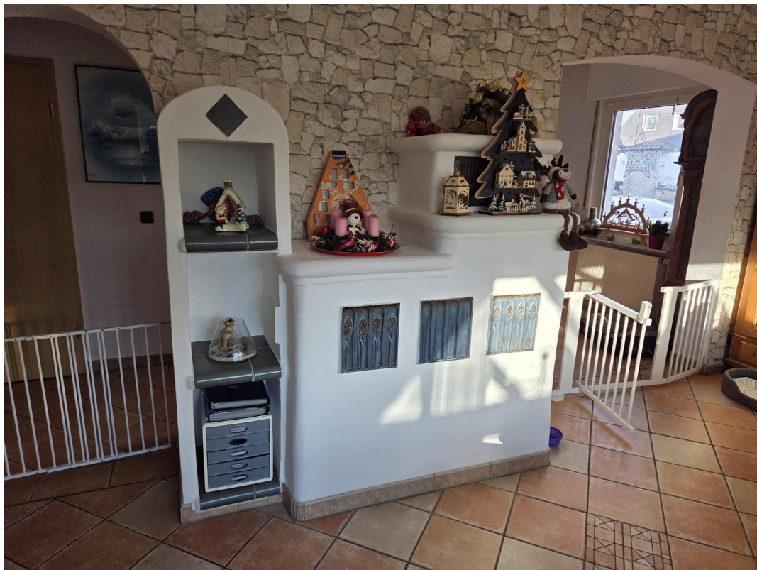
Ofen vom Wohnzimmer EG