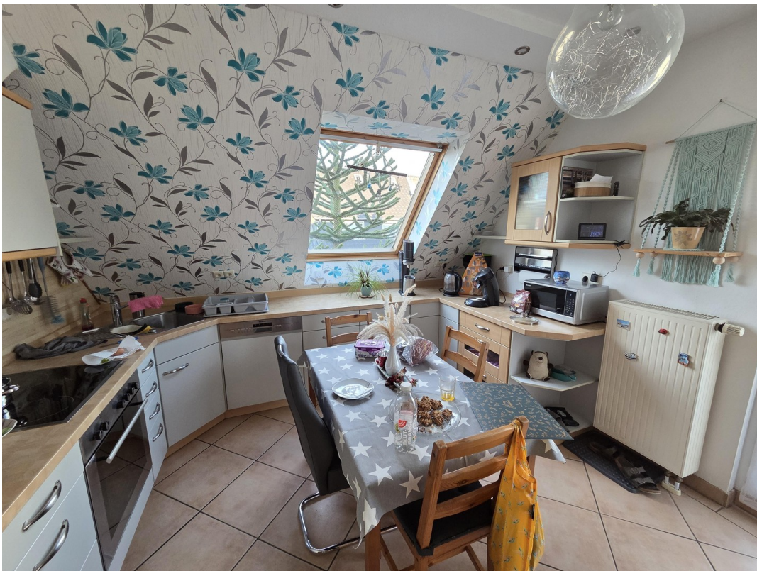
Küche 1. OG