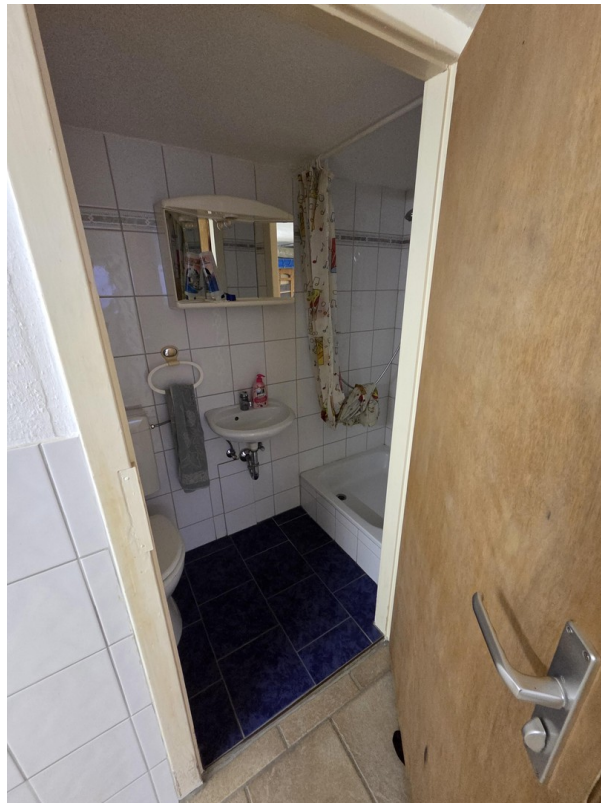
Saunadusche im Keller