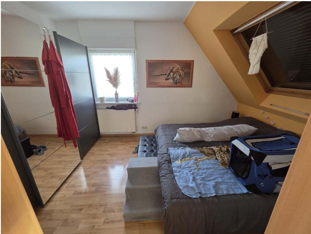
Schlafzimmer 1. OG