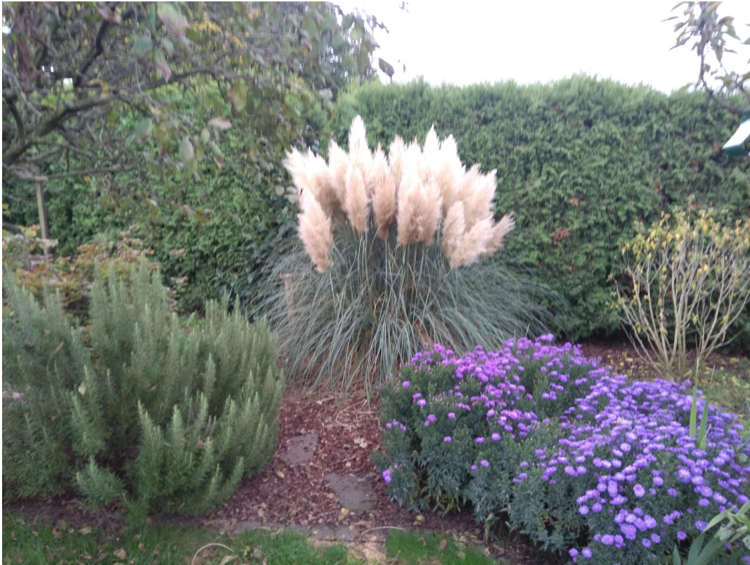
Garten im Herbst