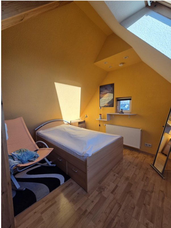
2. Zimmer 3.OG