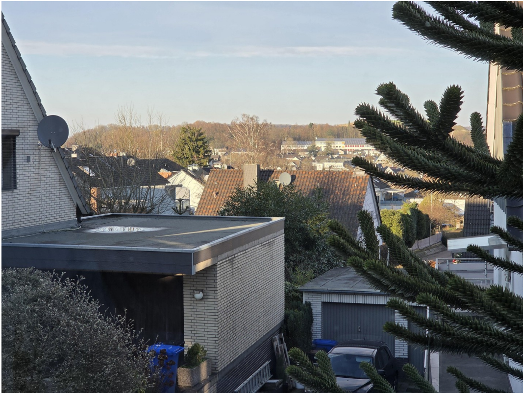
Blick aus Küche 1.OG