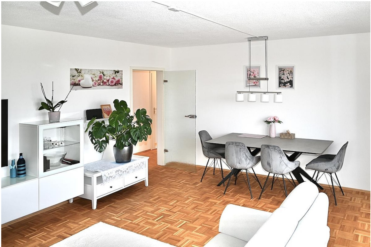
Wohnzimmer Blick auf den Flur