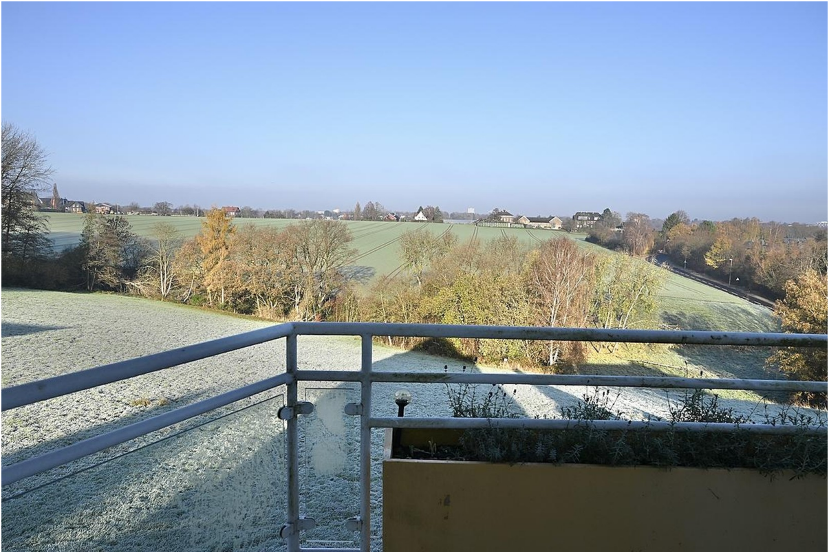
Weitblick vom Balkon