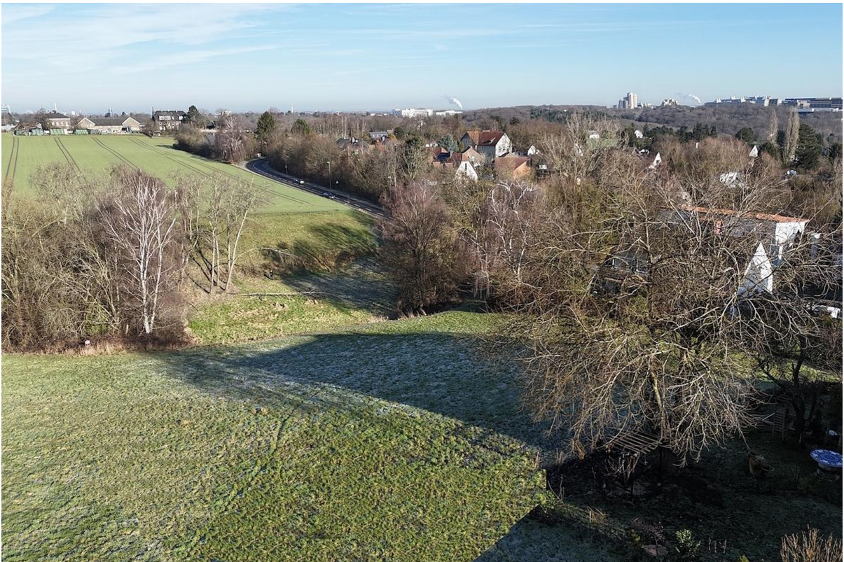
Weitblick vom Balkon