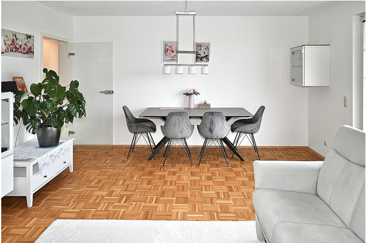
Wohnzimmer Blick auf Essber.