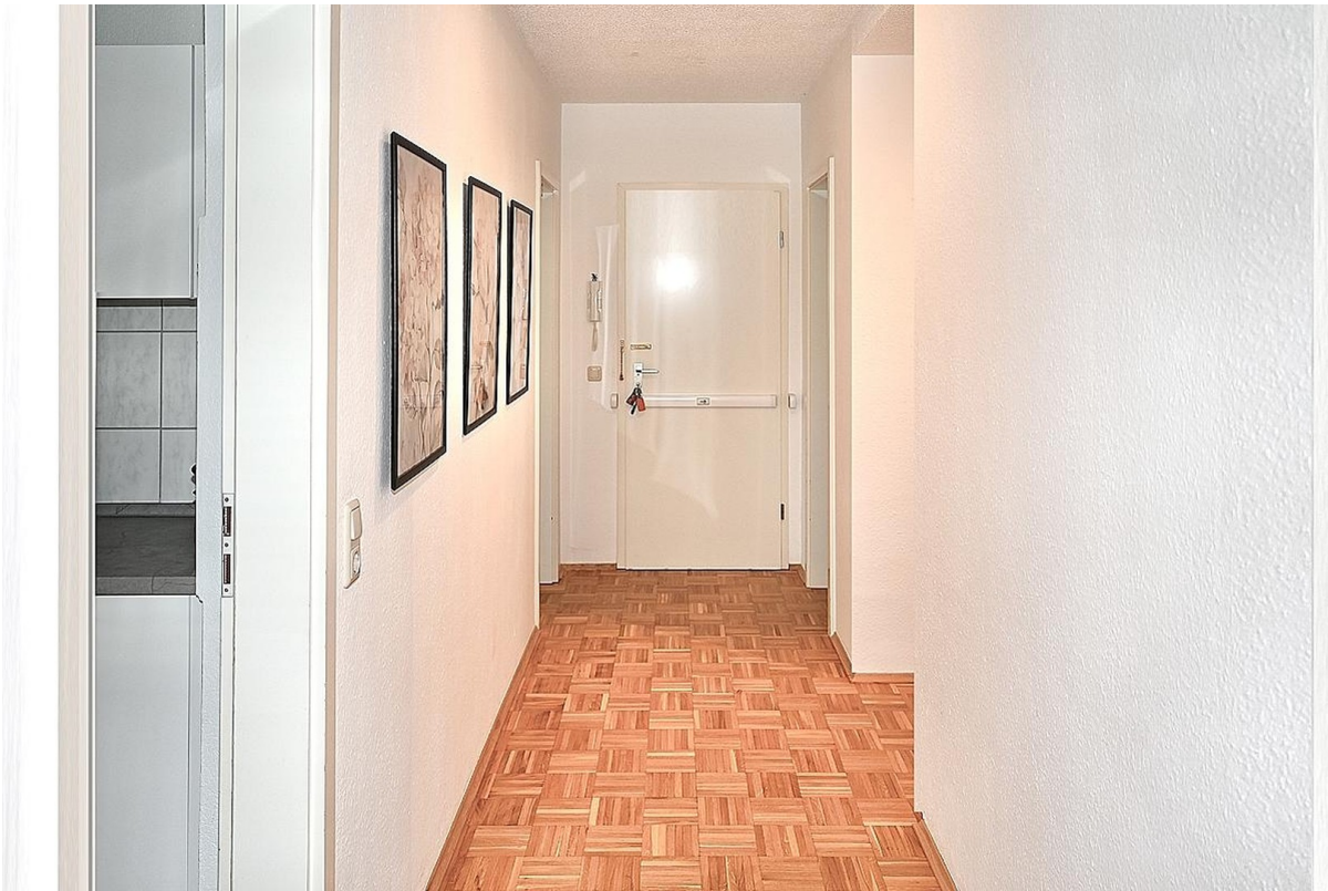
Flur der Wohnung