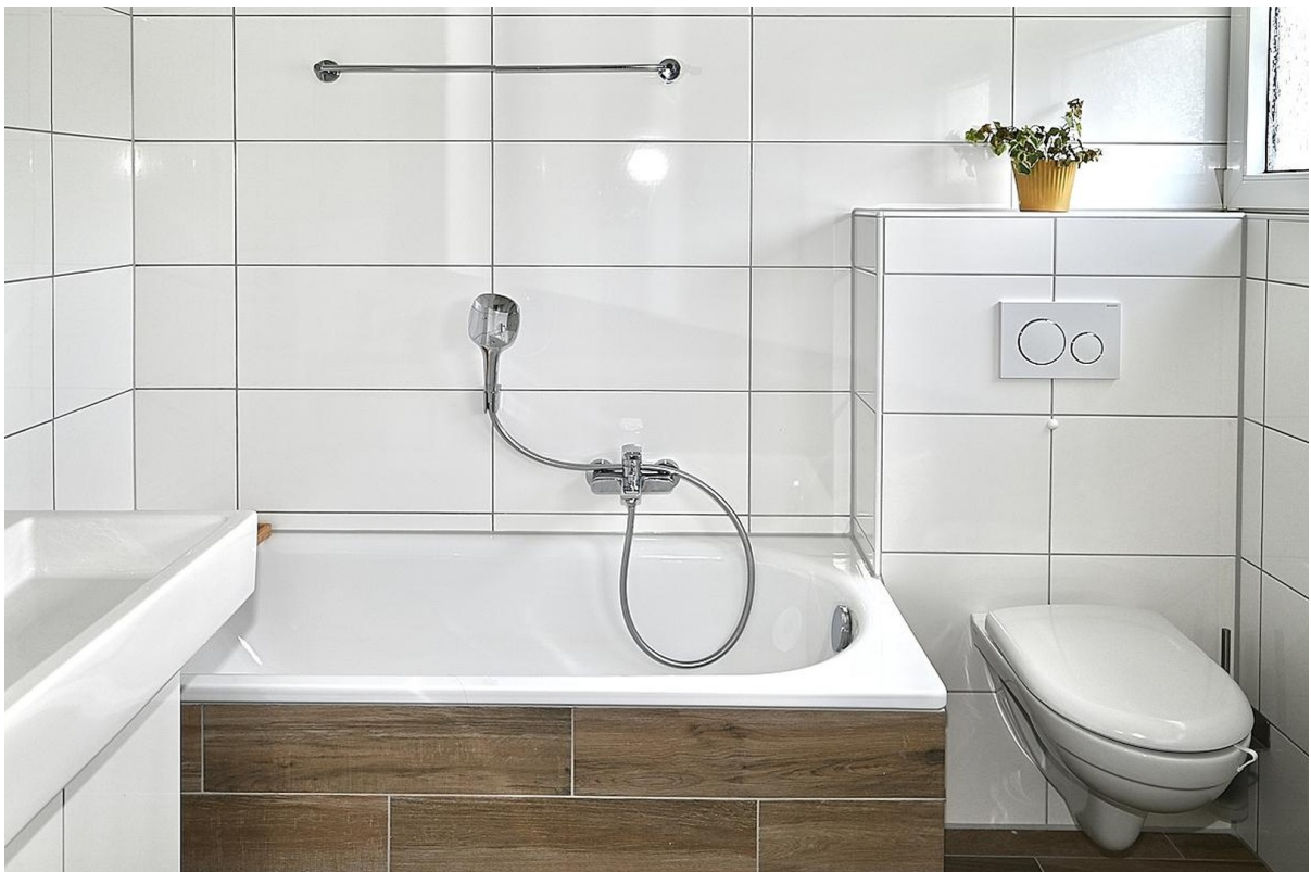
Masterbad mit Badewanne