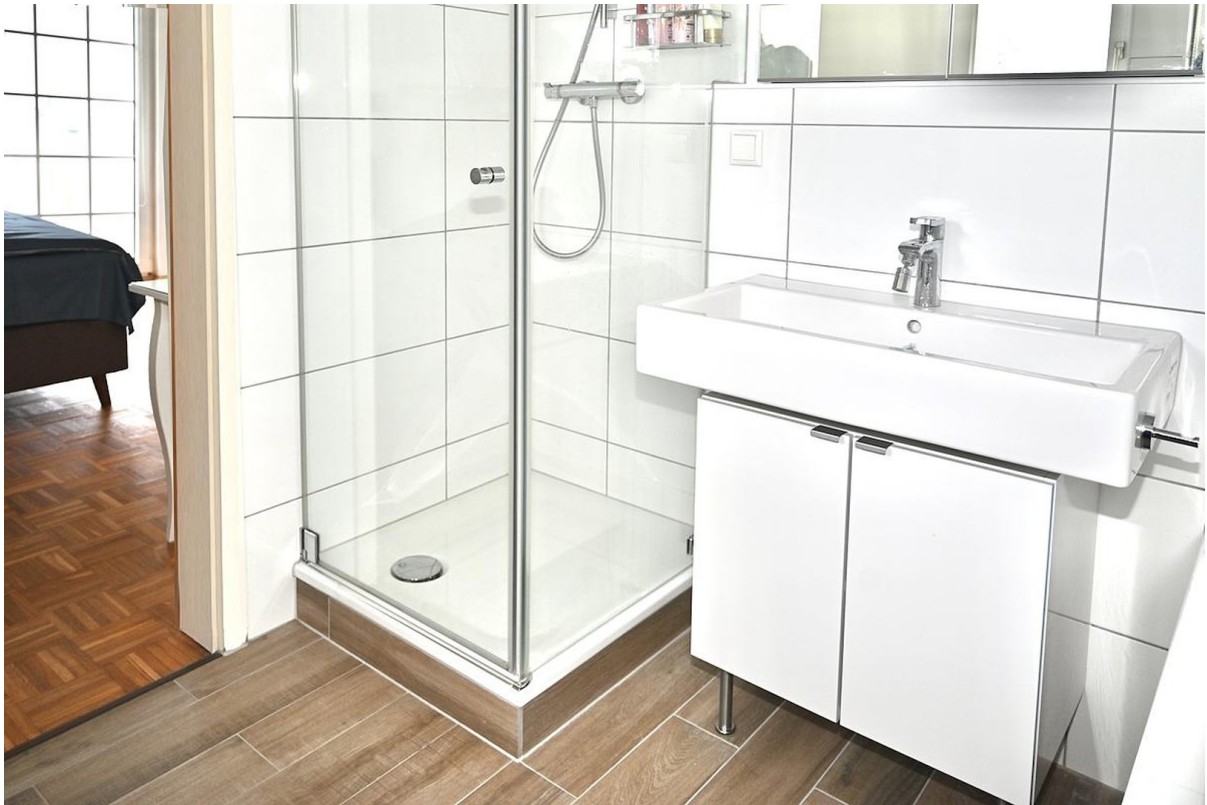
Masterbad mit Dusche