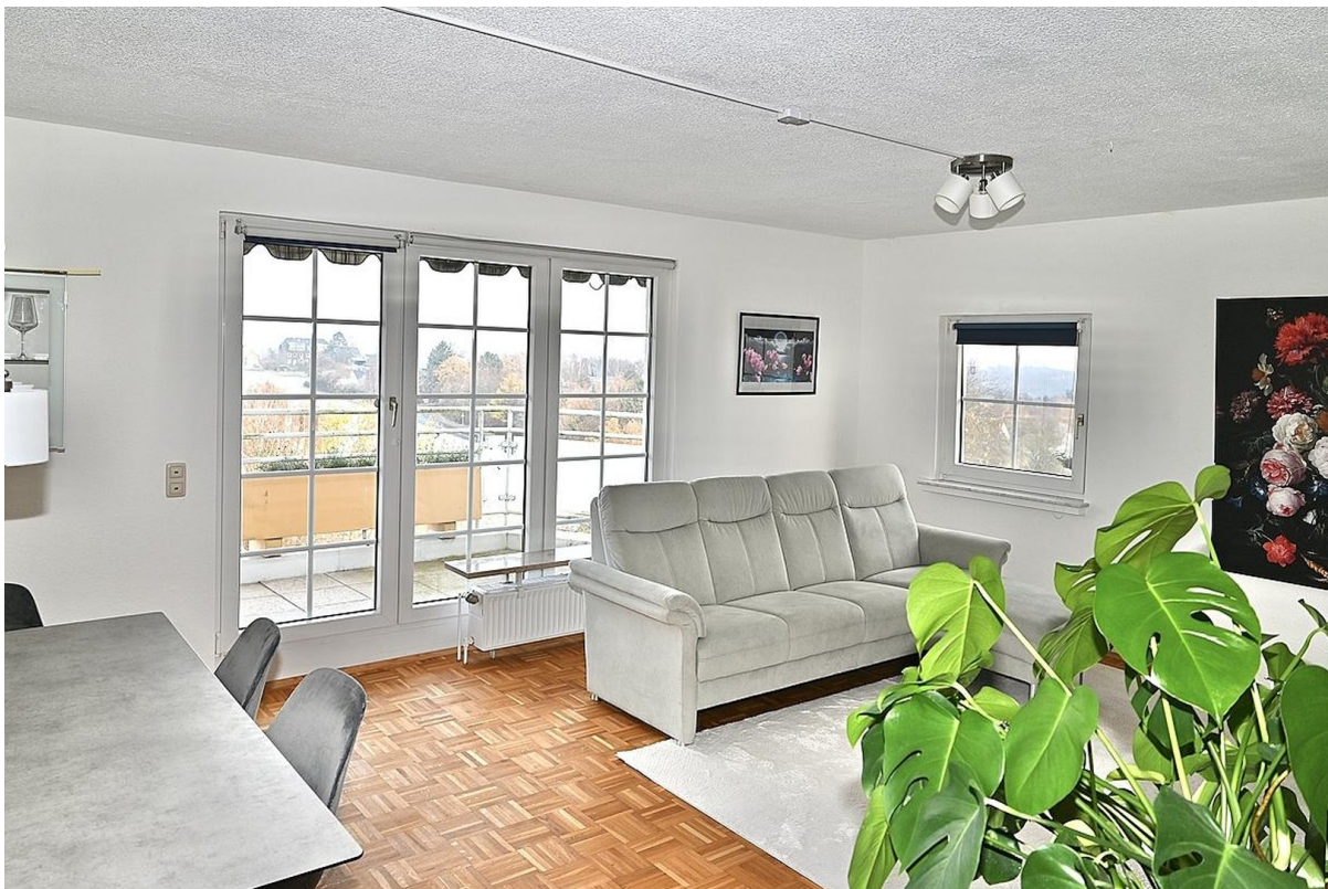
Wohnzimmer Balkontür Weitblick