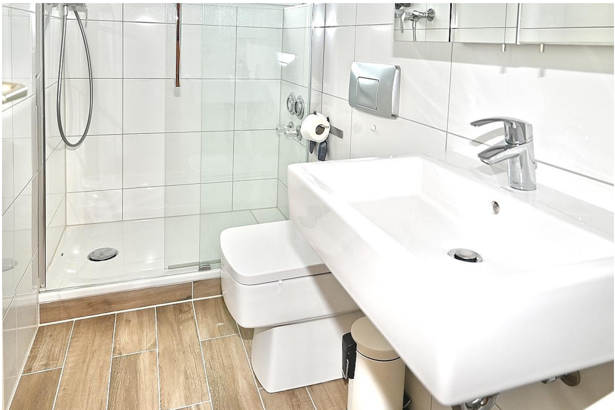
Zweites Badezimmer mit Dusche