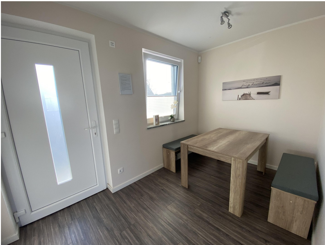
Essbereich / Eingang