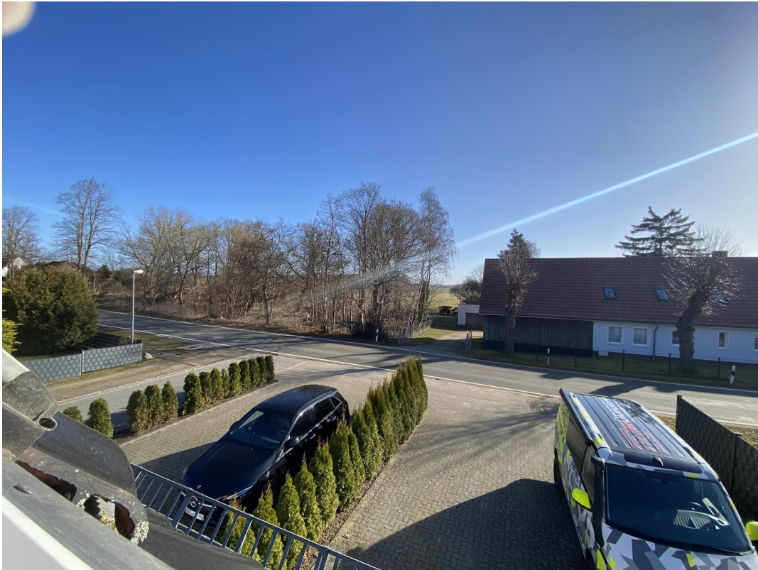
Blick in die Natur