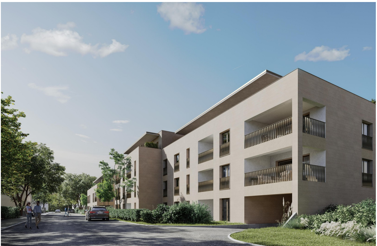
Visualisierung Haus C