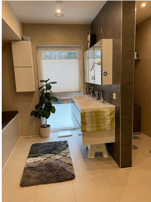
Vollbad mit Regendusche&Wanne