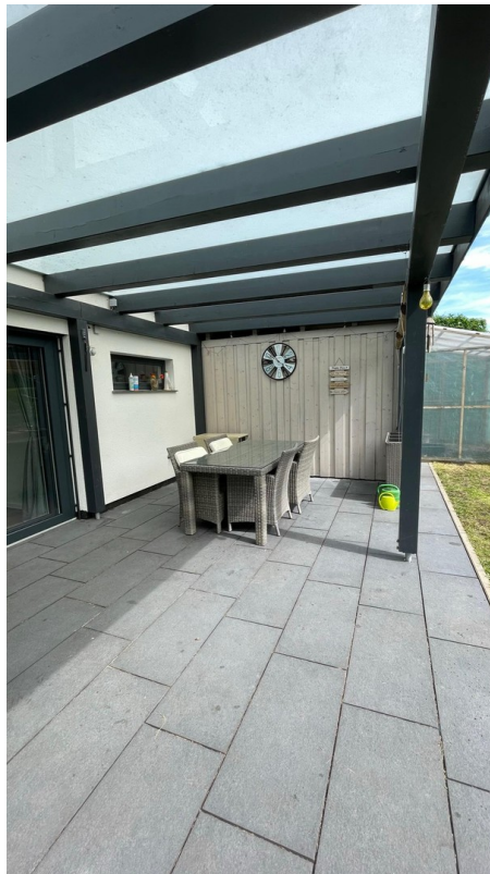
Terrasse mit Milchglas-Dach