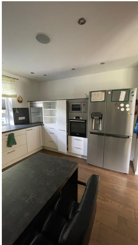
Küche mit Tageslicht