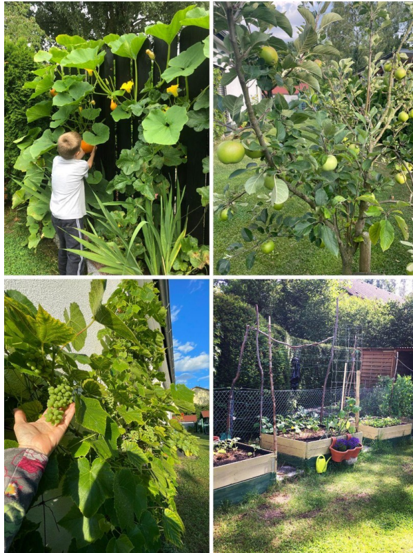
Grüne Oase mit Obst und Gemüse