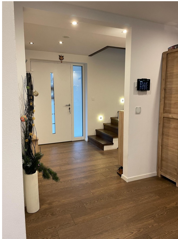
Eingang mit SmartHome-Zentrale