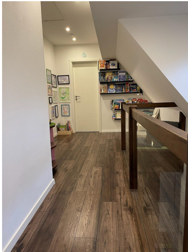
Flur OG mit Lesecke