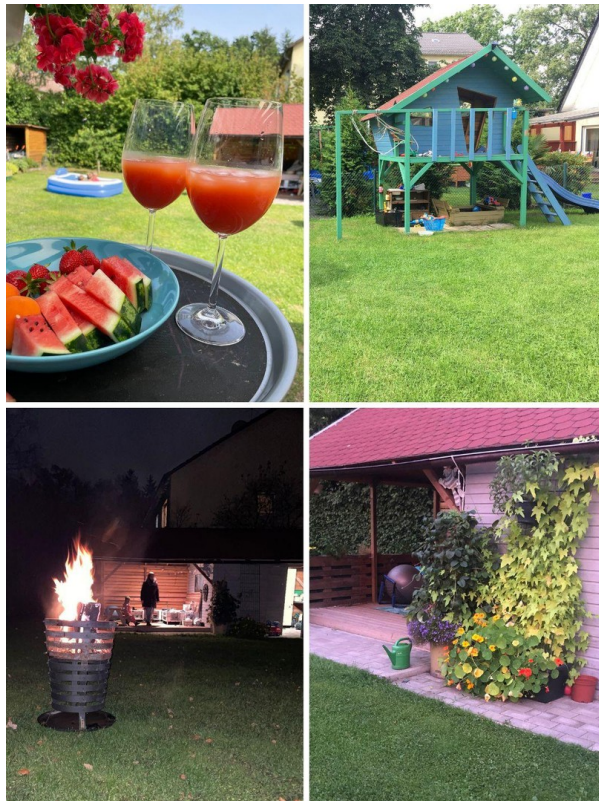
Familienleben im Garten