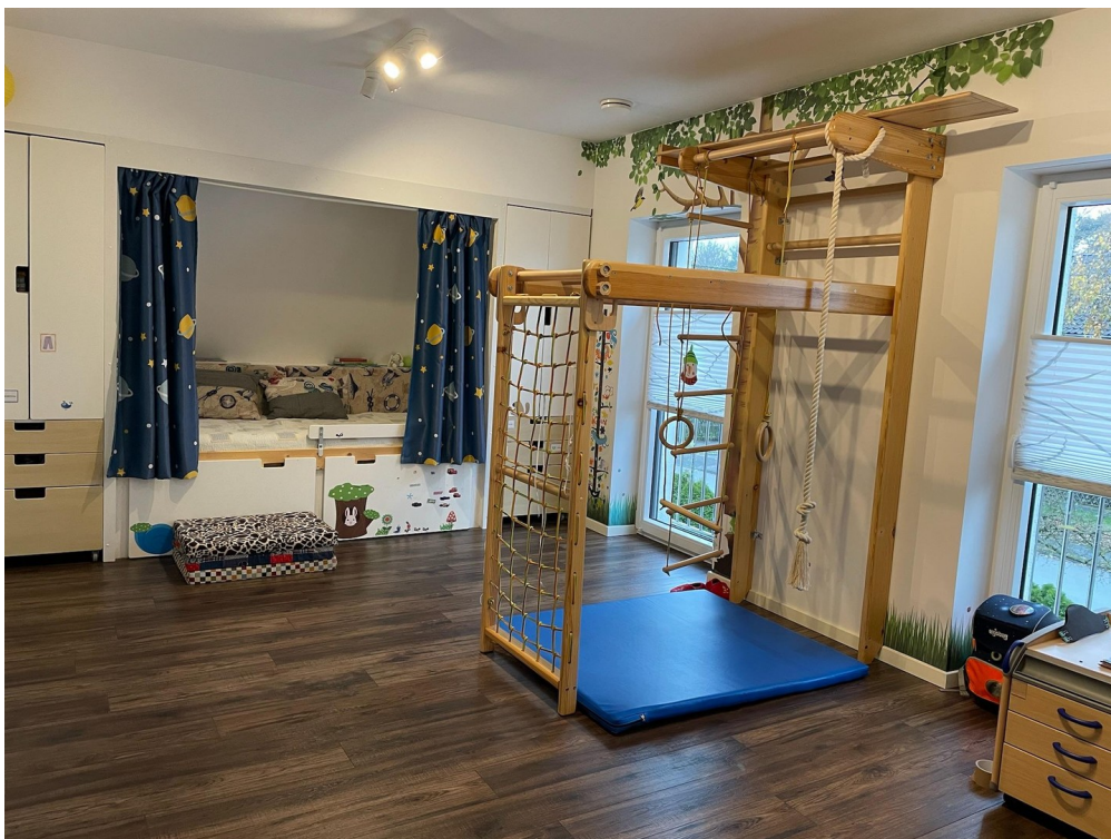
Kind 1 (klappbares Spielgerüst)