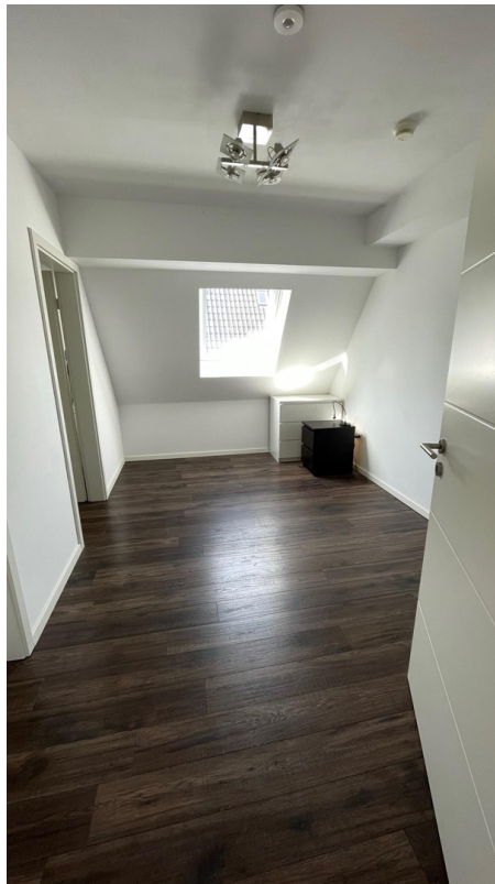
E-Schlafzimmer mit Ankleide