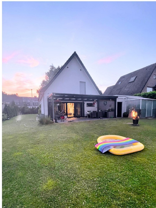
Hausansicht vom großen Garten