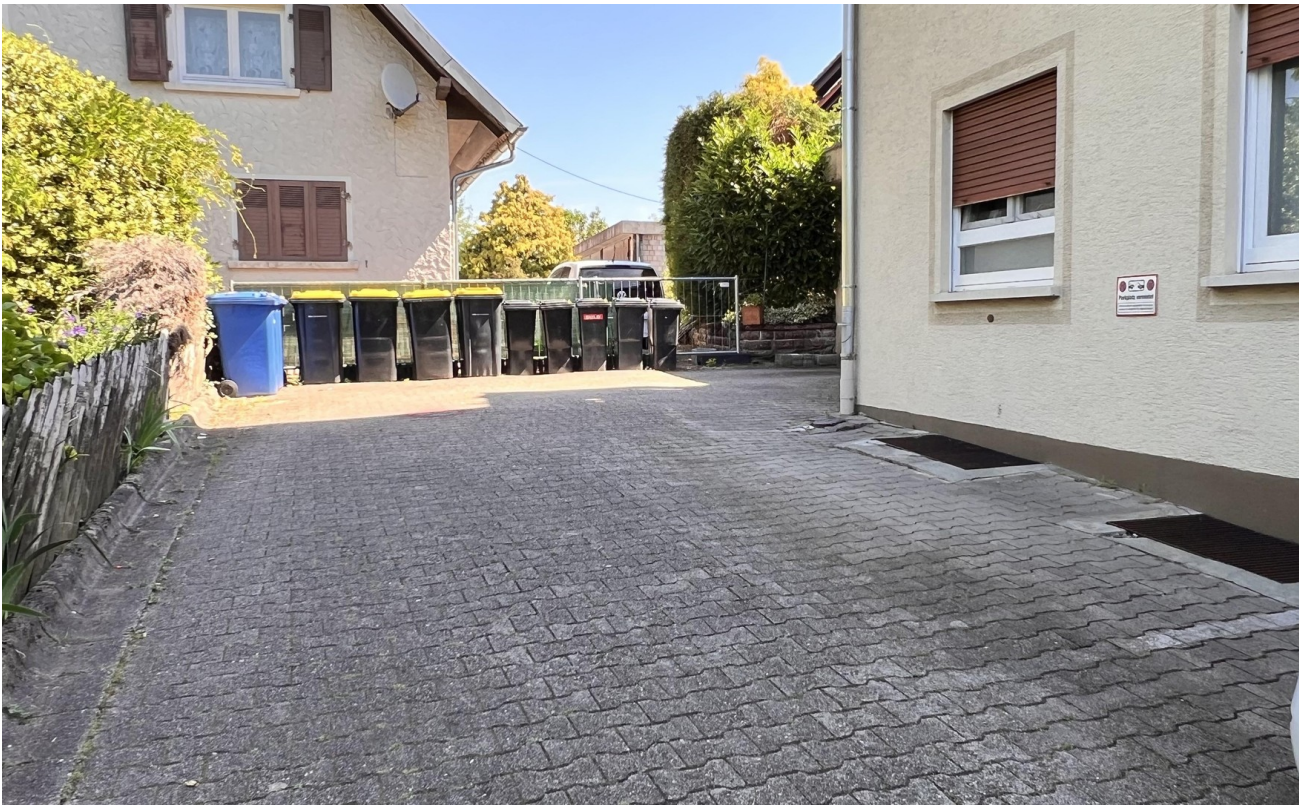
Hof mit Stellplätzen