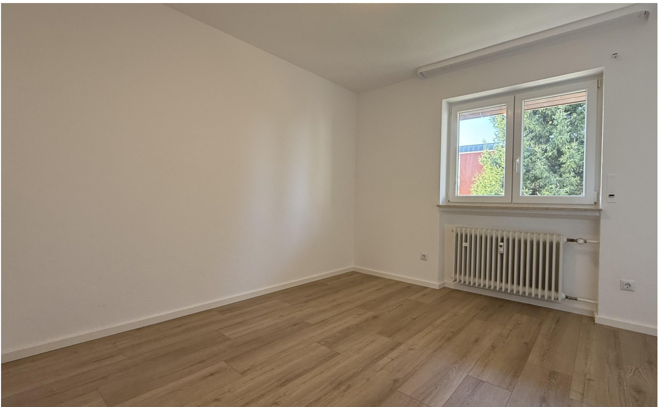
Kinderzimmer 1 leer