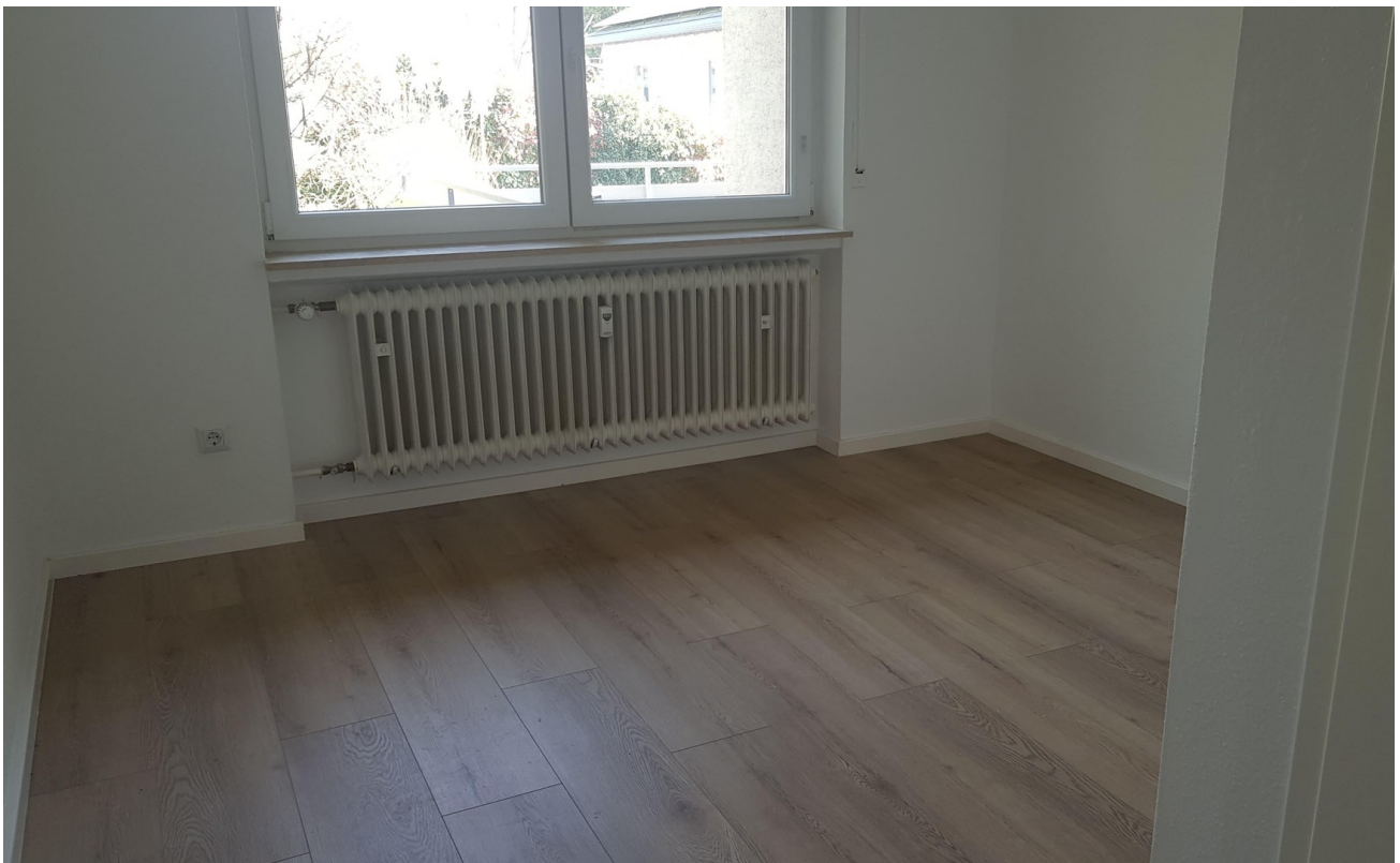
Kinderzimmer 2 leer