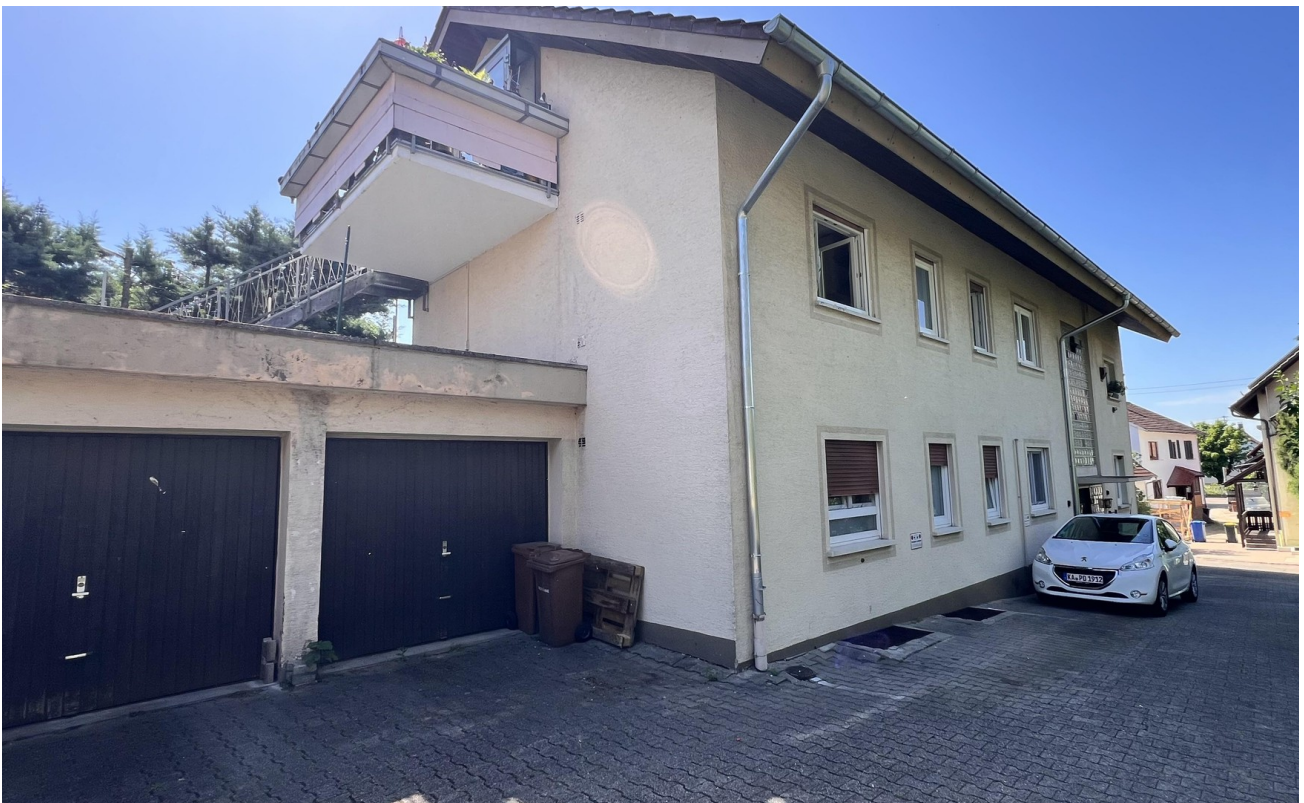
Hof mit Stellplätzen