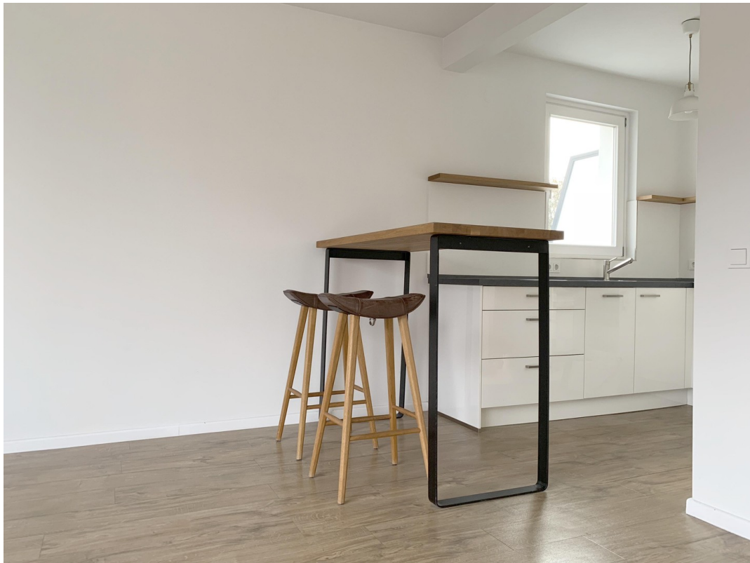
Offene Küche mit Hochtisch