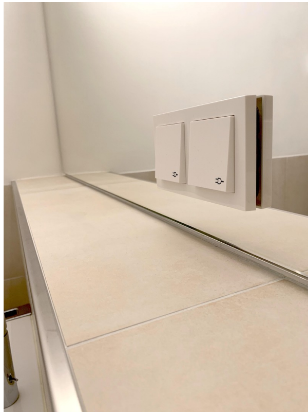
Spiegel Bad mit Elektro