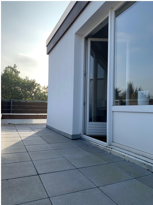
Terrasse mit Wohnungseingang