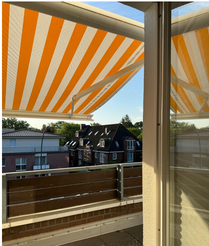
Elektrische Markise MARKILUX