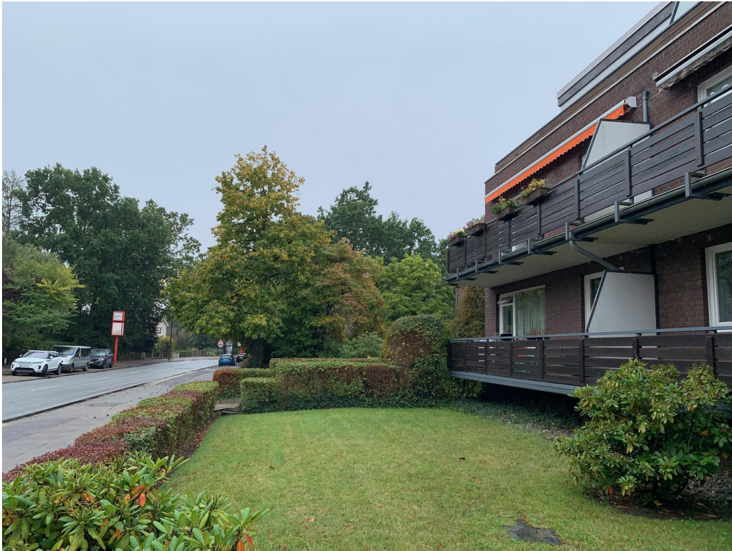
Hausansicht mit Garten