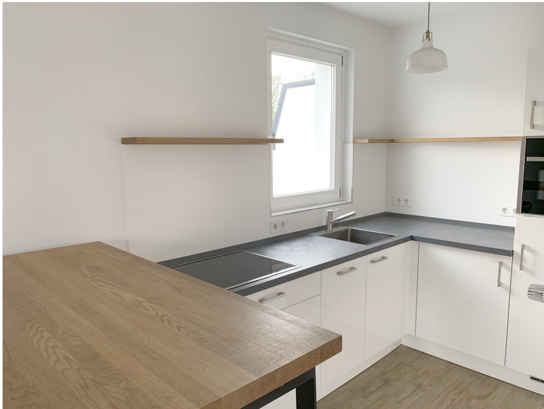
Einbauküche mit Eichenregalen