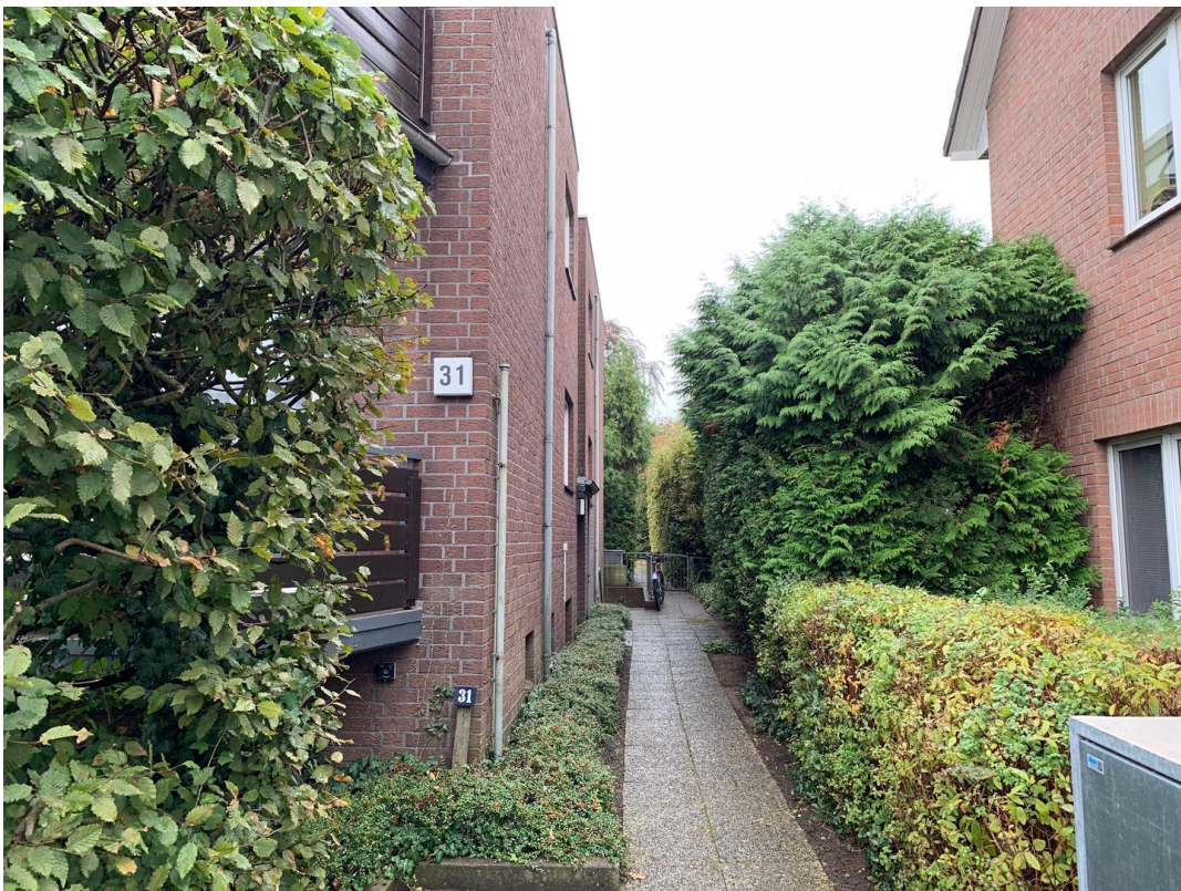
Zugang zum Haus