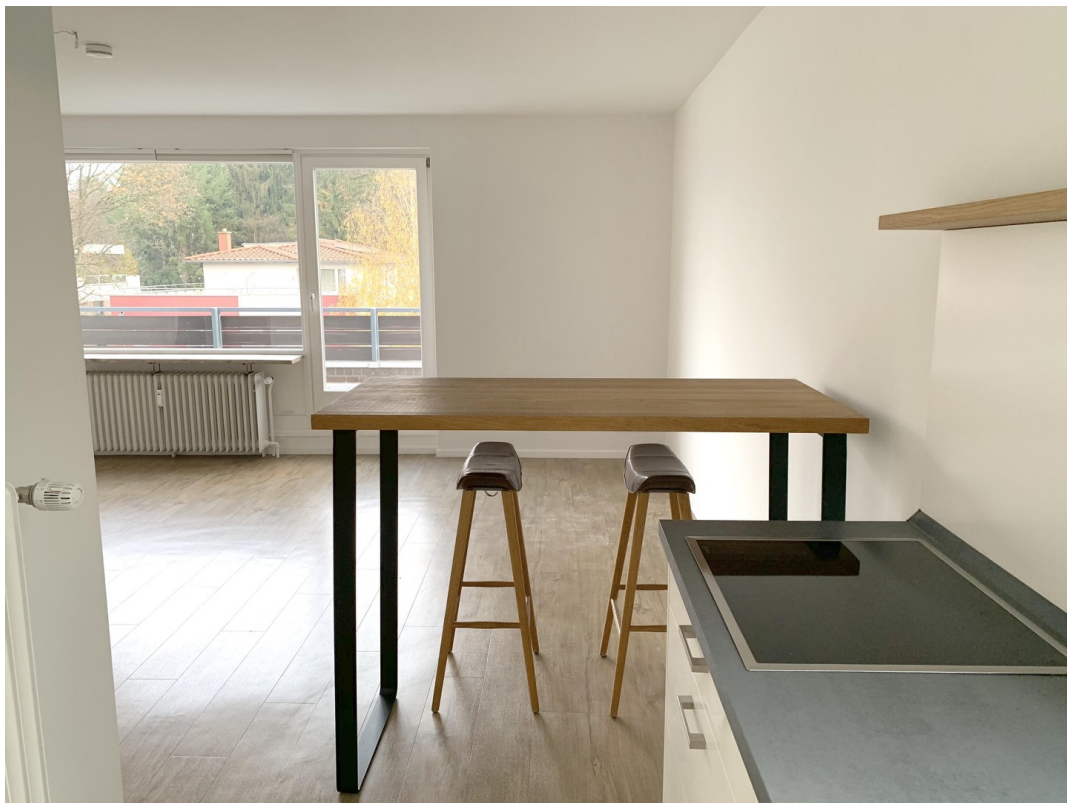
Blick aus Küche