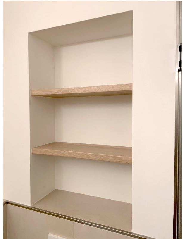
Tischlerarbeit Badregale Eiche