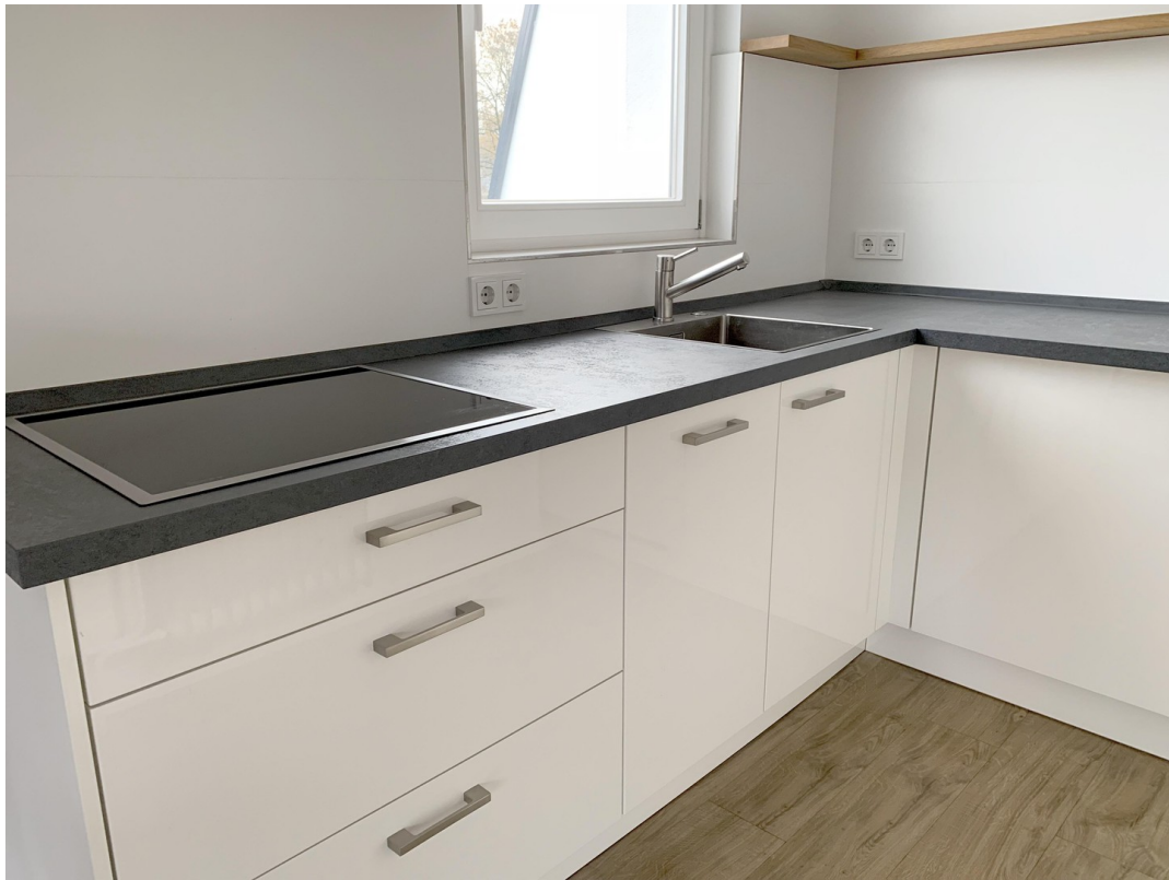
Einbauküche mit NEFF Geräten