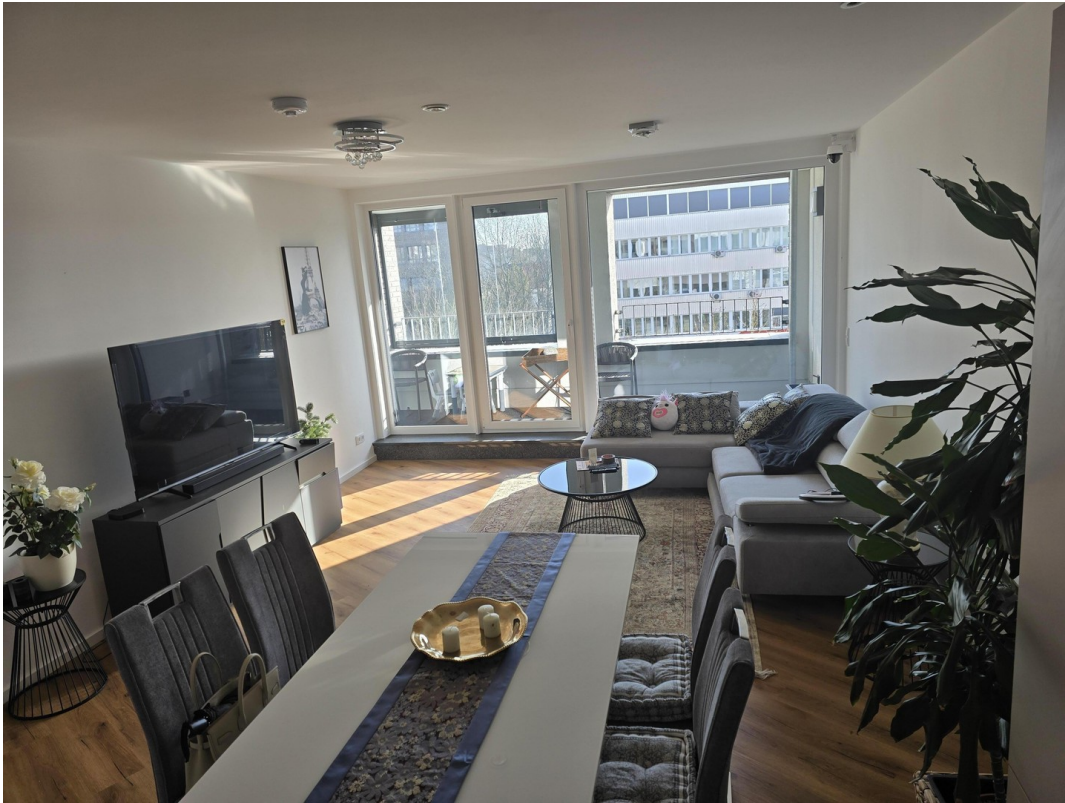
Wohn.- und Essbereich