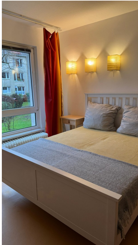
In etwa: Schlafzimmer