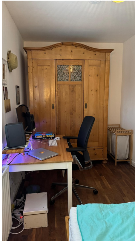
Schlafen und arbeiten.