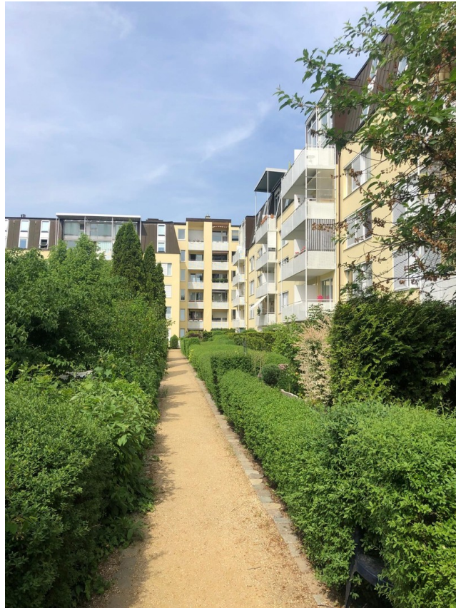
Innenhof mit Gartenbereichen