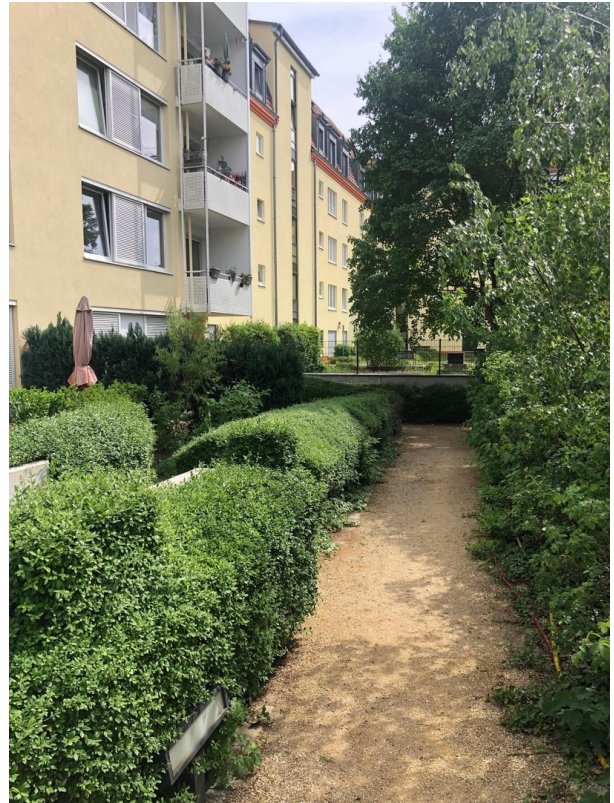
Innenhof mit Gartenbereichen