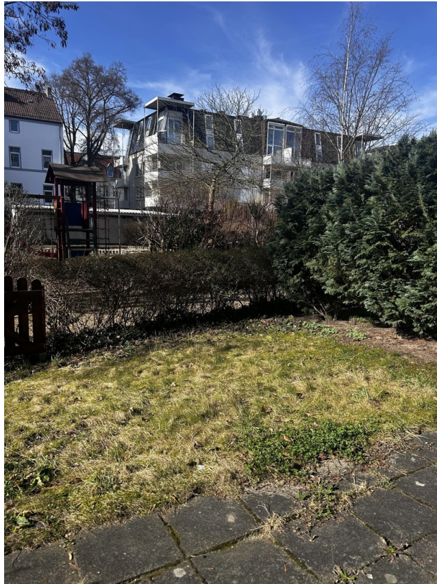
eigener Garten aktuell