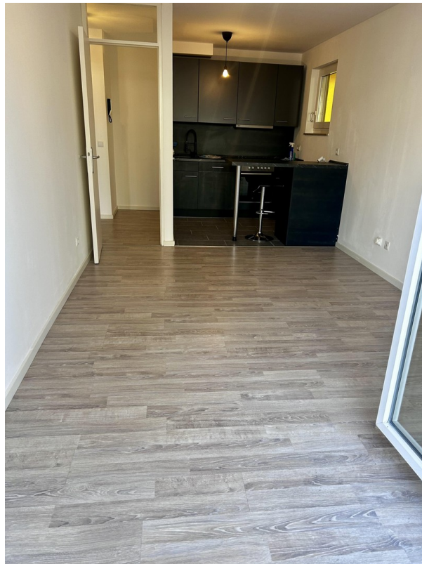
Wohnbereich inkl. Küche