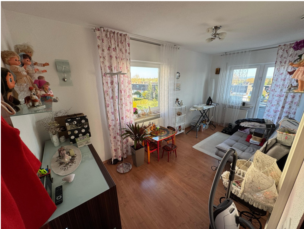
Kinderzimmer 1 OG