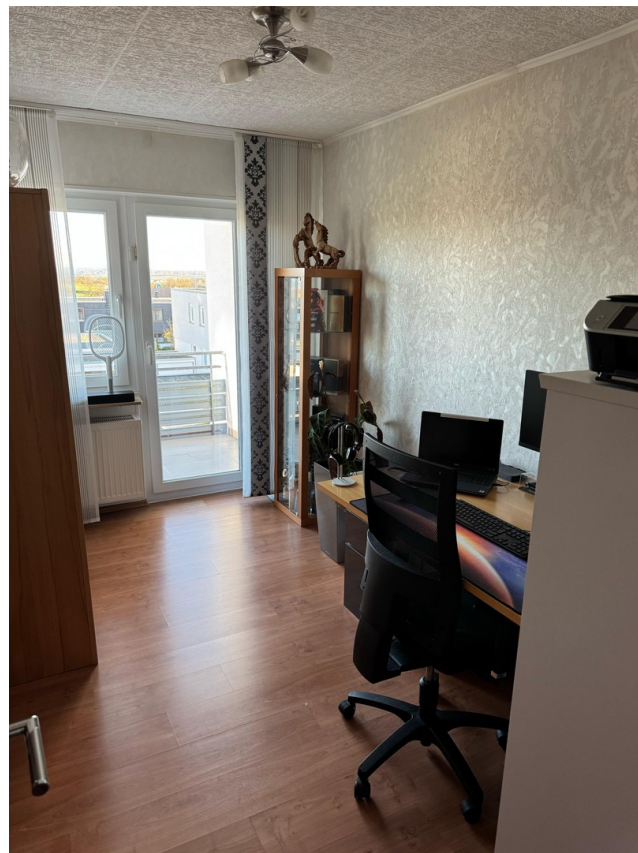
Kinderzimmer 2 OG