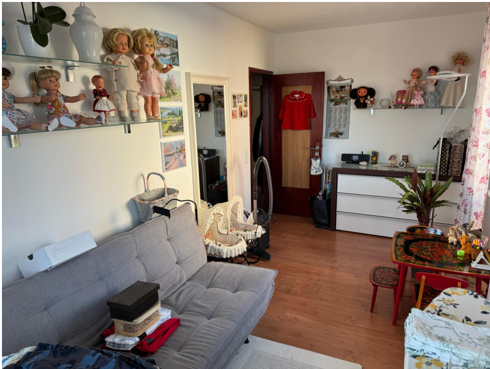
Kinderzimmer 1 OG