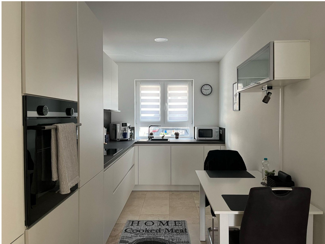
Einbauküche mit Sitzplatz