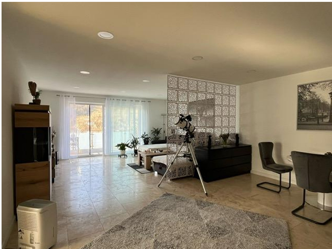
Wohnen - Essen