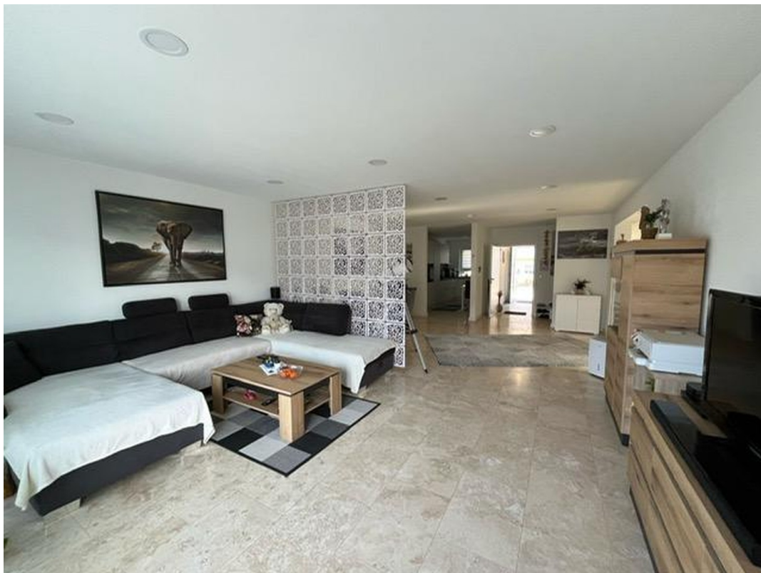
Wohnzimmer, Sicht zum Eingang