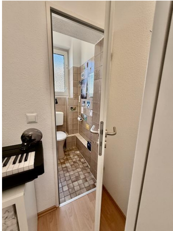
Zimmer 4 mit Bad