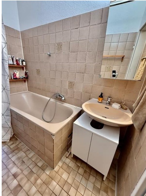
Bad und Spüle