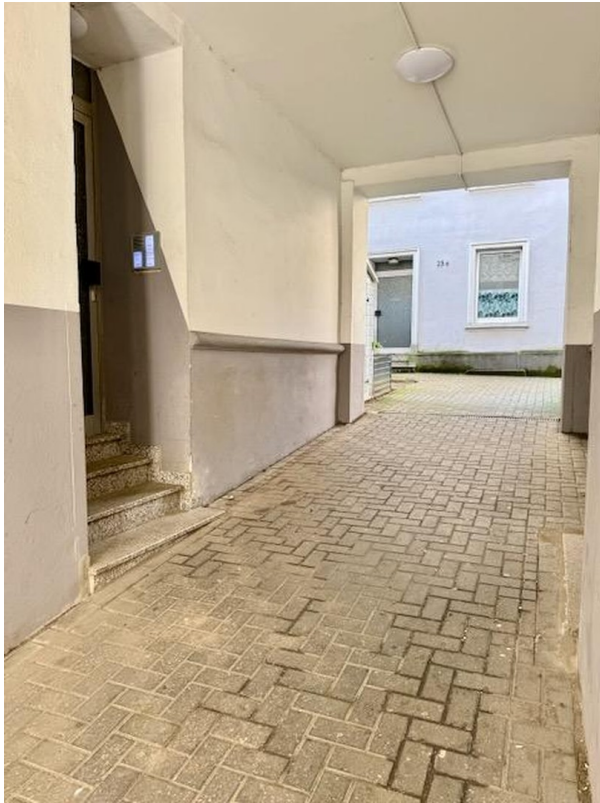
Eingang von außen