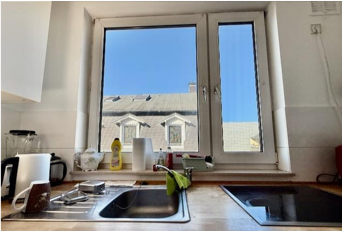
Küche mit Ausblick