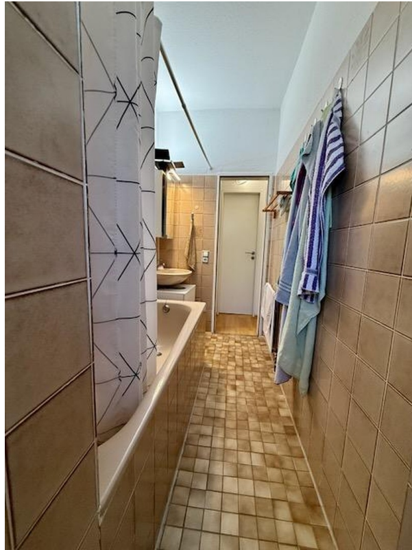
Blick zum Flur