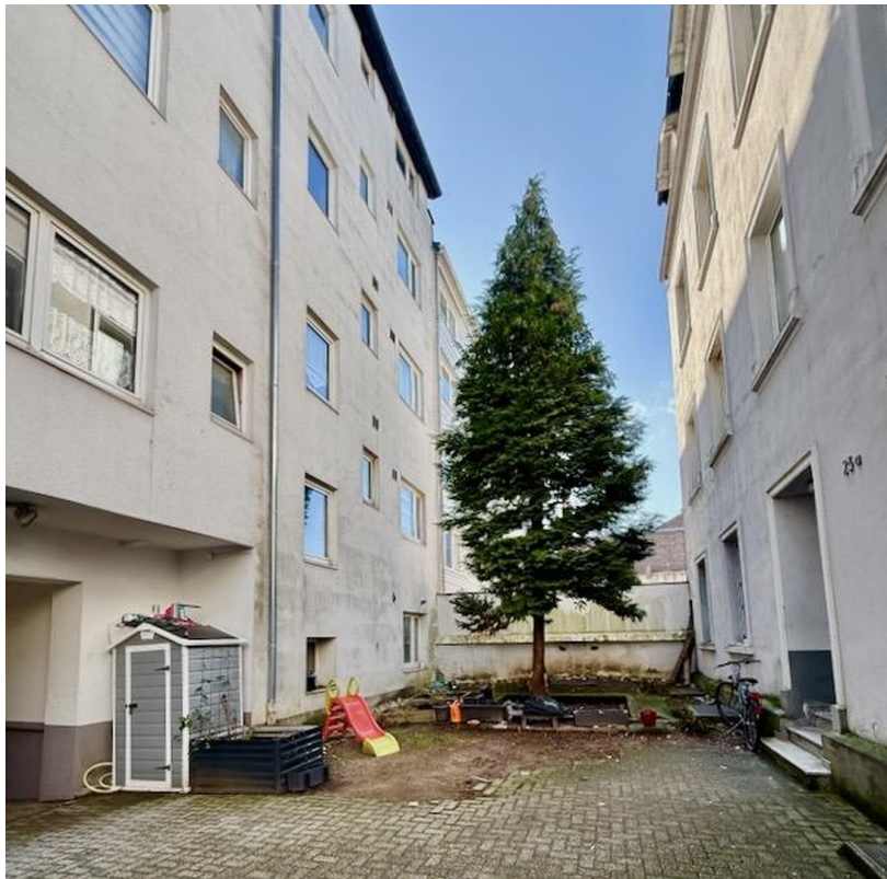
Innenhof mit Baum