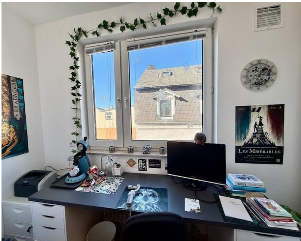
Zimmer 4 mit Bad