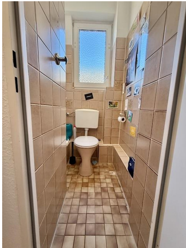
Zimmer 4 mit Bad