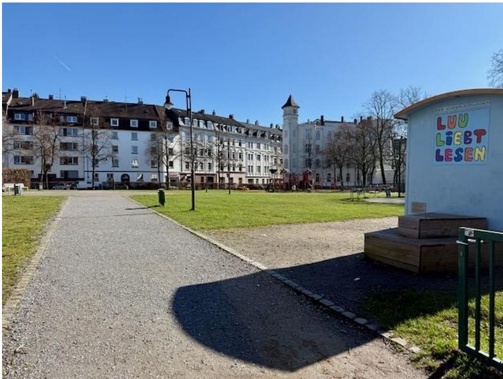
Platz der Republik