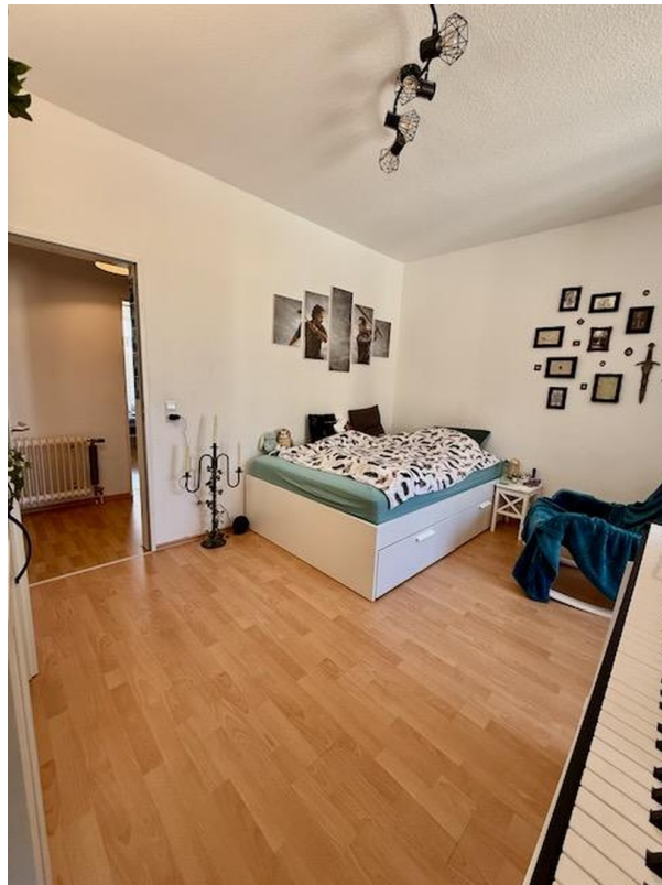
Zimmer 4 mit Bad