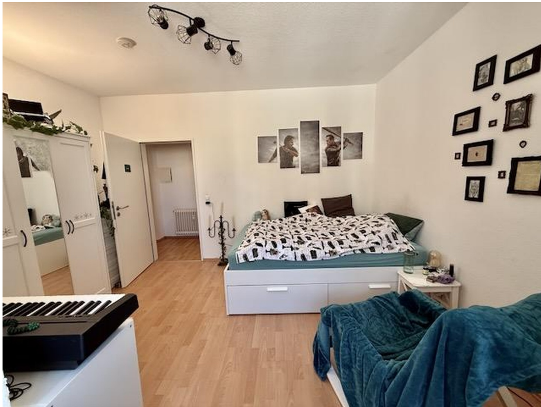
Zimmer 4 mit Bad