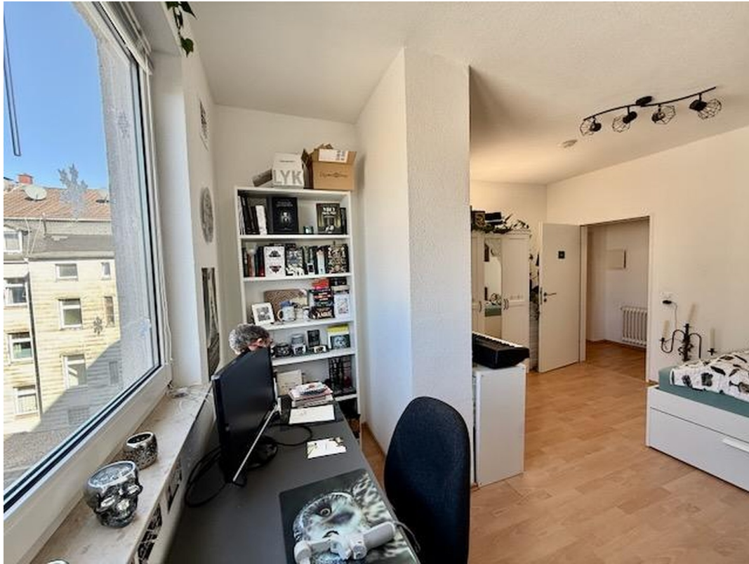
Zimmer 4 mit Bad