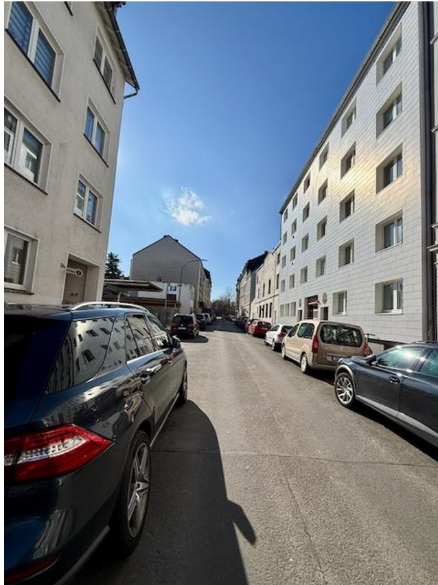
Blick zum Platz der Republik