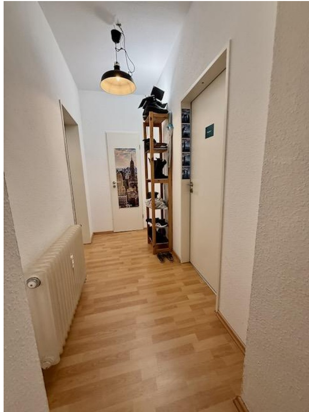
Hinterer Teil Flur