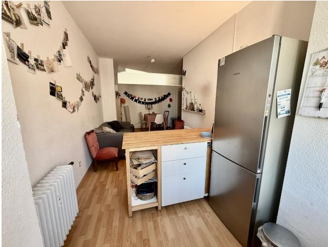
Hinterer Teil der offenen Küche