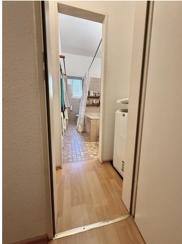
Bad & WC