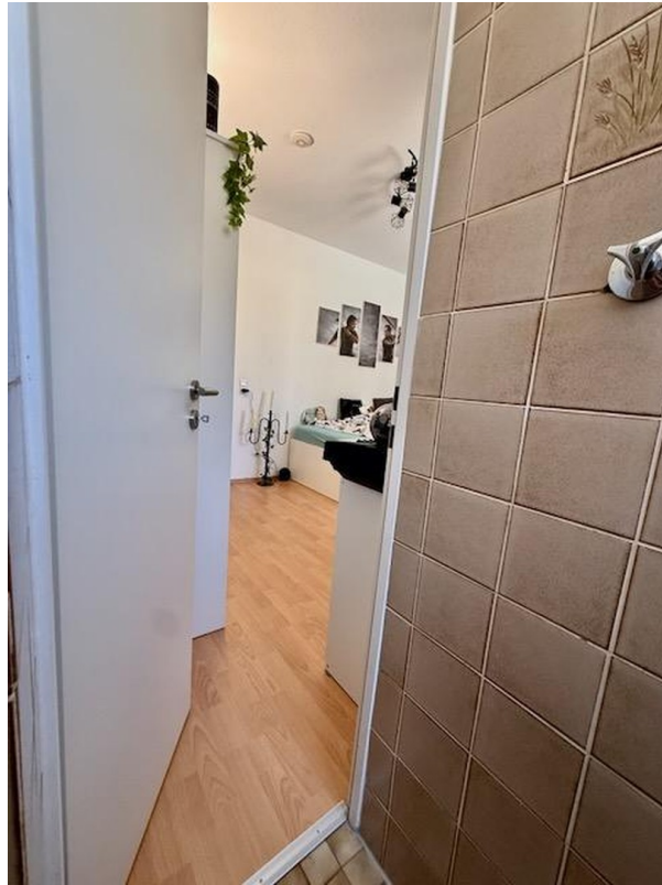
Zimmer 4 mit Bad