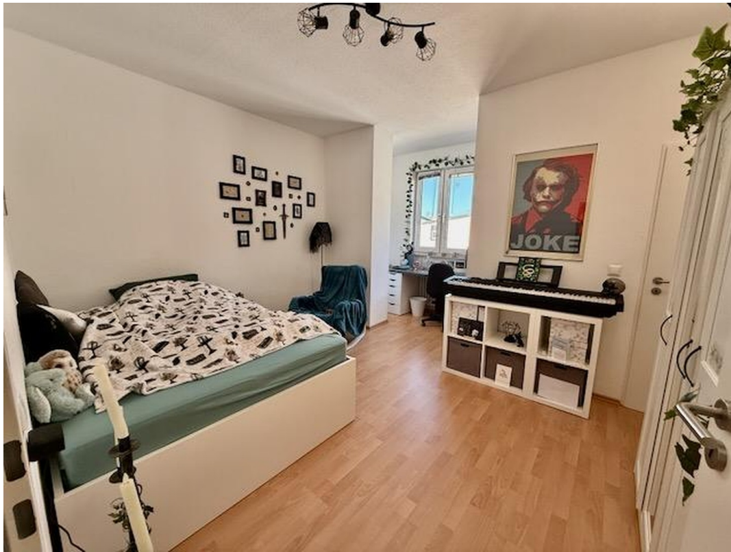
Zimmer 4 mit Bad