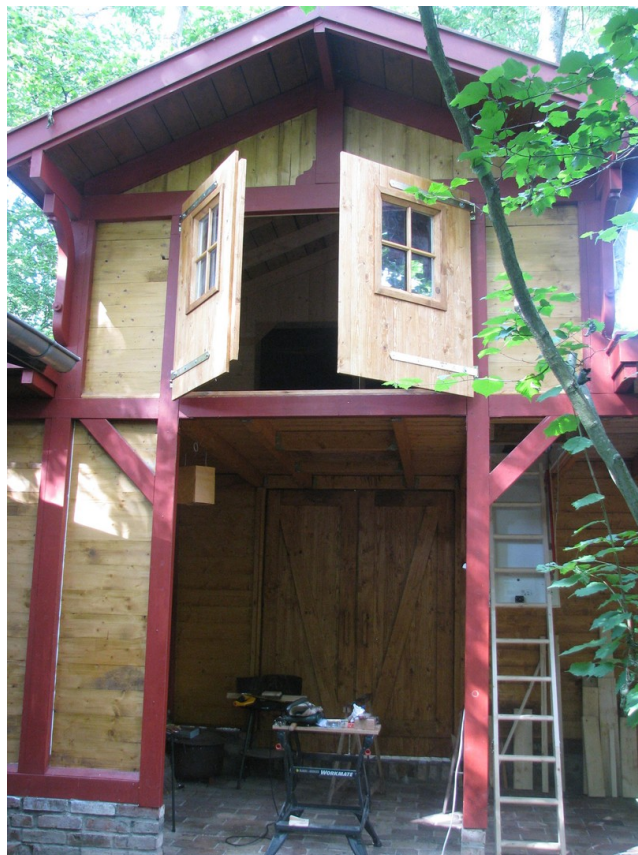
Werkstatt mit Schlafboden