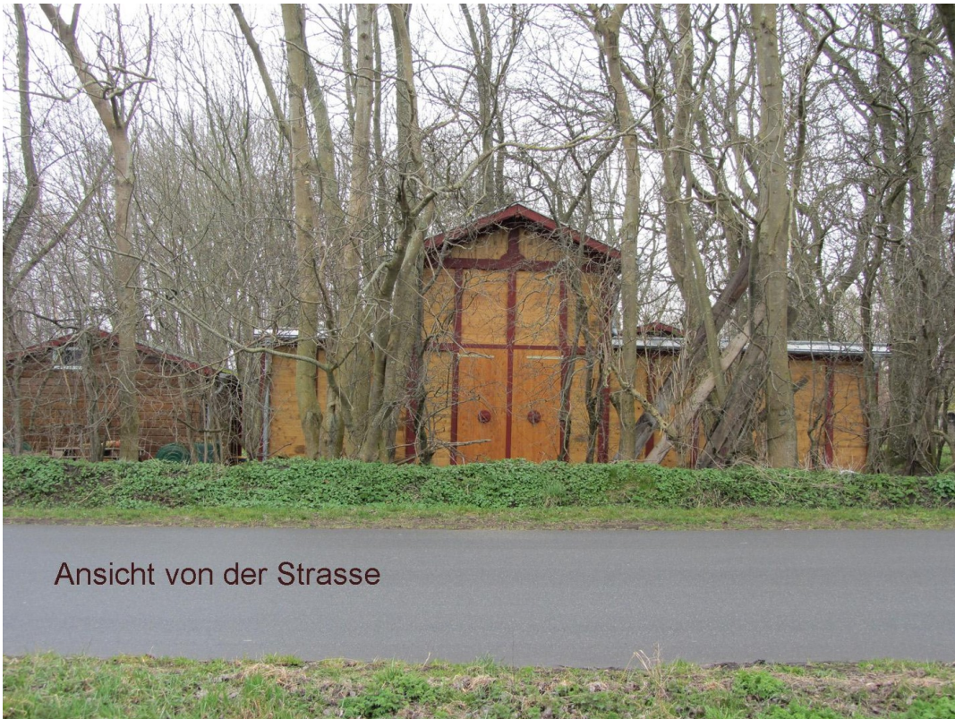
Ansicht von der Strasse