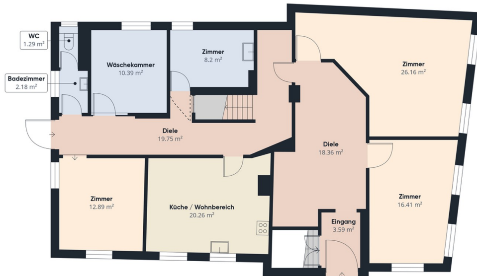
Etage 0 Gebäude 1