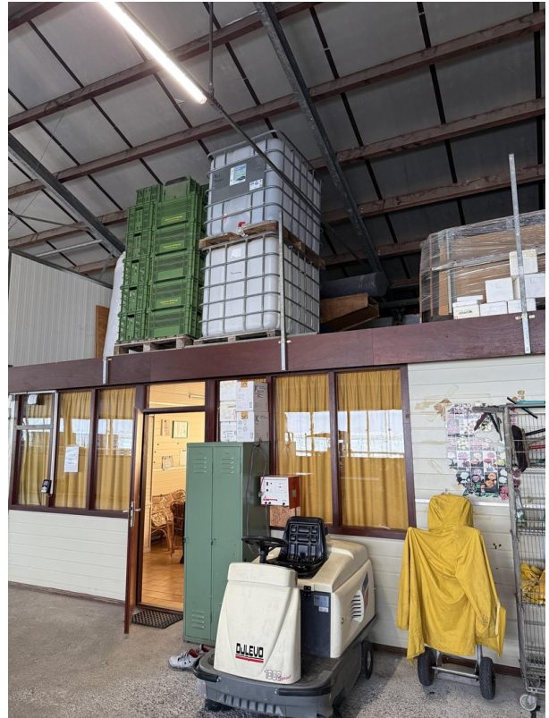
Ansicht in der Betriebshalle