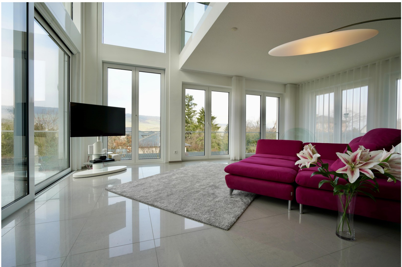
Wahnzimmer mit Germania-Blick