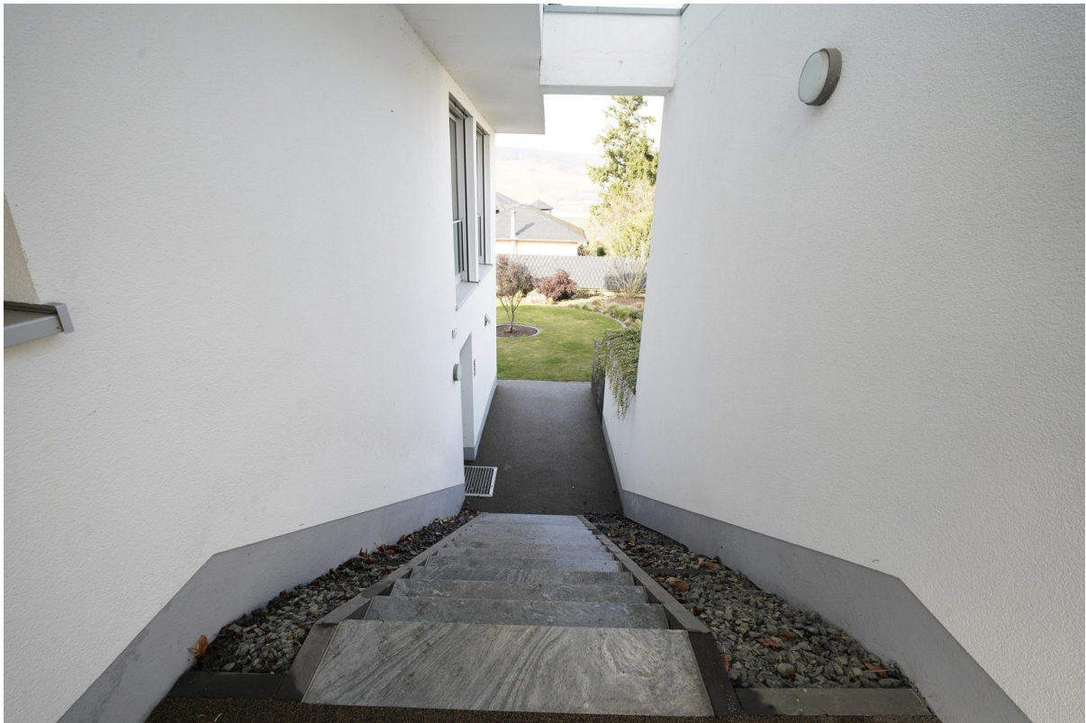
Zugang zur Einliegerwohnung