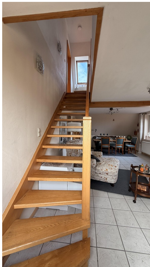
Treppe zum Dachgeschoss