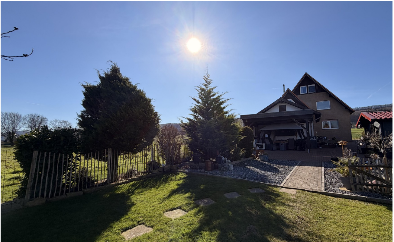
Blick aus dem Garten