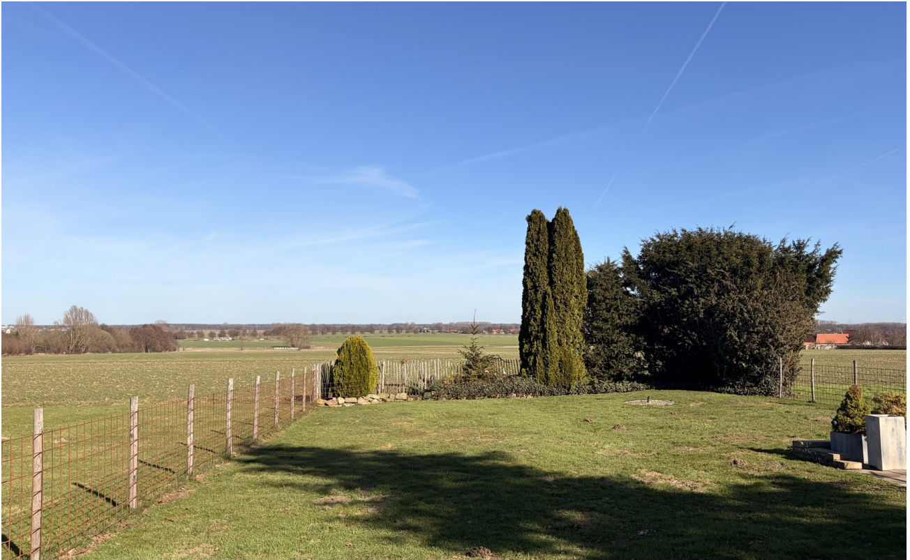
Blick auf freie Felder