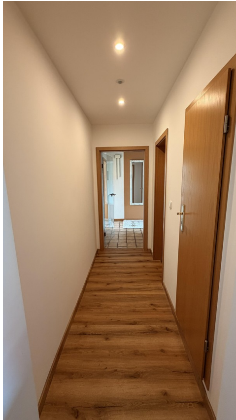
Erdgeschoss: Flur 2