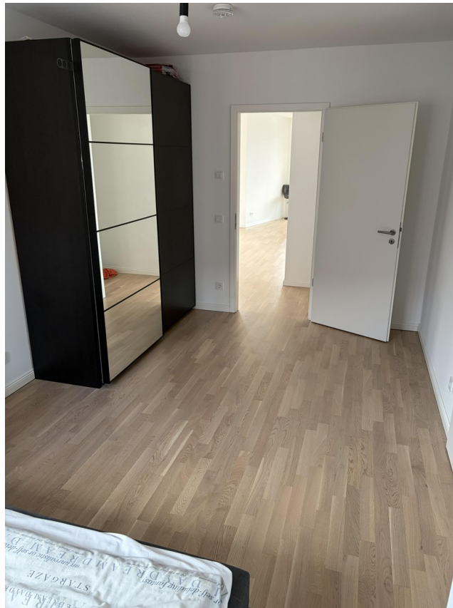
Zimmer 1 mit Bad-en-Suite