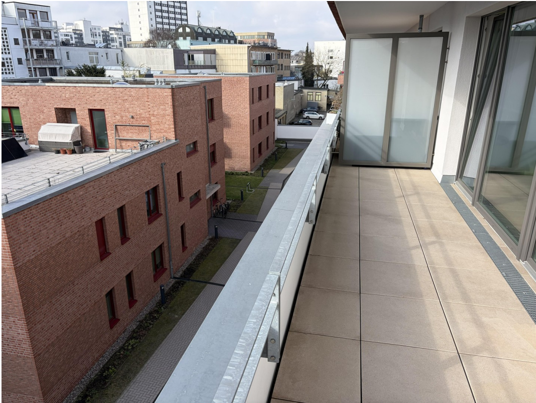
Teil vom Balkon