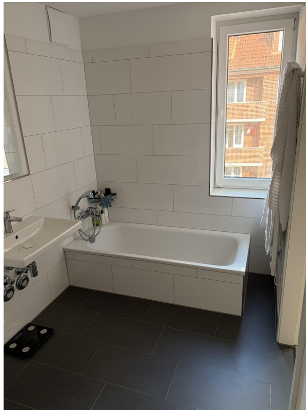
Bad-en-Suite zu Zimmer 1