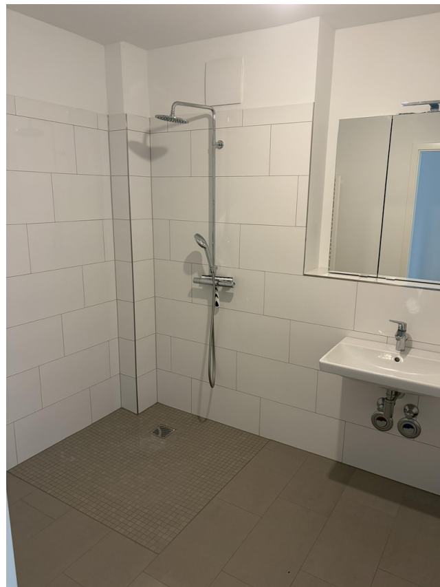
Bad mit grosser Dusche