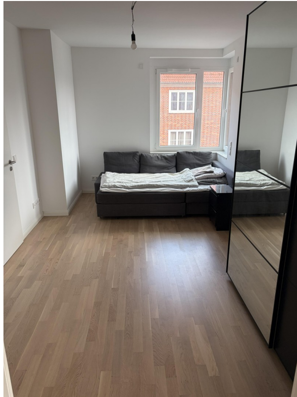
Zimmer 1 mit Bad-en-Suite