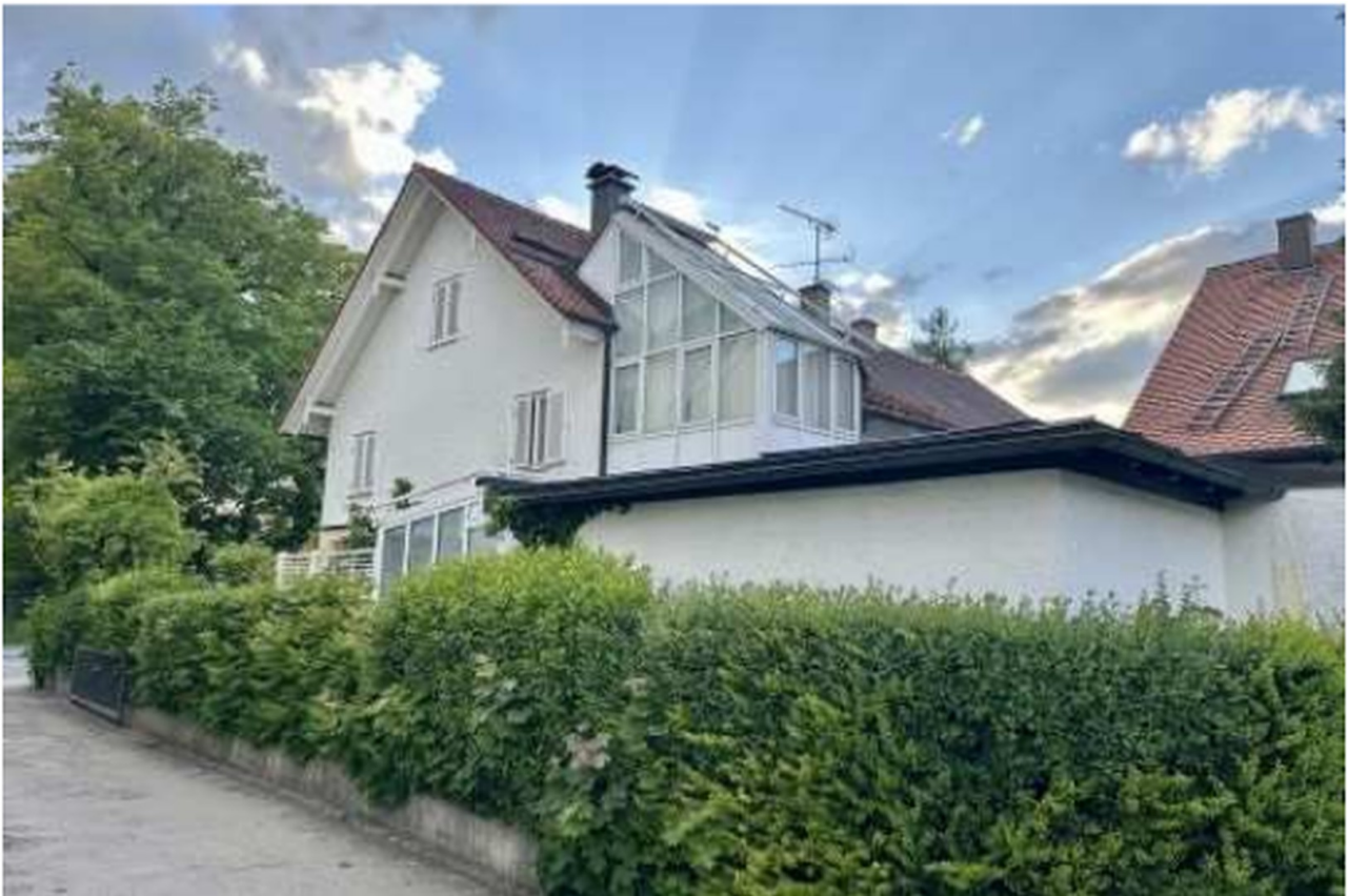
Ansicht Wintergarten Garage