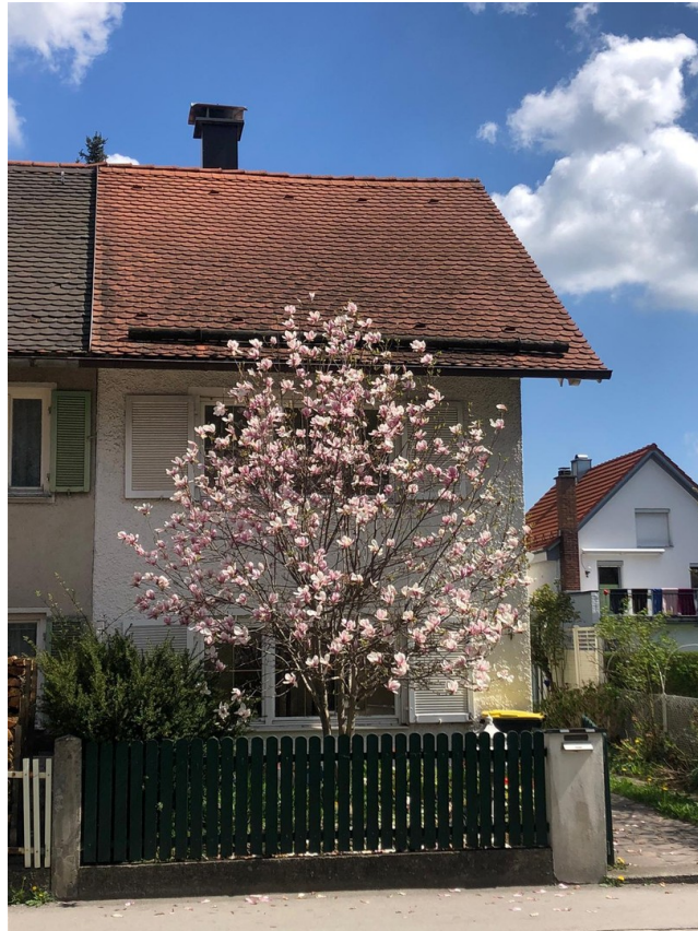
Schöne Magnolie vor dem Haus