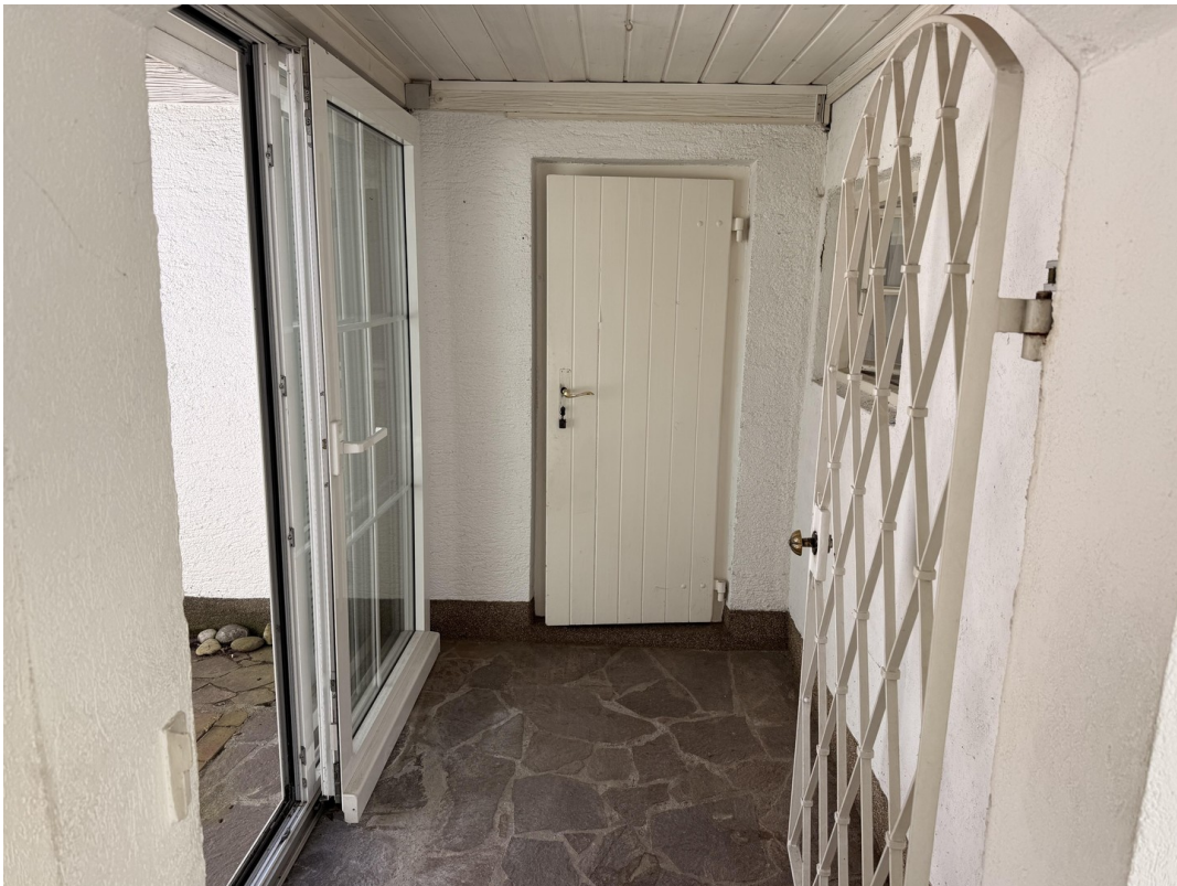
Gang zum Innenhof/Gartenraum