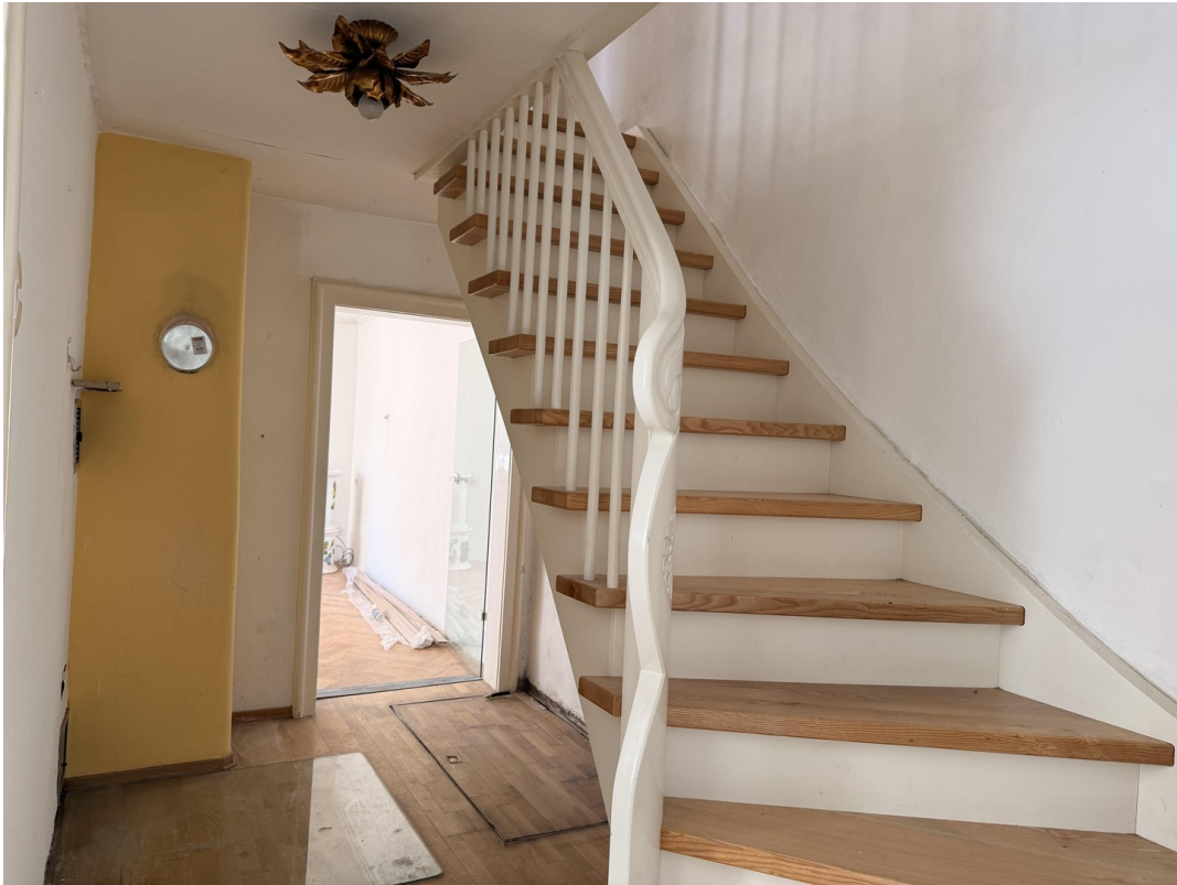
Gang / Treppe zum OG