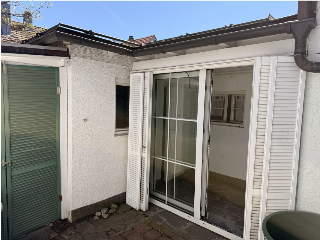
Innenhof mit Gerätehütte