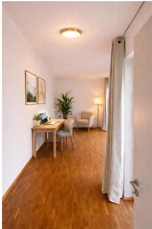
Raum im Anbau