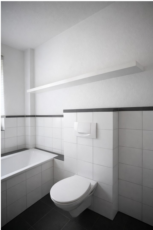
Großes Wannen/ Duschbad