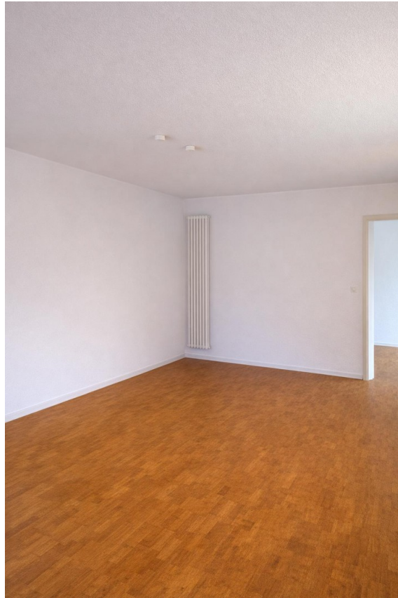
Wohnraum mittels Ki ohne Möbel