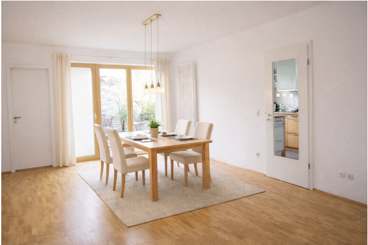
Essbereich mögl. Möblierung