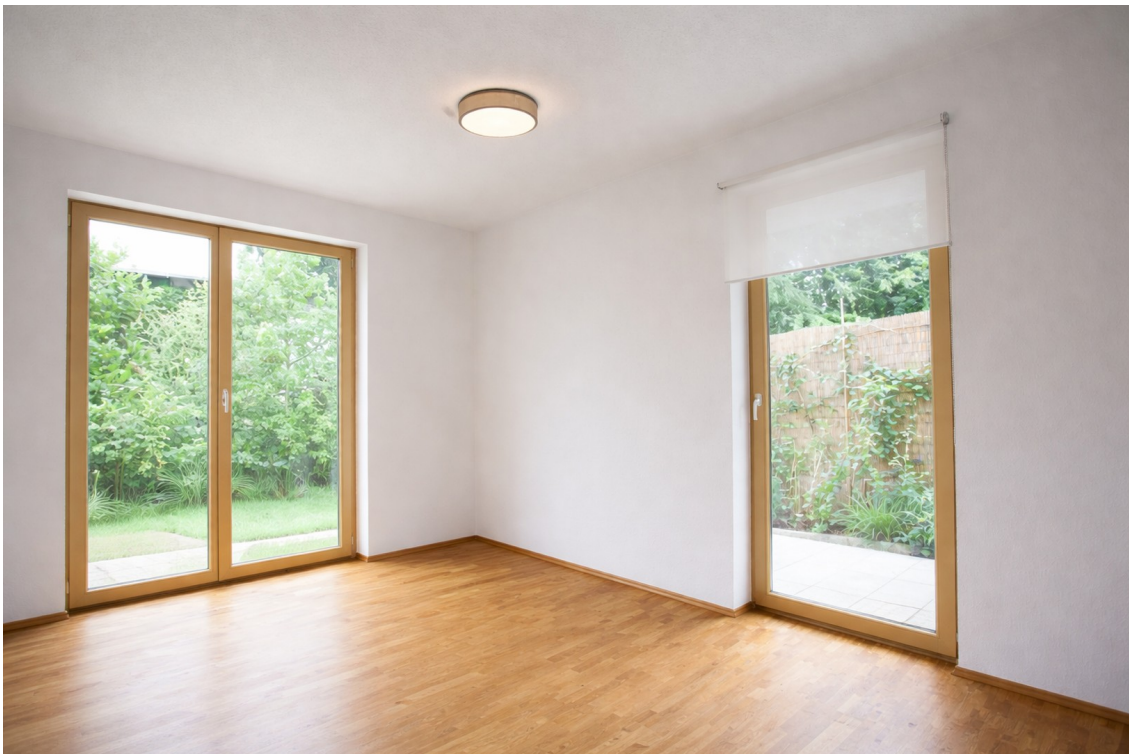
Gästezimmer ohne Möbel