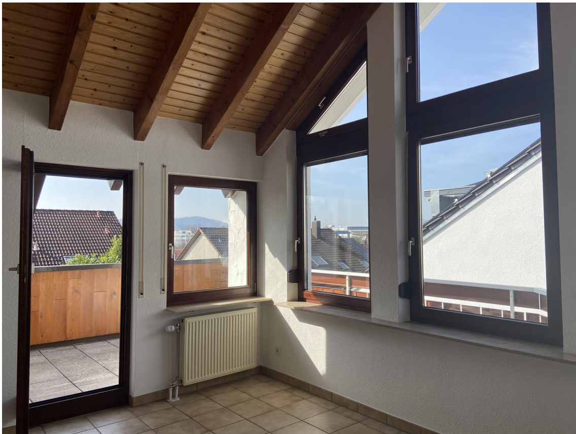
Esszimmer & großer Balkon