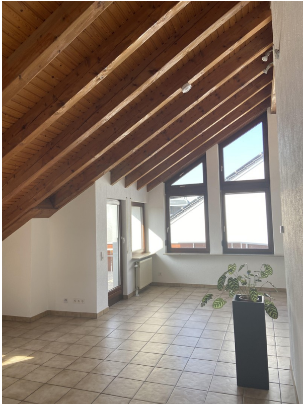
Esszimmer - Blick v. Wohnzimmer