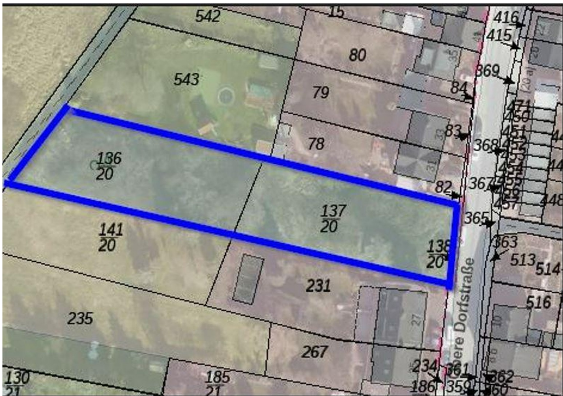
Lufbild Obere Dorfstr