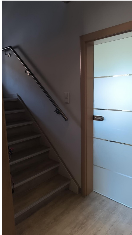
Treppe OG DG