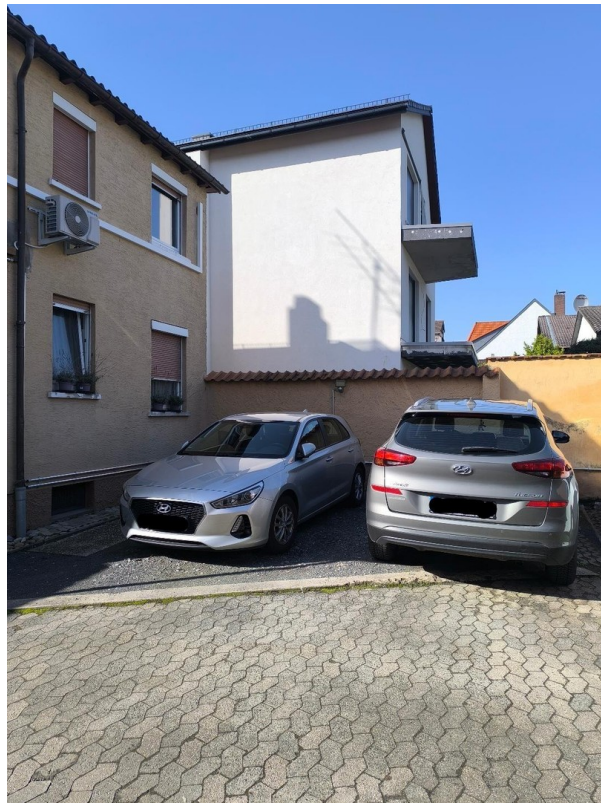
2 Stellplätze im Hof