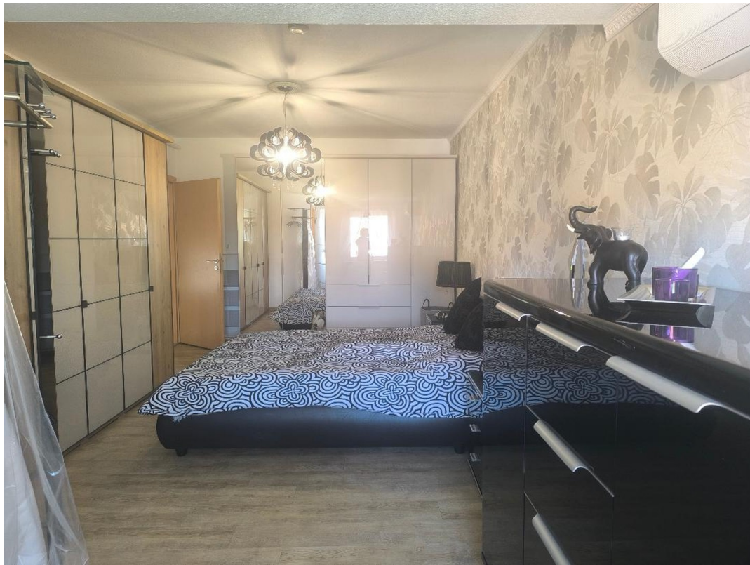
Schlafzimmer OG mit Klima