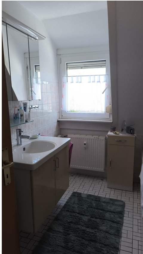
Bad im DG