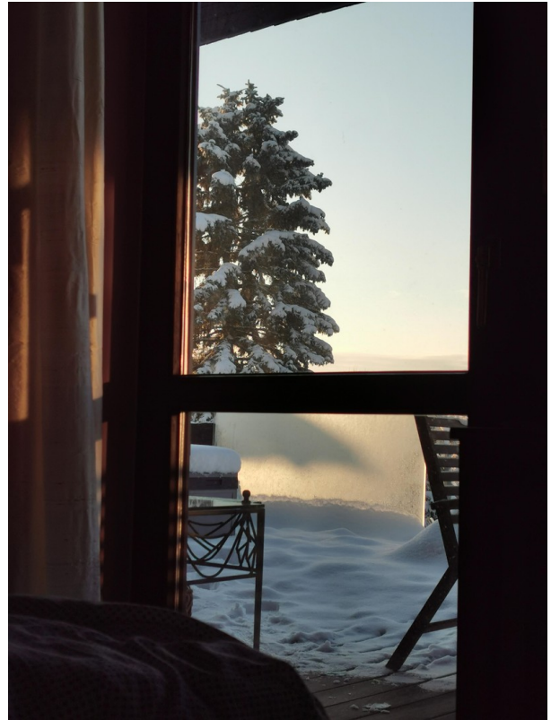
Direktzugang zur Terrasse