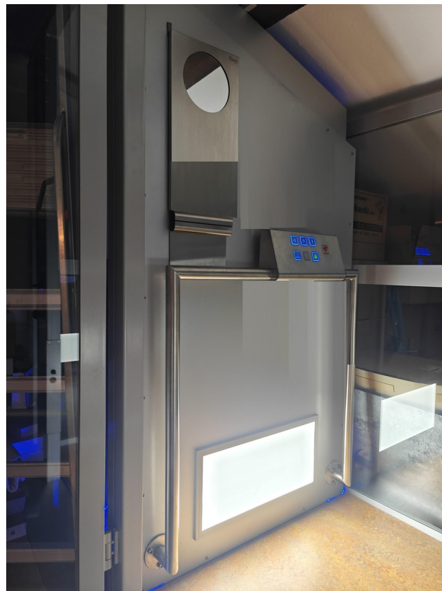
Barrierefrei dank Lift