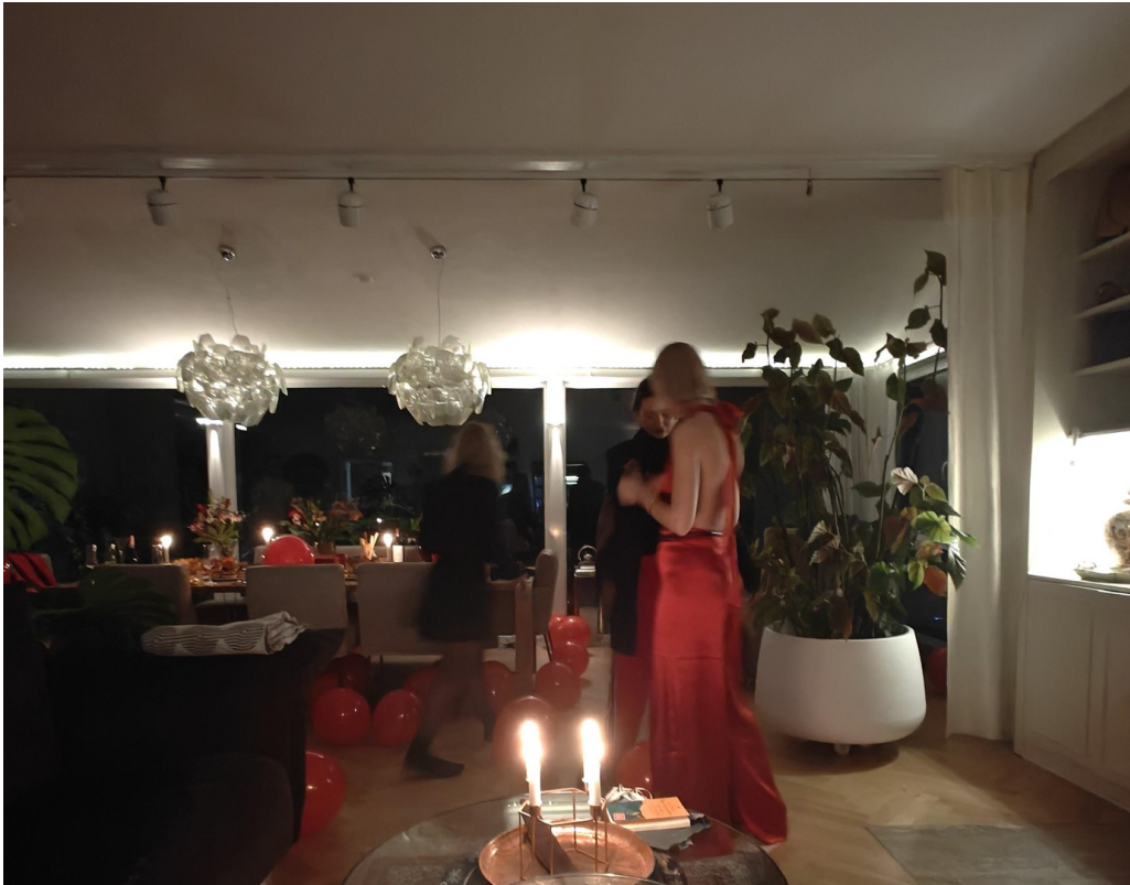
Raum für unvergessliche Feste