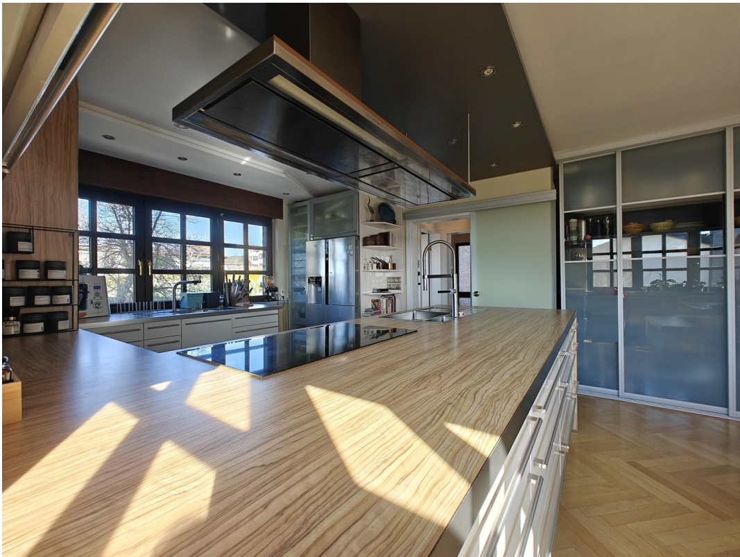
Zwei Spülen, viel Komfort