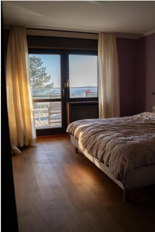
SZ mit Terrassenzugang