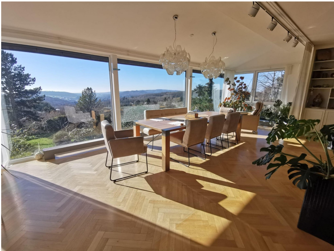
Panoramablick bis Wiesbaden