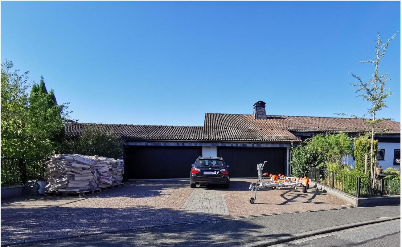
Nordansicht: 2 Doppelgaragen