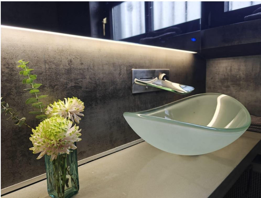
Gäste WC Erdgeschoss