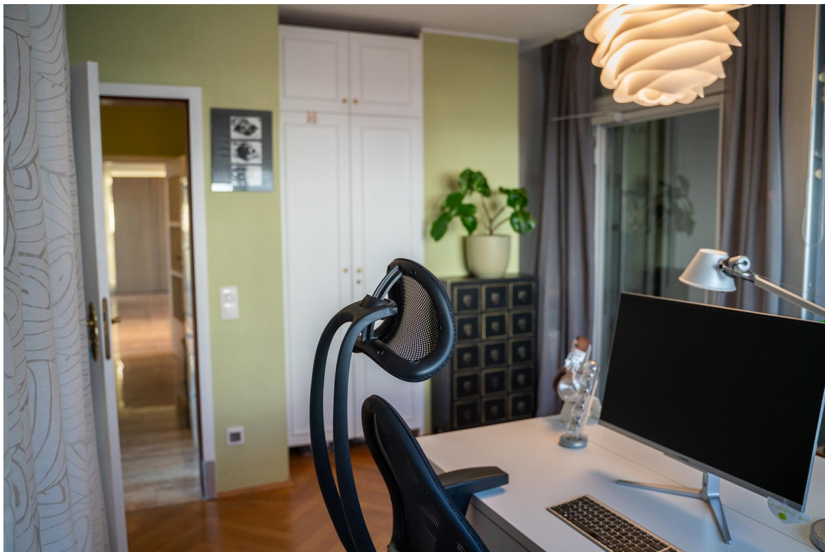
Flexibles Zimmer mit Lift