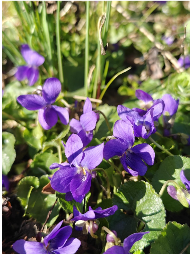
Frühling im Garten