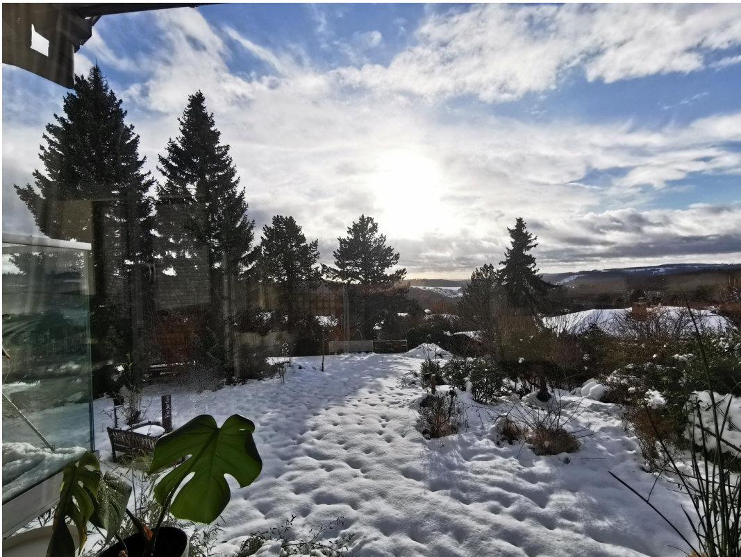
Wohnen mit Winterblick