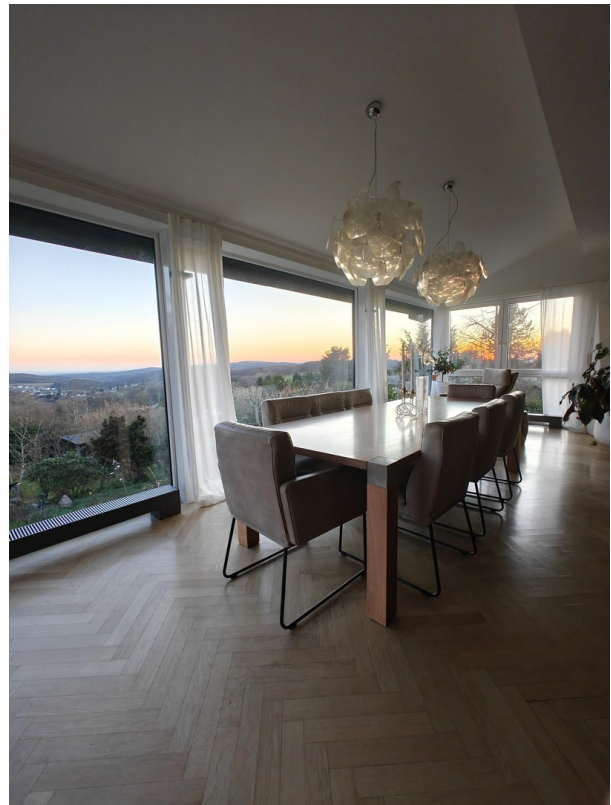
Essen mit Panorama