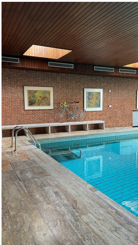
4 - Jahreszeiten Schwimmbad