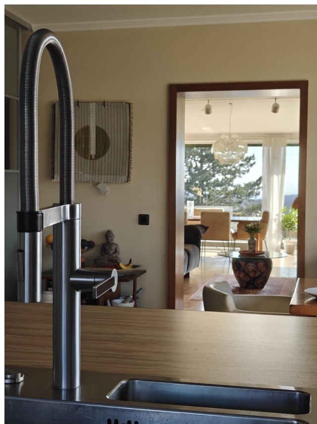
Kochinsel mit Weitblick