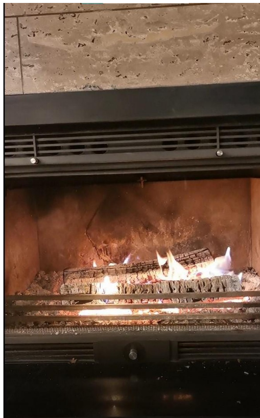
9kW Kamin für Hygge