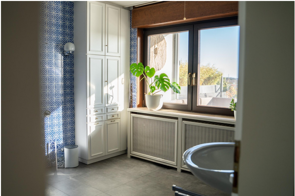
En Suite Masterbad