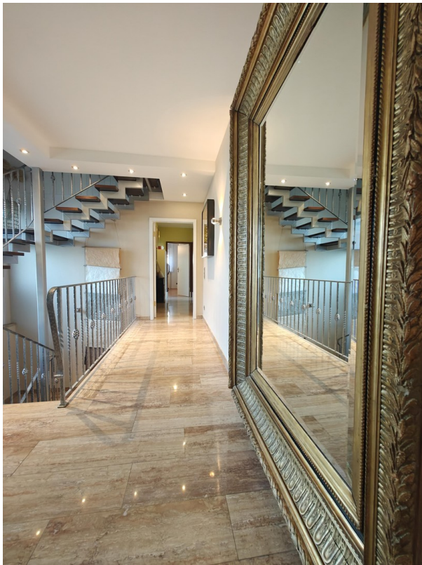
Flur mit Travertin Boden