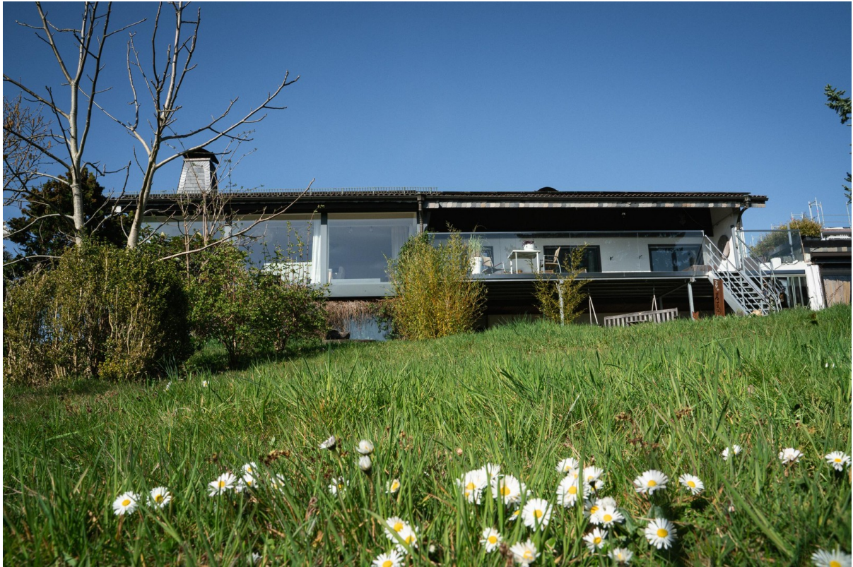
Südansicht im Frühling