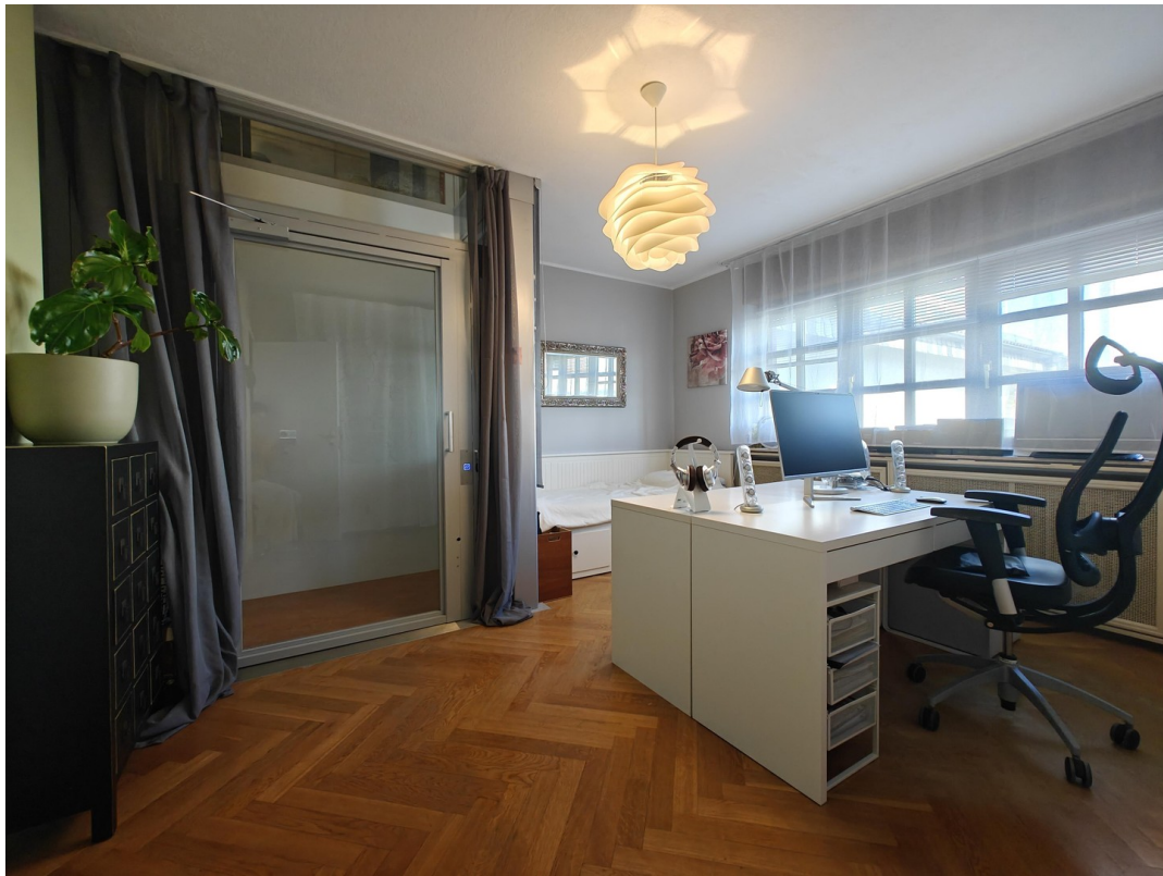
Büro - Gäste oder Kinderzimmer