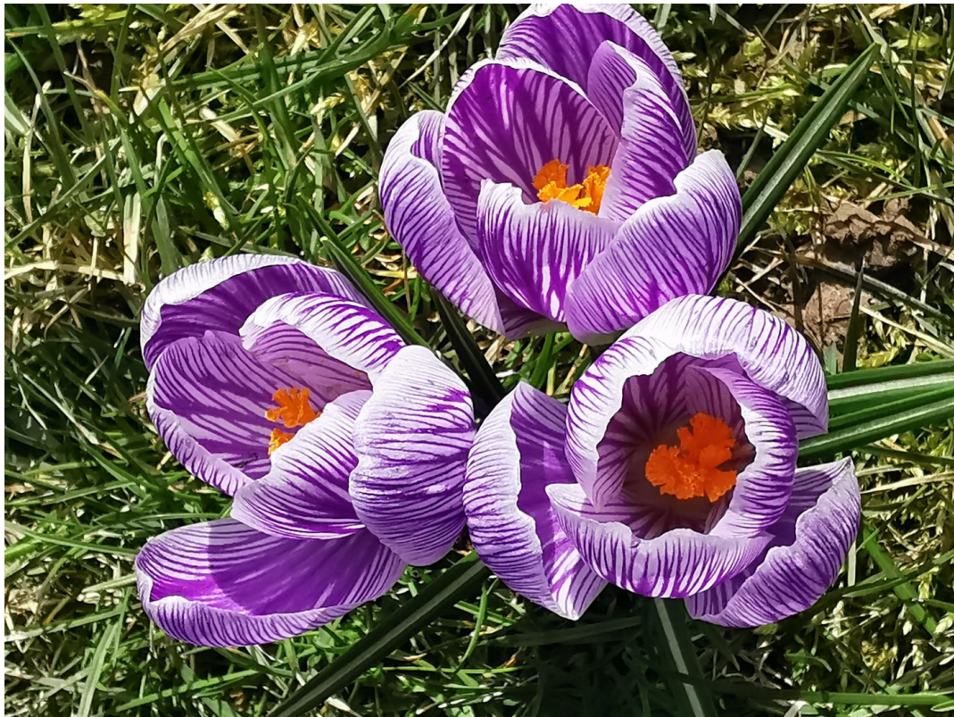
Frühling im Garten