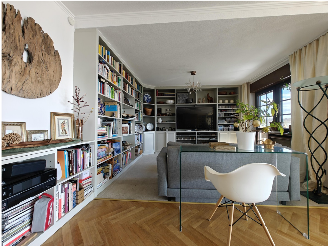
Ruheoase mit Entertainment