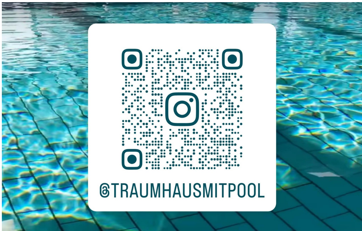
Scannen für mehr Einblicke