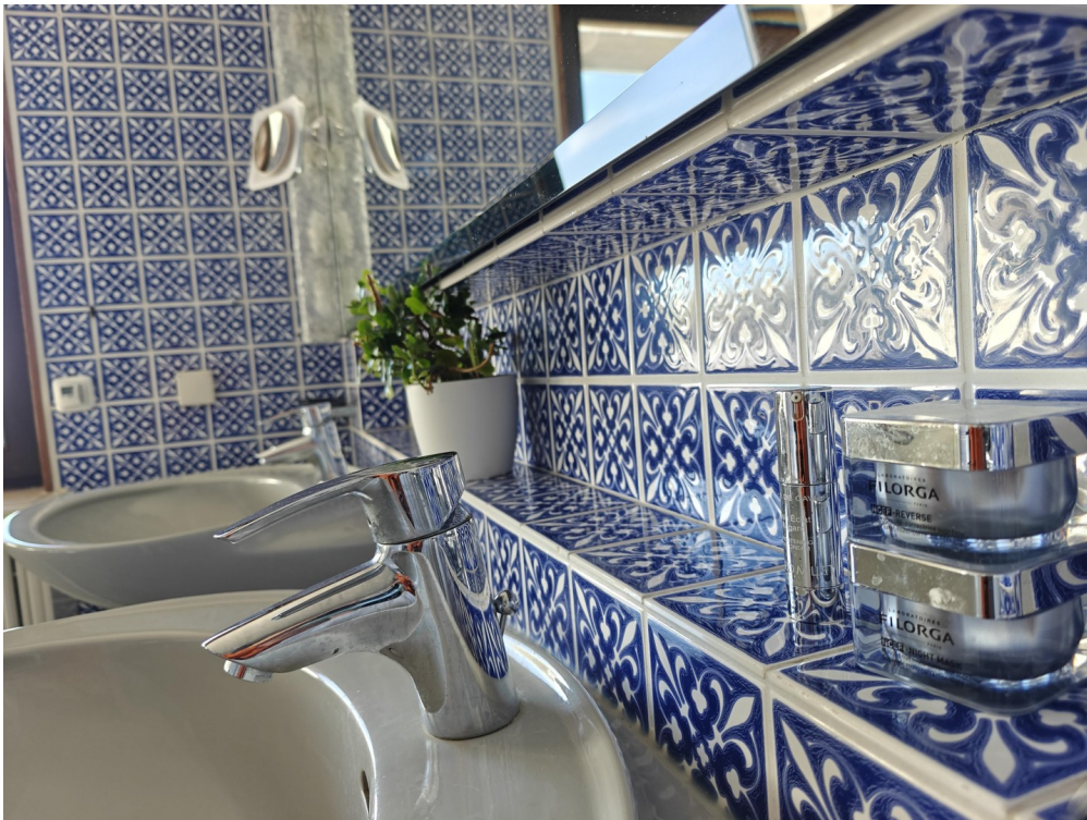
V&B Fliesen Versailles