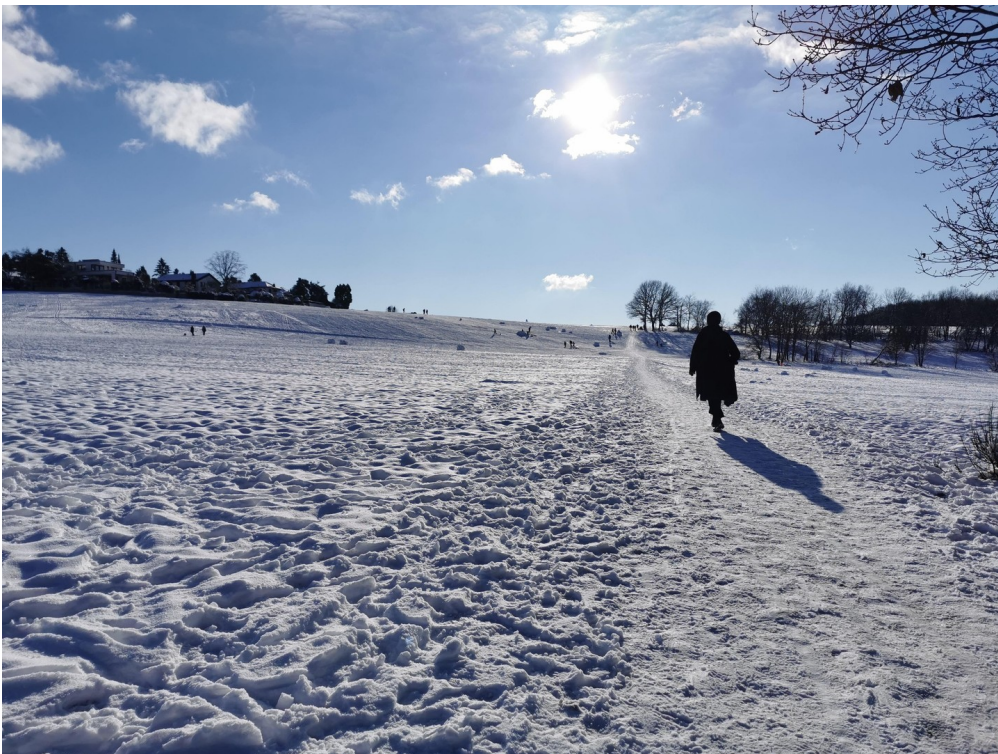
Winteridylle für Spaziergänge