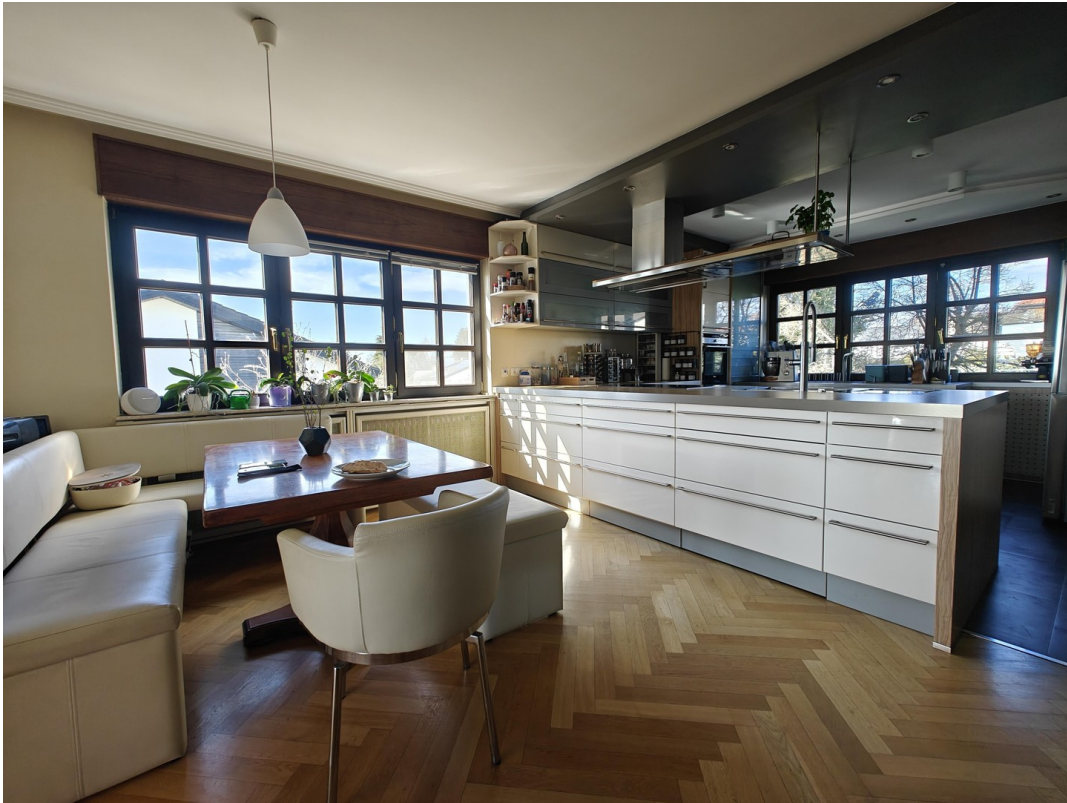
Frühstücksplatz in der Küche