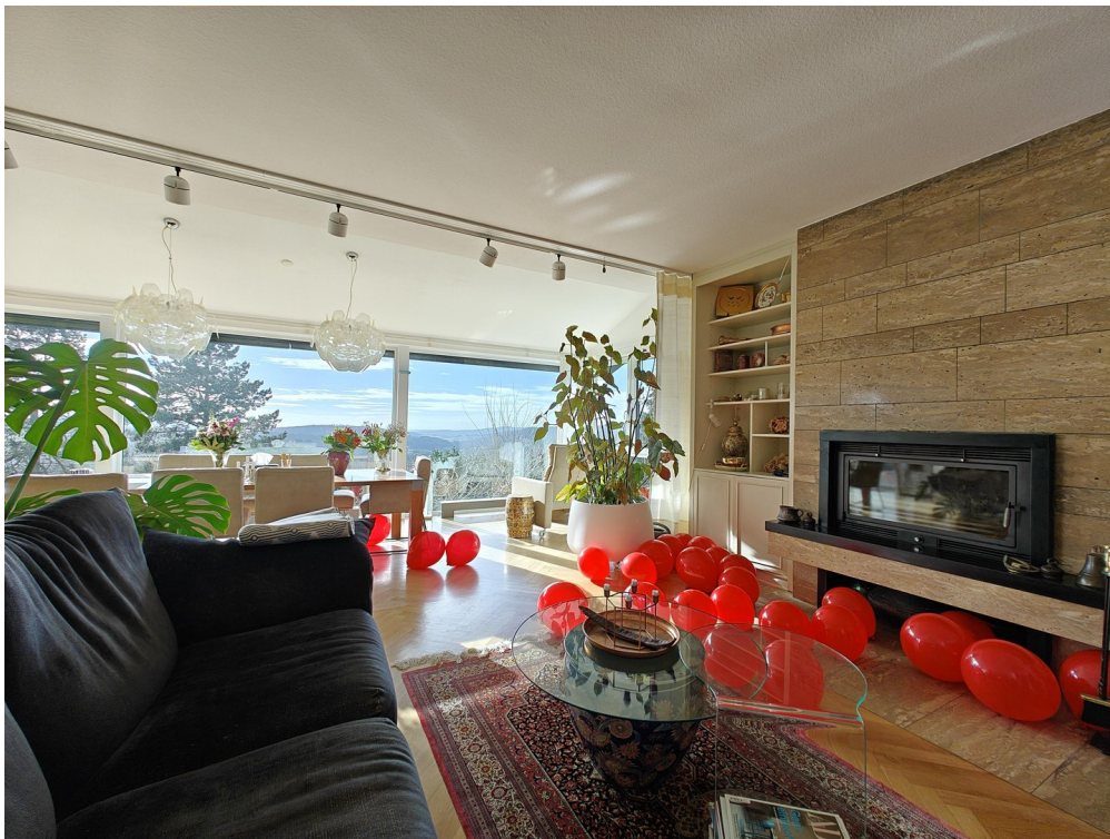
Ihr Zuhause für große Feste