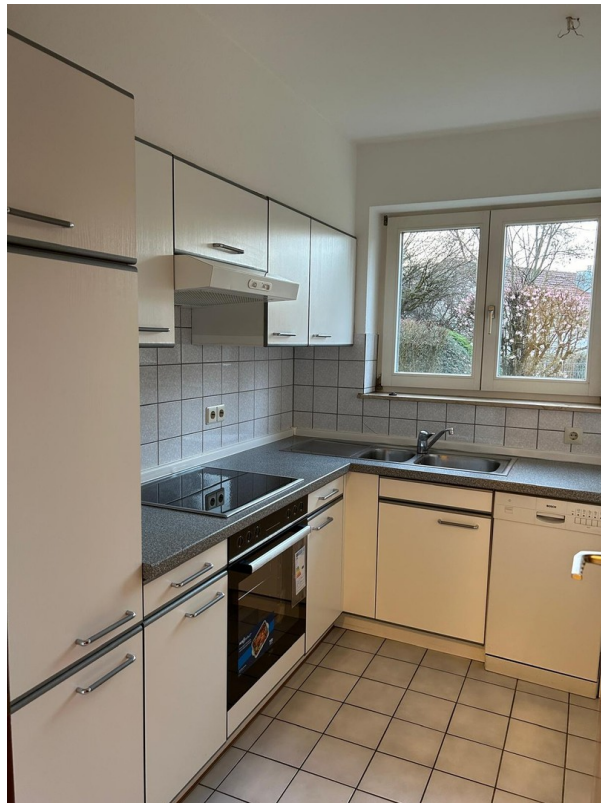
Küche inkl. Einbauküche