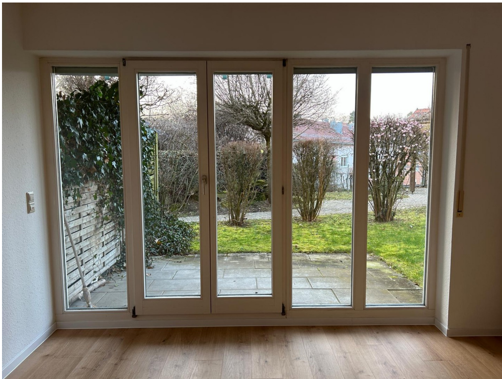
Blick auf die Terrasse