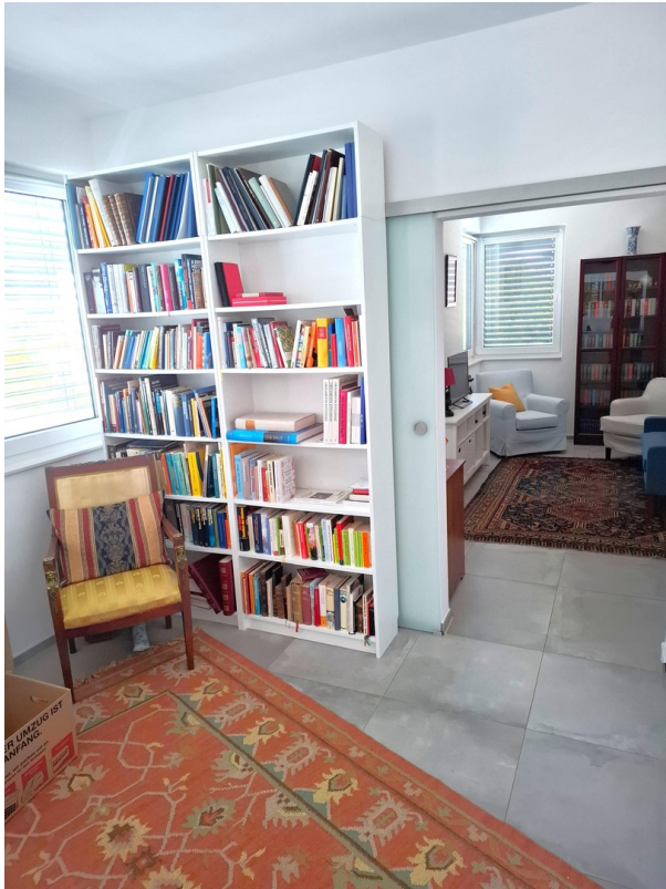
OG - Blick in die Büroräume