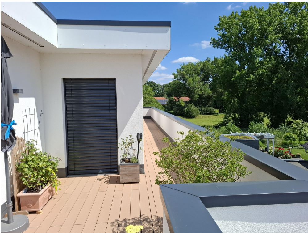
DG - Südfront der Dachterrasse