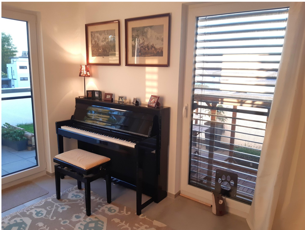
DG - Vorraum