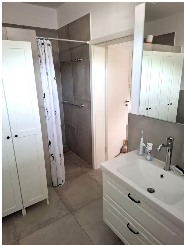
OG - Vollbad en suite