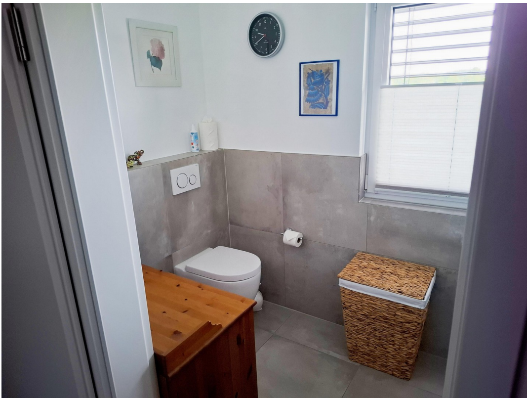
DG - Duschbad