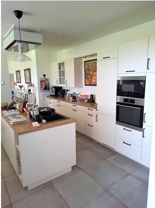
OG - Küche