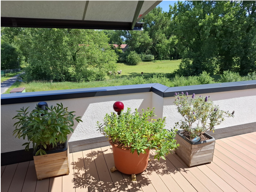
DG - Blick nach Südosten