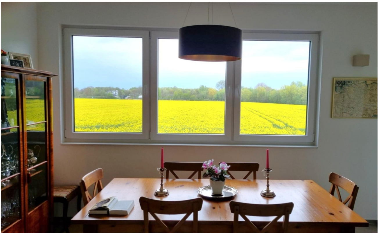
OG - Eßzimmer in der Wohnküche