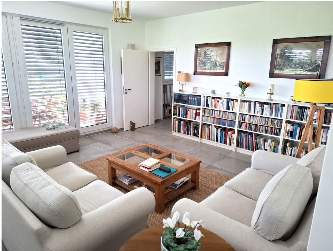
OG - Wohnzi. mit Balkonzugang