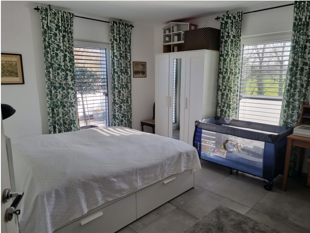
Eines der drei DG-Zimmer