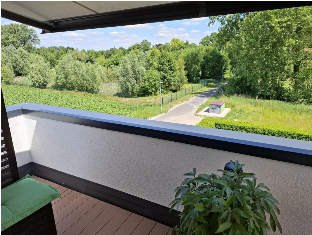
DG - Blick nach Nordosten