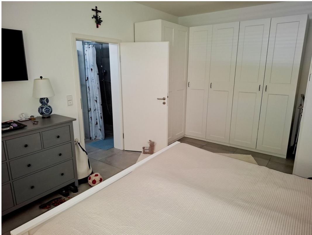
OG -Schlafzi. mit Badzugang