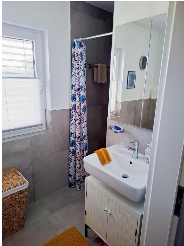
DG - Duschbad