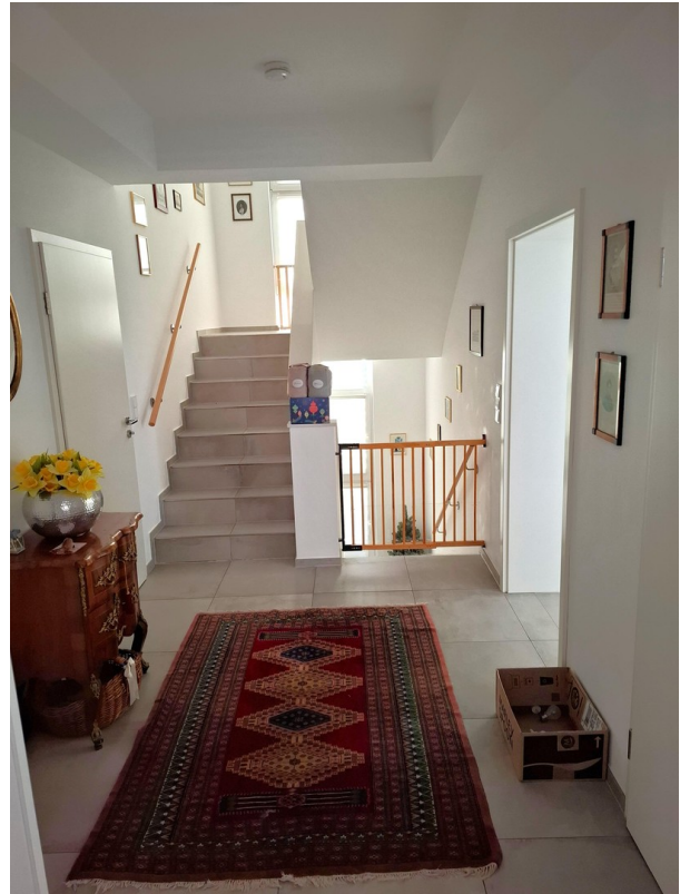
OG - Flur mit Treppenhaus