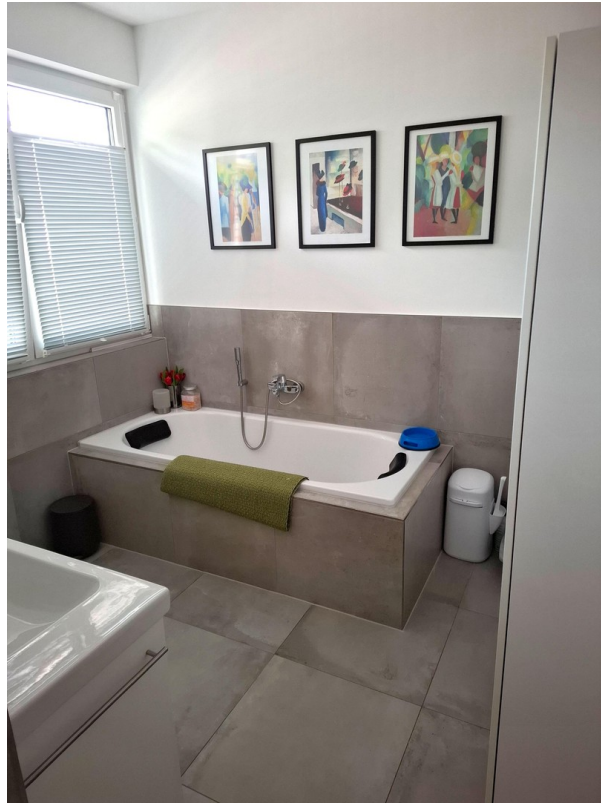
OG - Vollbad en suite