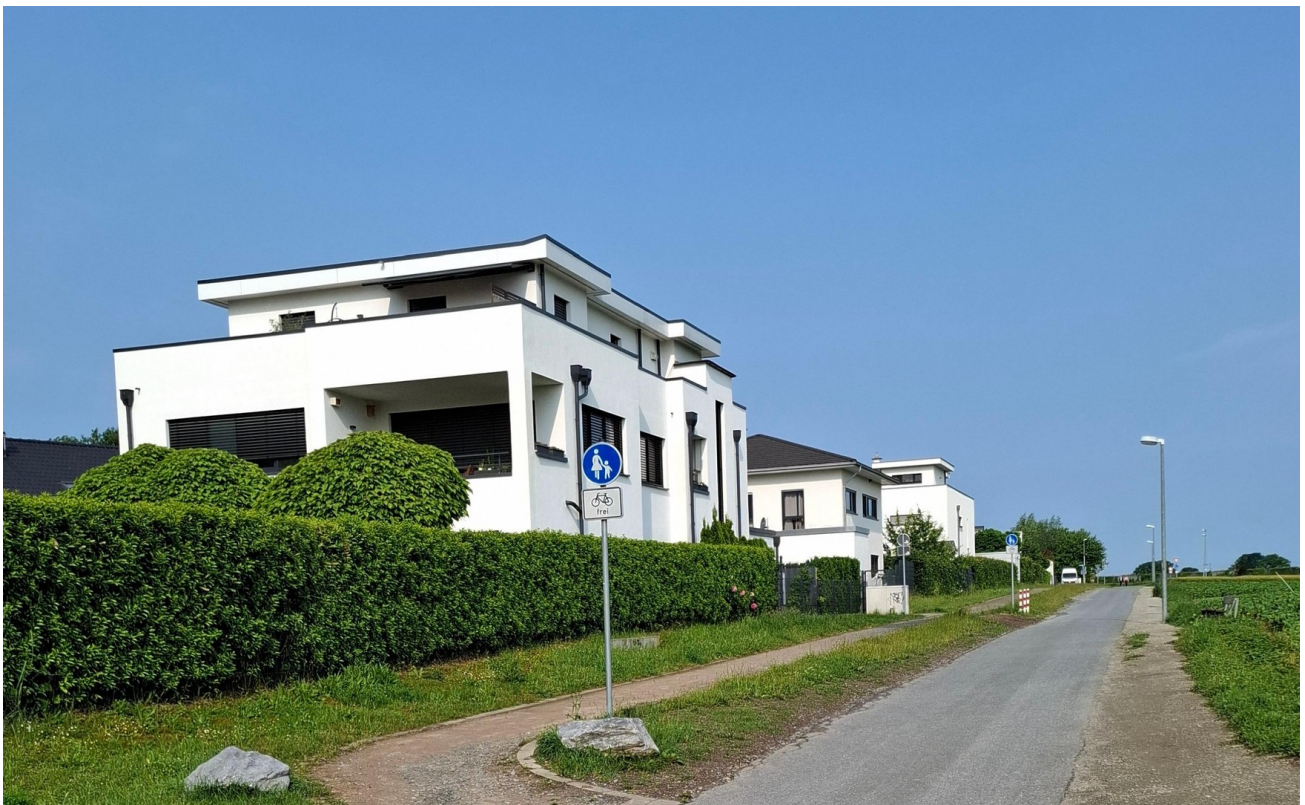
Hausansicht von Osten