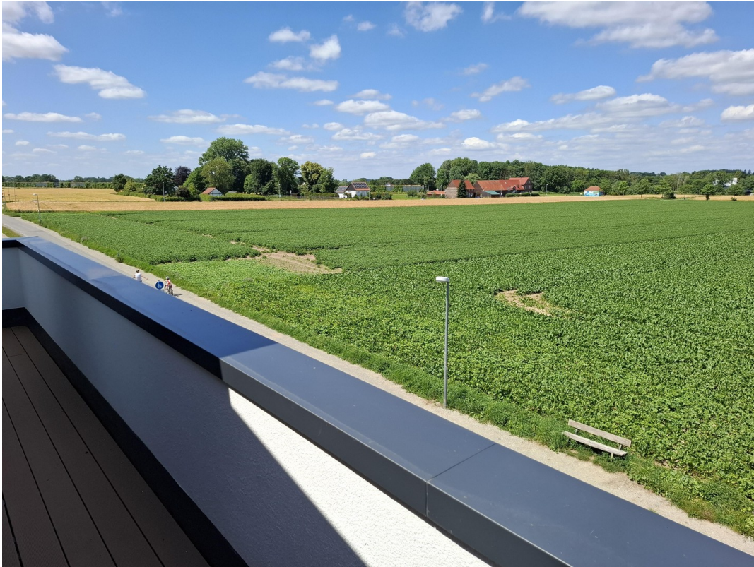
DG - Blick nach Nordwesten