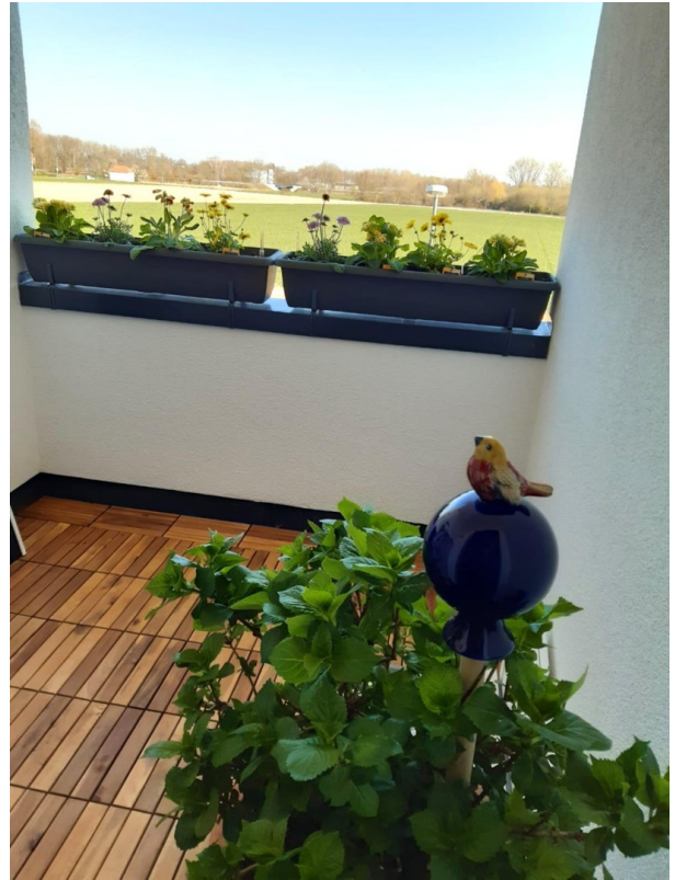
OG - Loggia an der Wohnküche