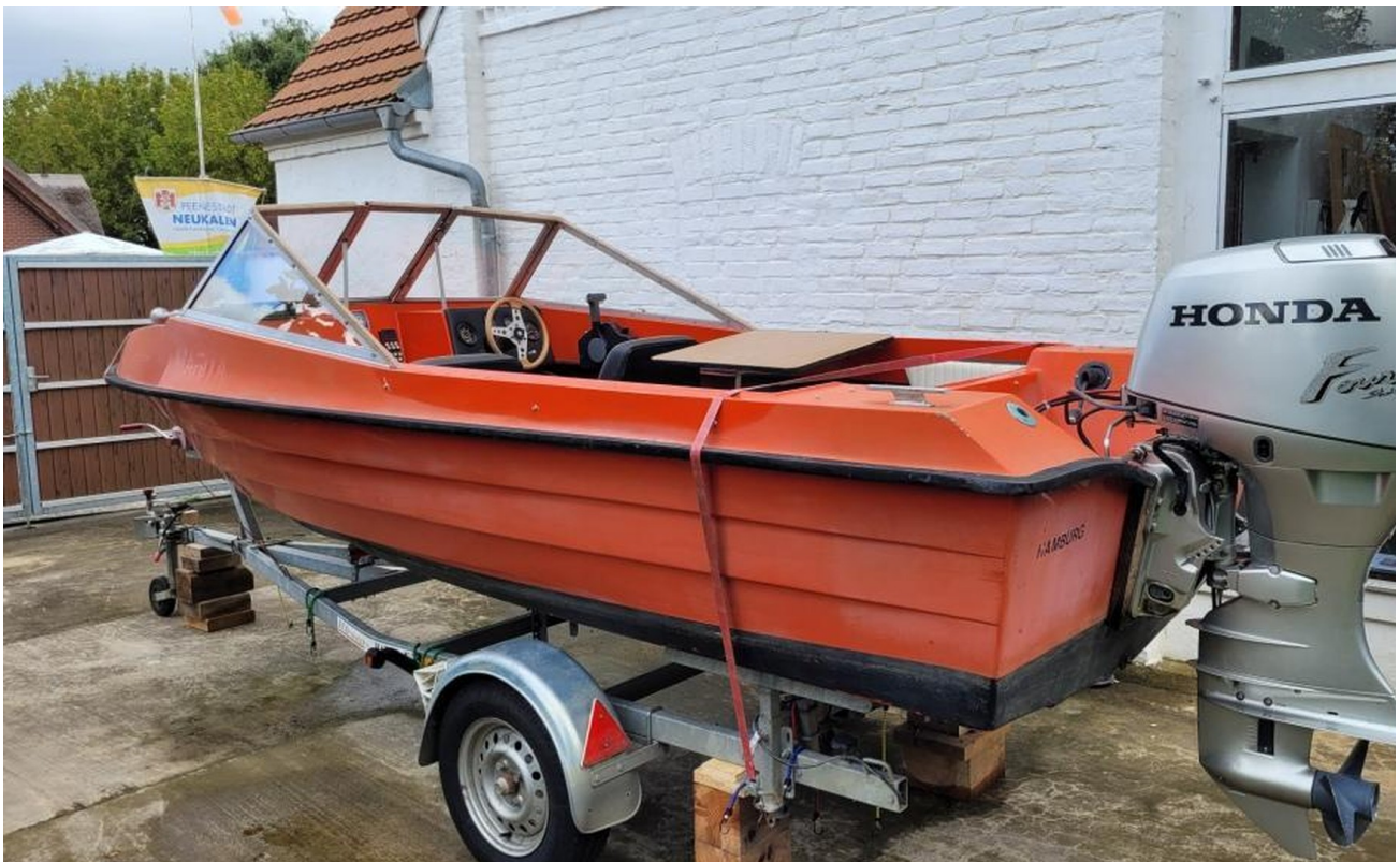
Angelboot mit Honda-50PS-Motor