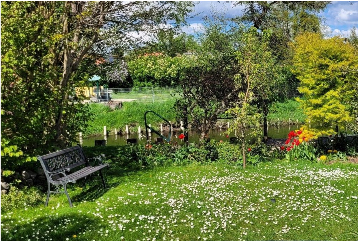
Wiese im Garten