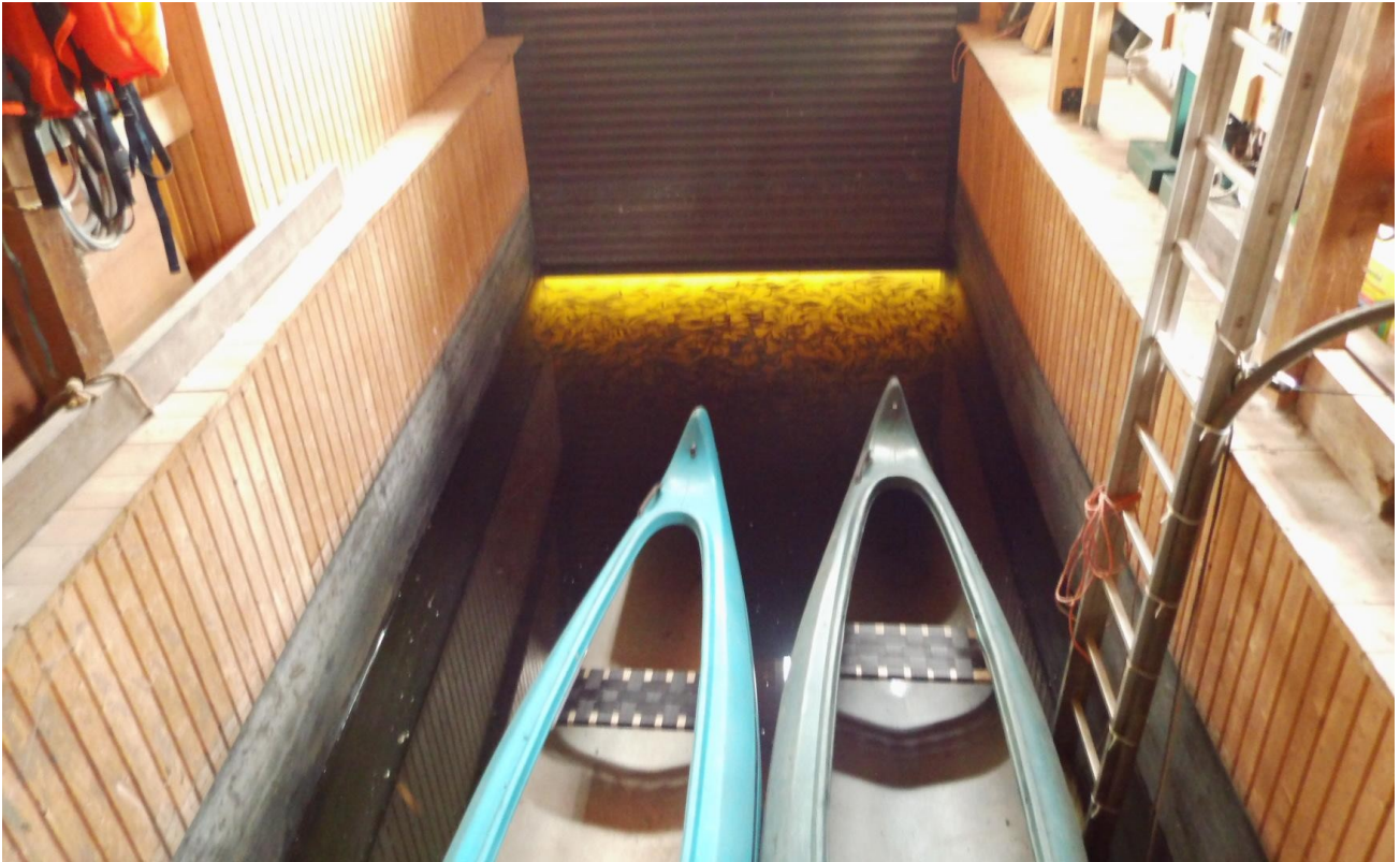
Bootshaus-Hafen ca. 6,00x2,50