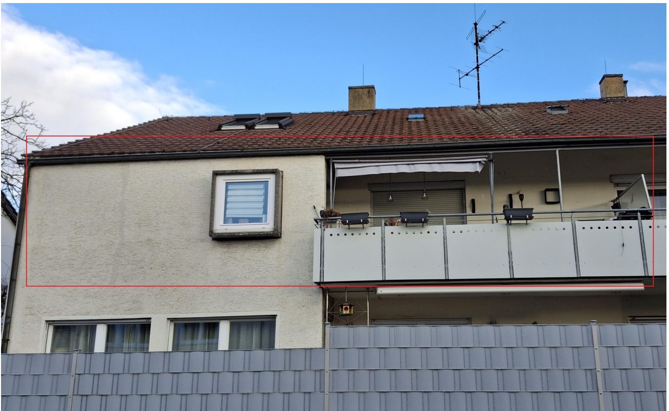
Gartenseite mit großem Balkon