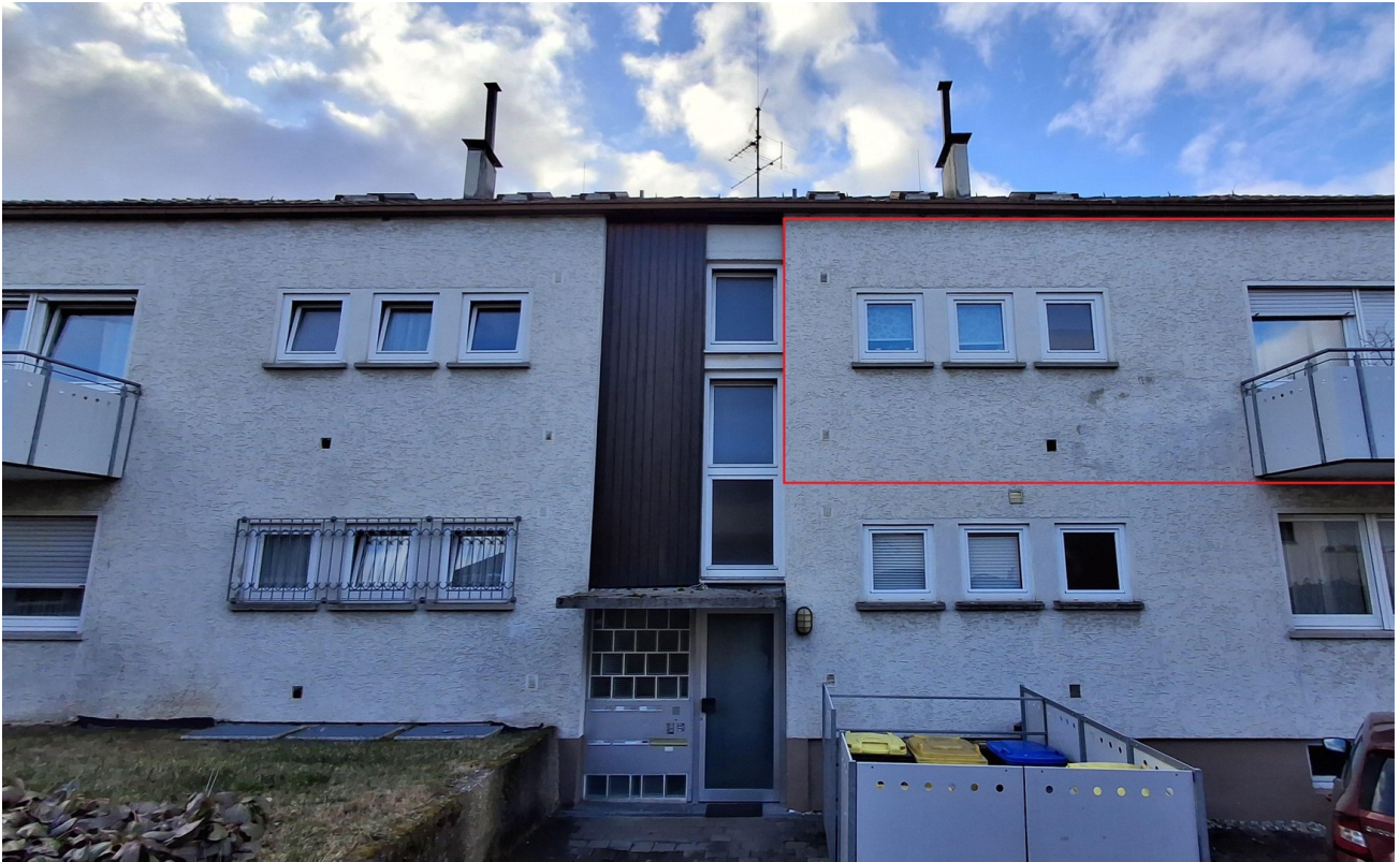
Wohnung von der Eingangsseite