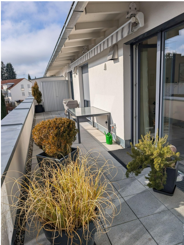
große Dachterrasse 24m 2