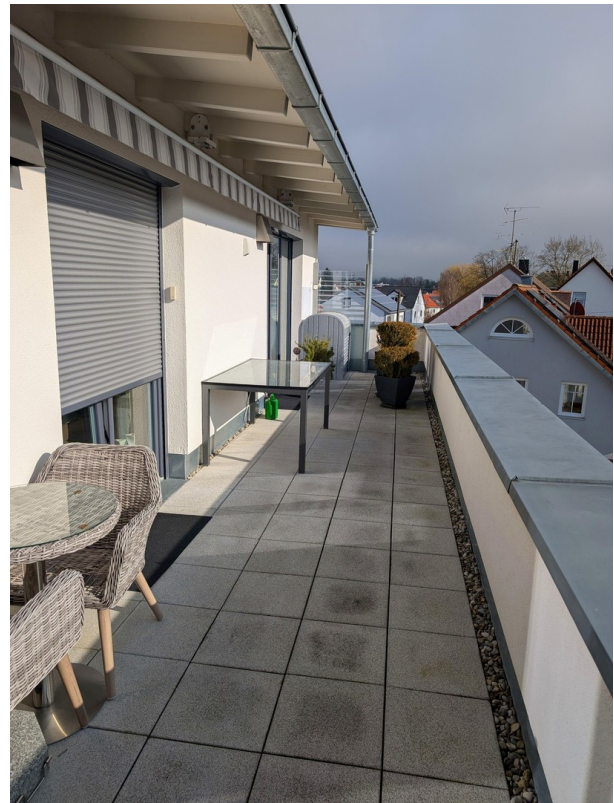
große Dachterrasse 24m 2