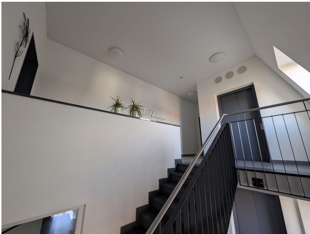
Treppenhaus / Aufzug