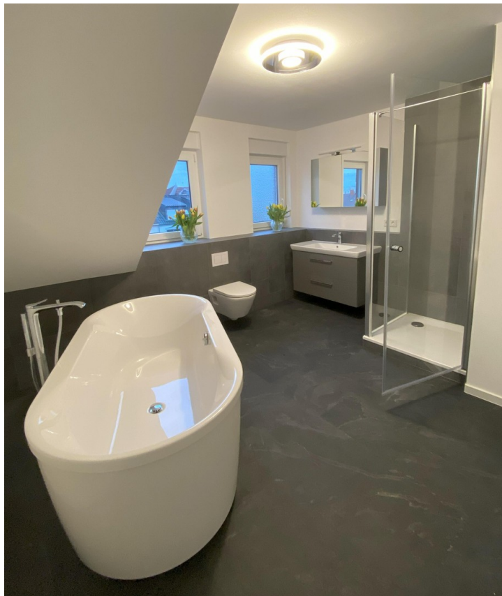
Badezimmer mit Wanne & Dusche