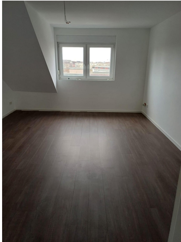
2. Raum ohne Möbel