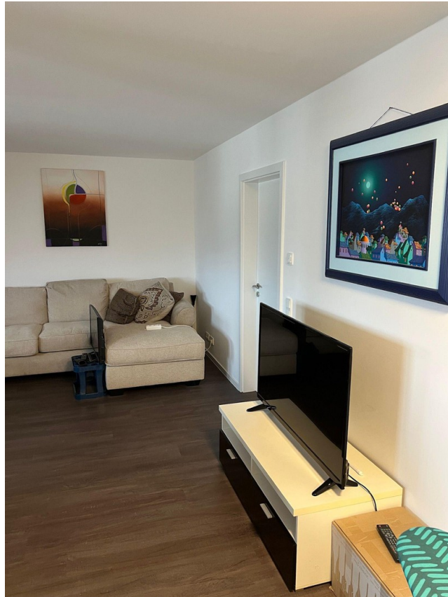
Wohnzimmer mit TV