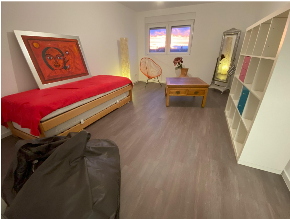
Raum Bett/ Regal/ Schreibtisch