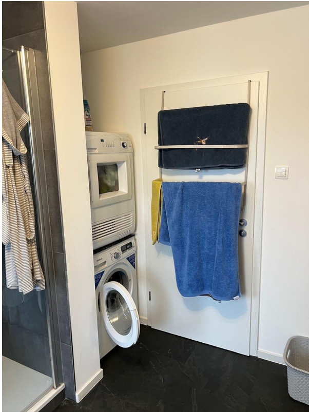
Badezimmer mit Wama & Trockner