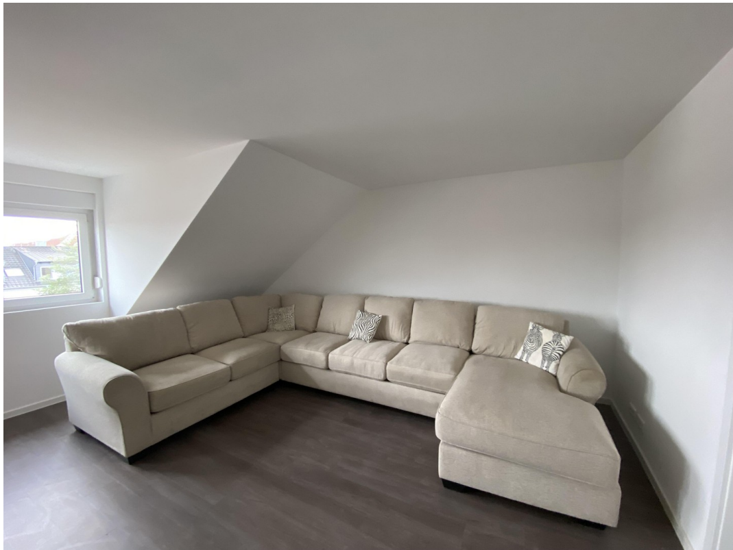
Wohnzimmer mit Couch