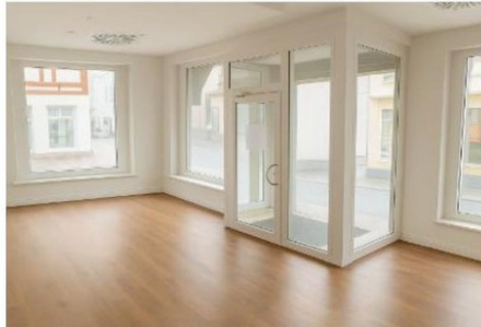
Eingangsbereich / rechts