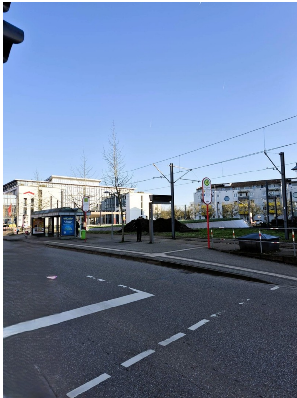
Bahnverbindung in der Nähe