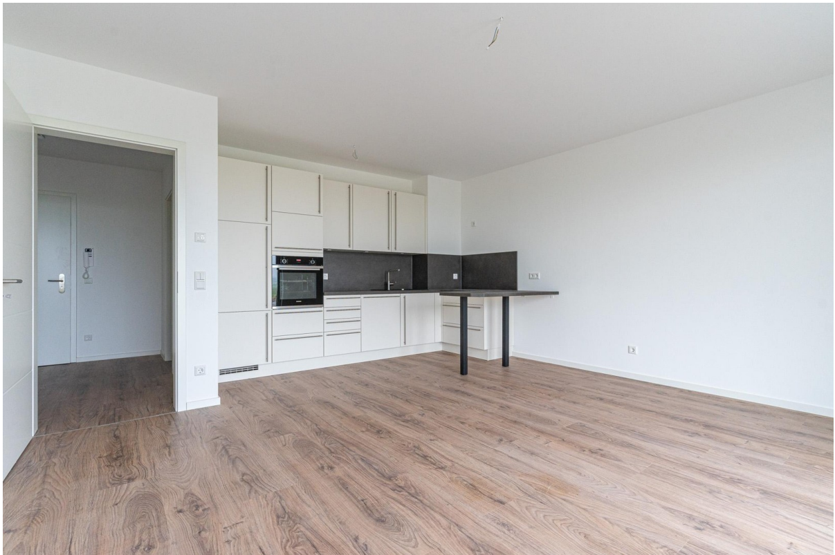
Wohnbereich mit Küche