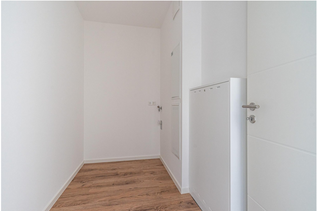
HWR mit WM Anschluss