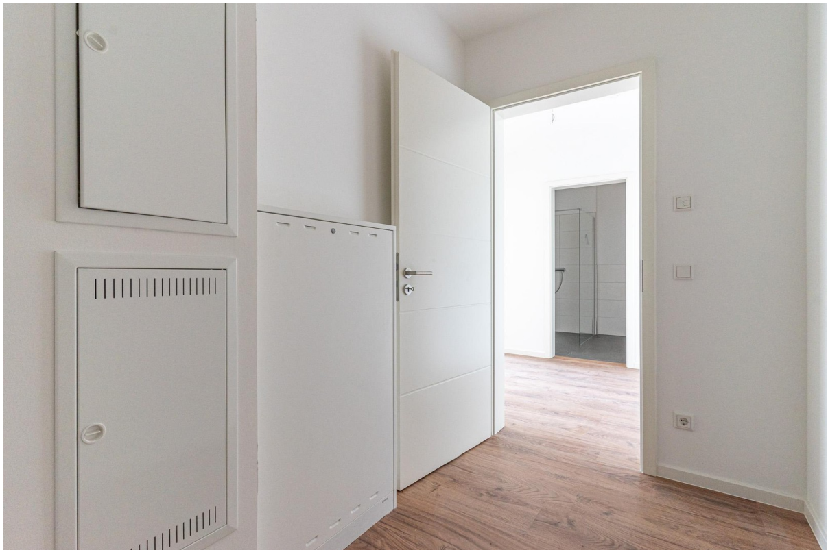
HWR mit WM Anschluss