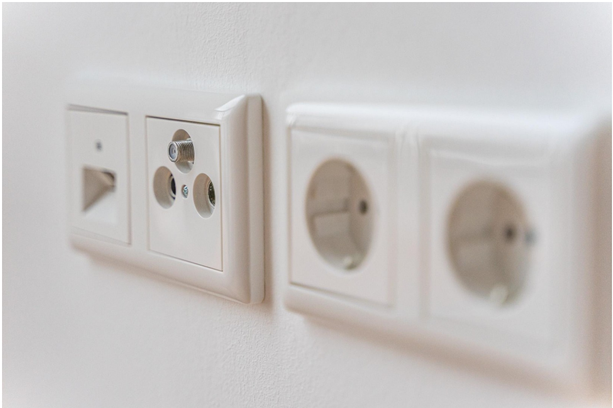
Medien in WZ und SZ