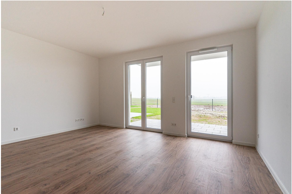
Wohnbereich mit Blick auf Feld