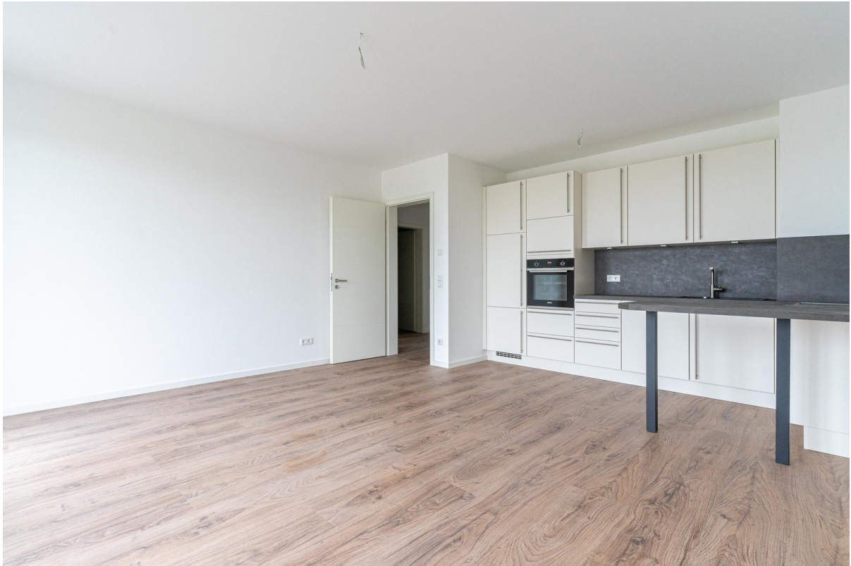
Wohnbereich mit Küche