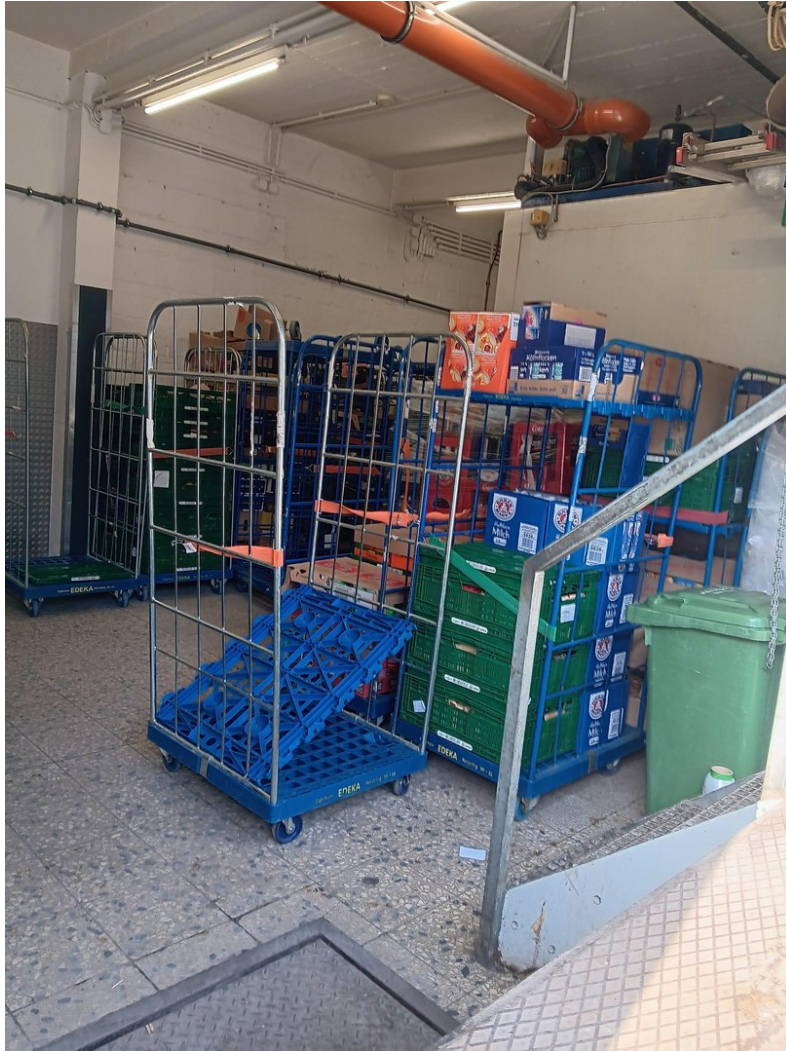
Anlieferung mit 4 Stufen hinab