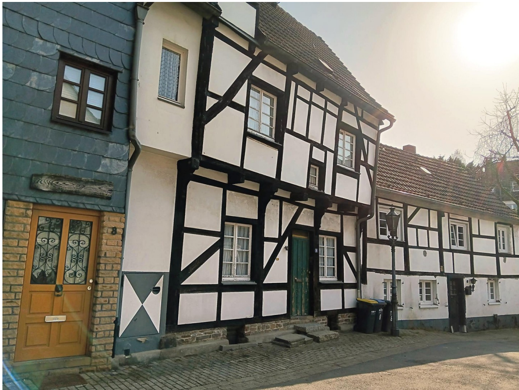
Ansicht der Eiergasse Nachbarn