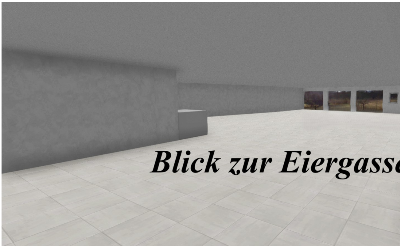
Planung in 3 D Eiergasse