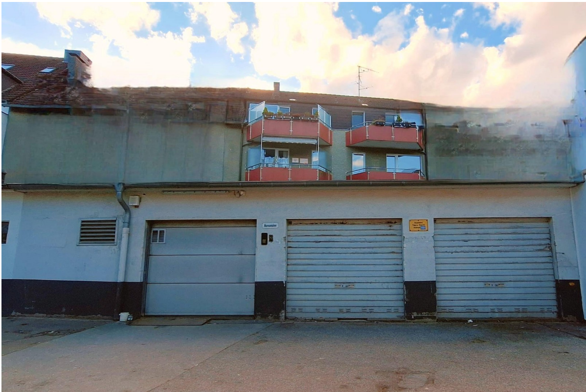
Eiergasse 4 mögl. Fensterfront