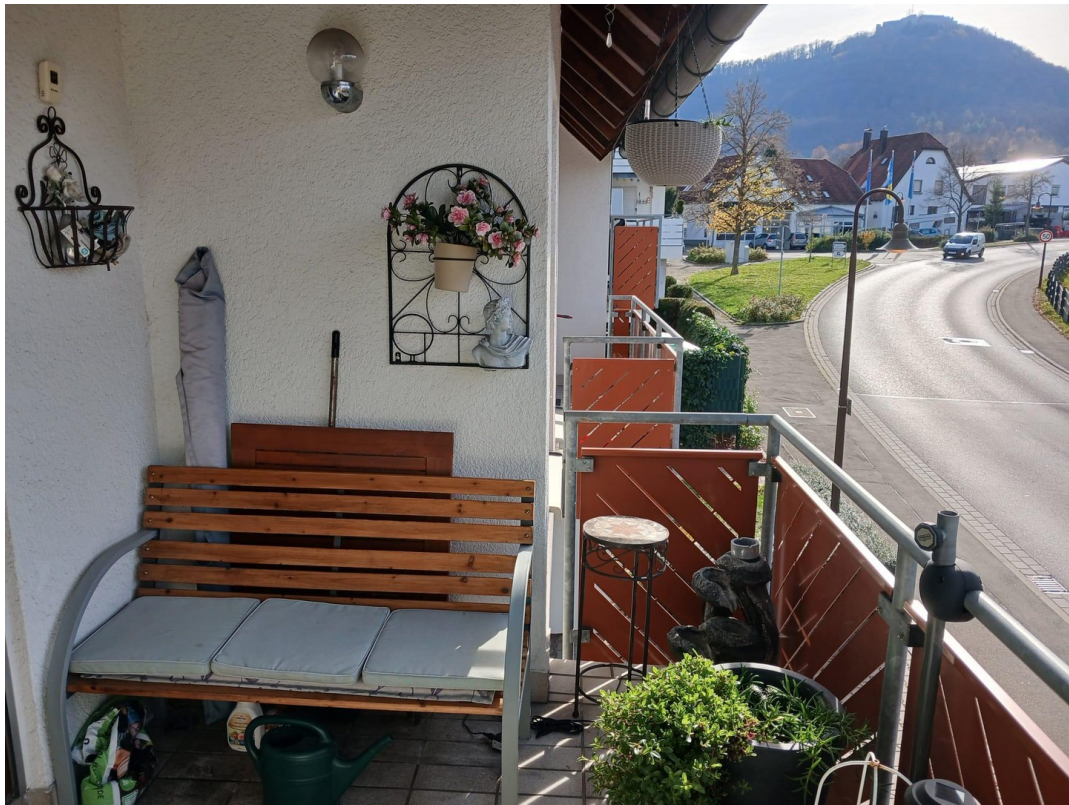
Hohen Neuffen Blick vom Balkon