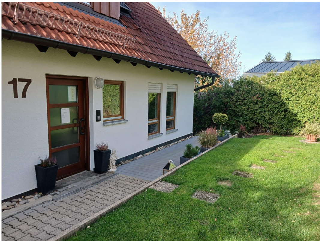
Eingangsbereich mit Terrasse