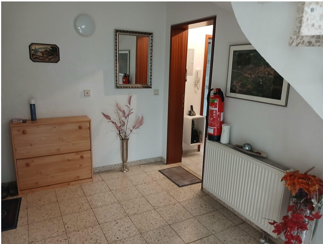
Treppenhaus zur Wohnung