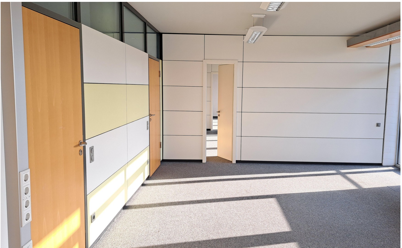
Flucht Büroräume 1-3