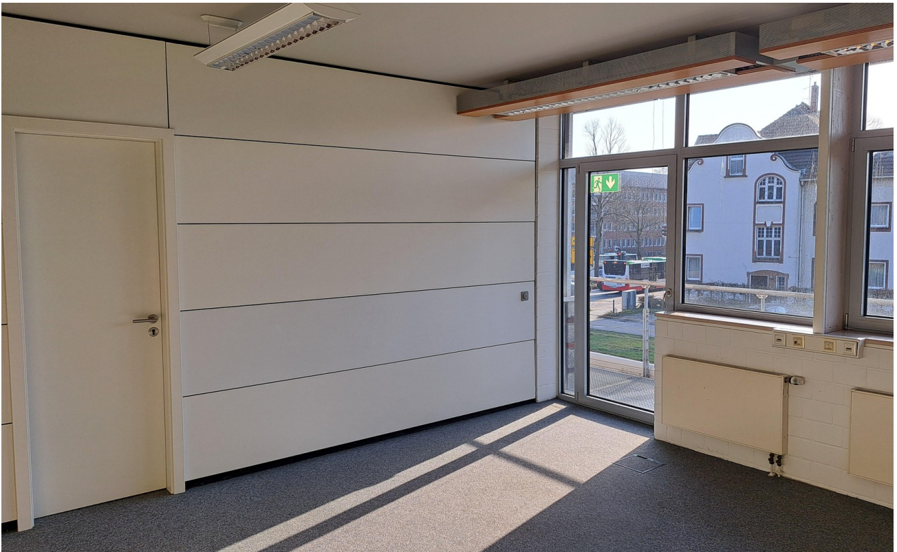
Büro 2 / 23 m 2