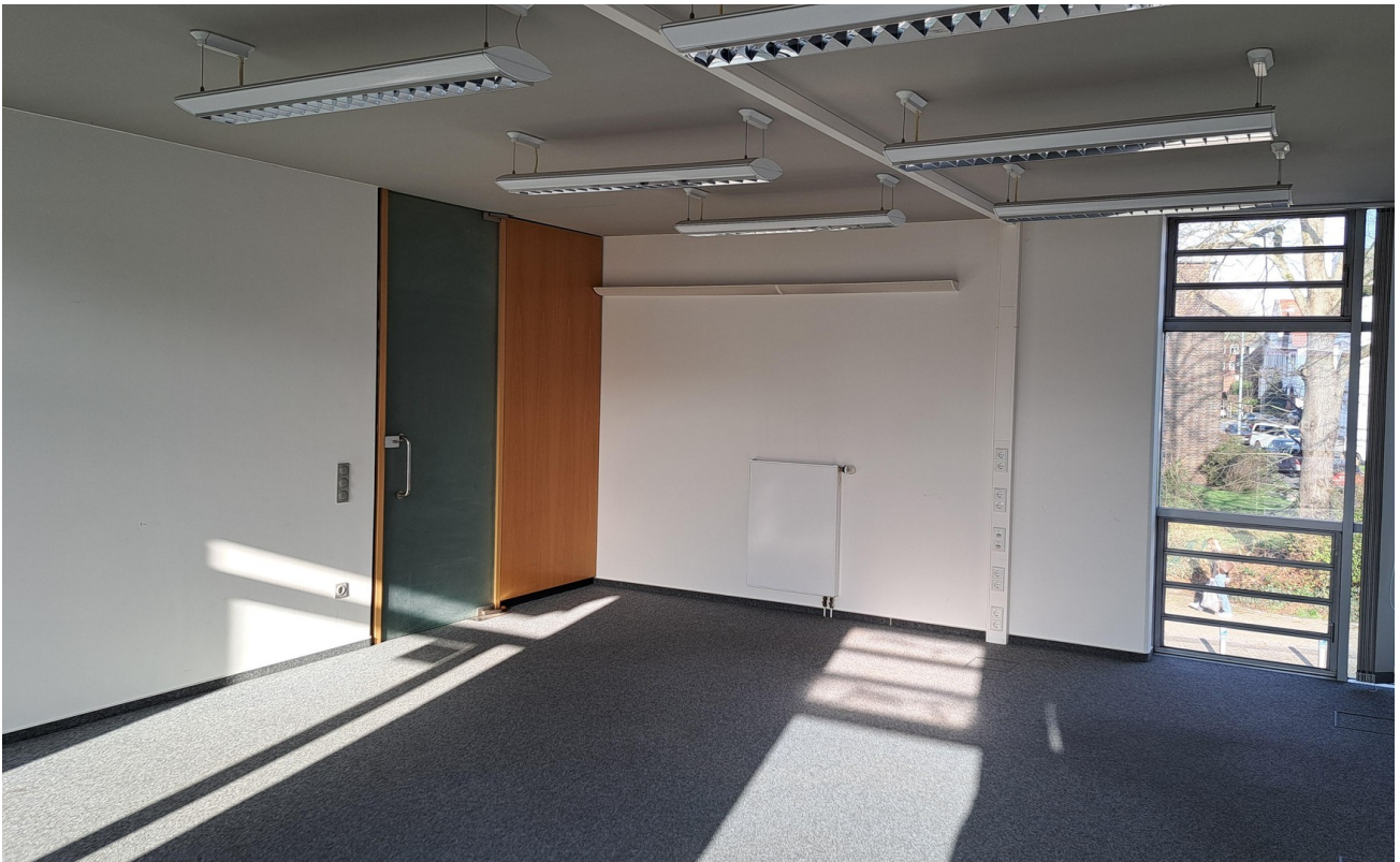
Büro 4 / 39 m 2