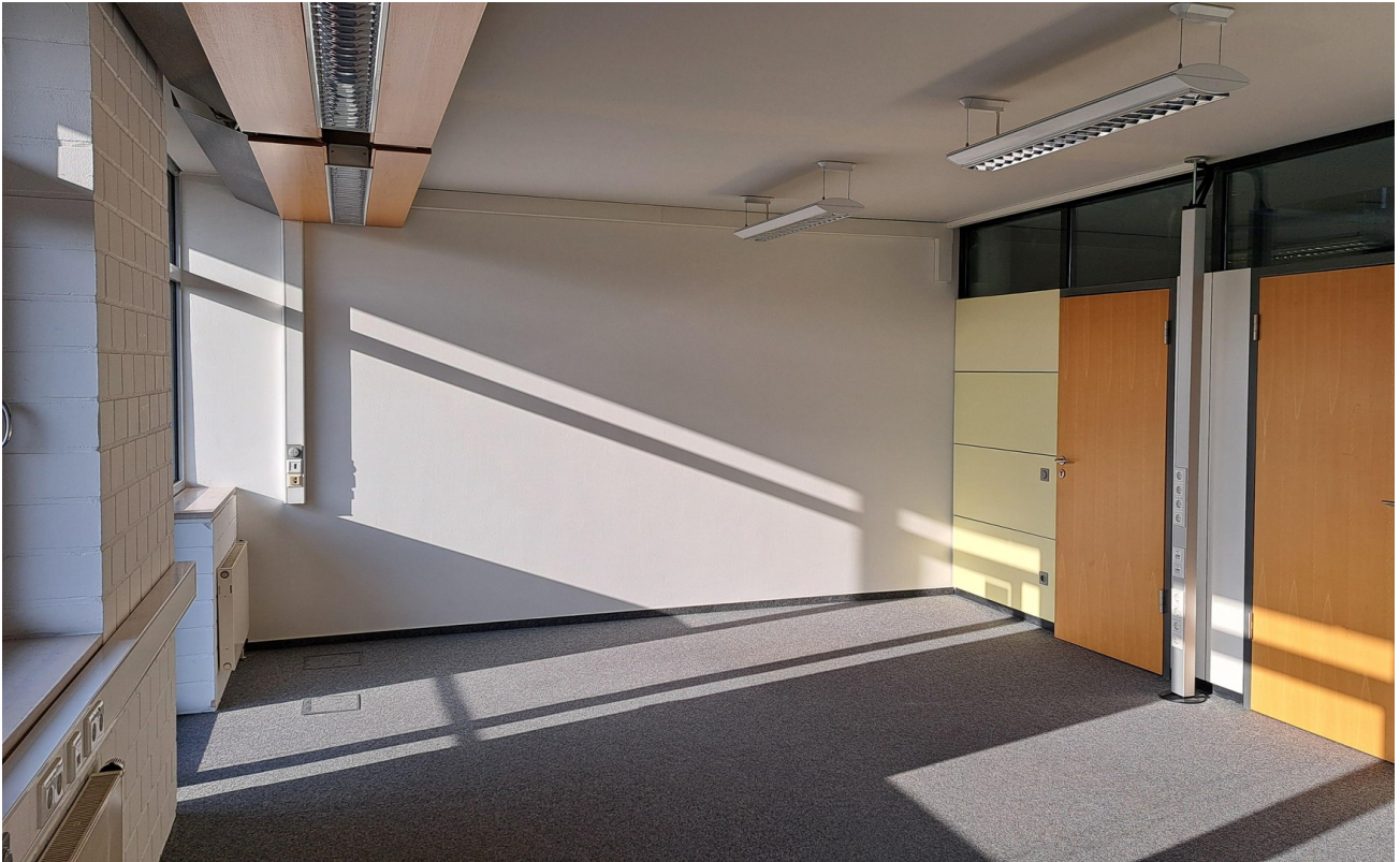
Büro 1 / 34 m 2