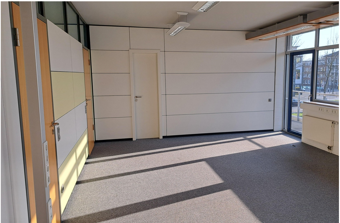
Büro 1 / 34 m 2