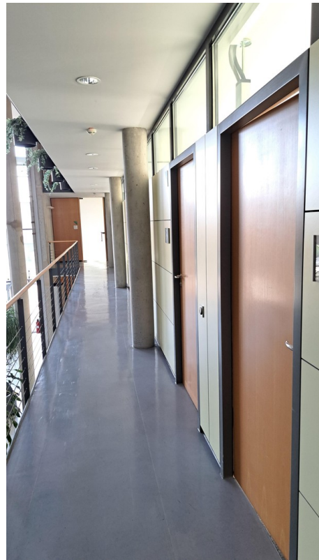
Büroflur 1. OG