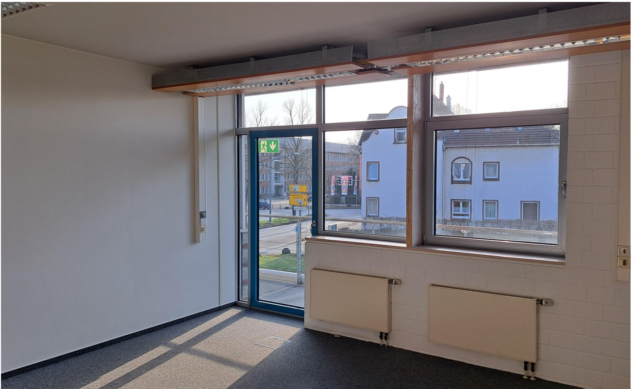
Büro 3 / 23 m 2