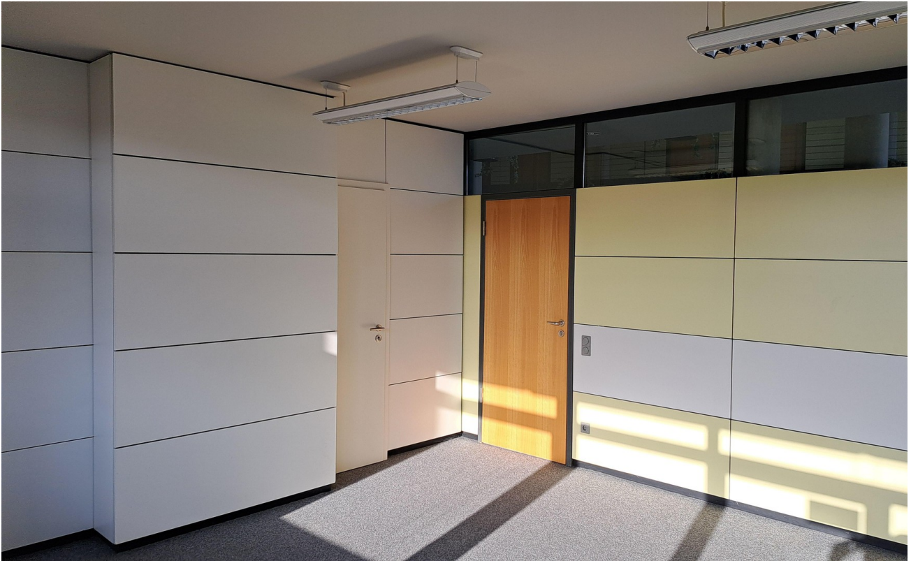
Büro 2 / 23 m 2