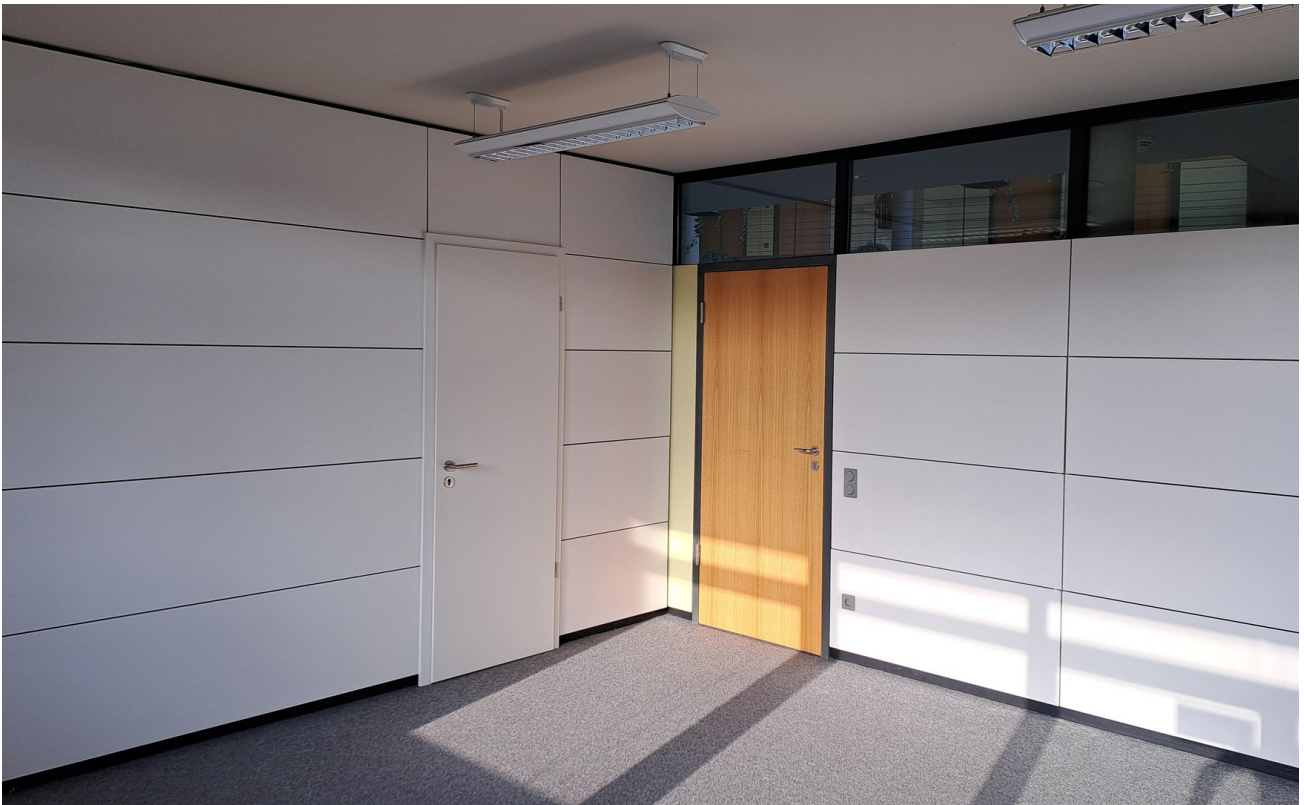
Büro 3 / 23 m 2