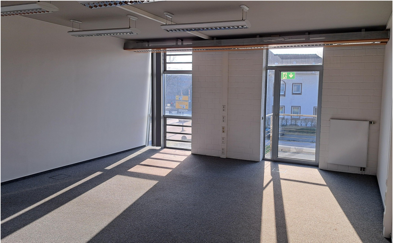
Büro 4 / 39 m 2