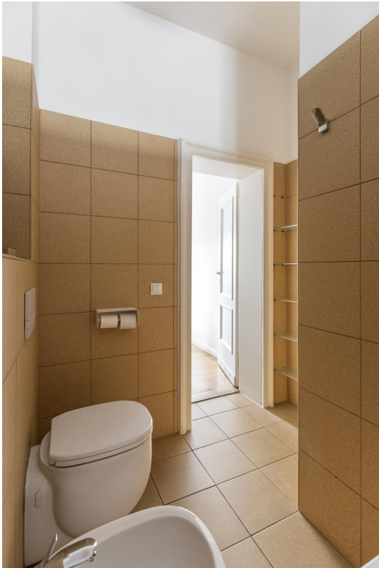
Badezimmer mit Bidet und WC