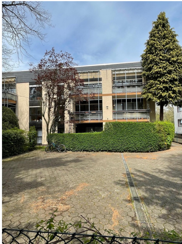
Rückansicht mit Kfz-Stellplatz