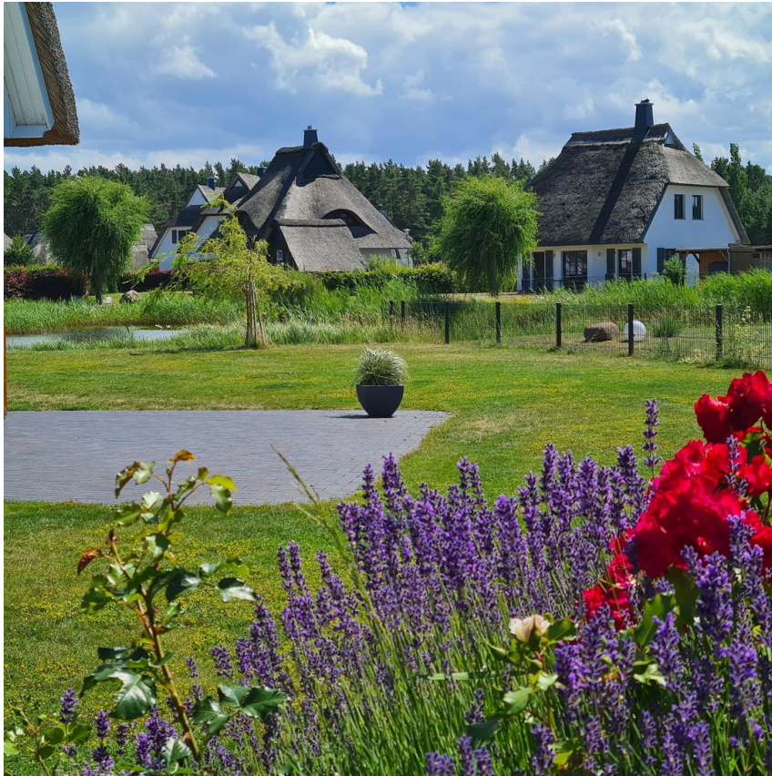
Blick in den Garten u. Teich