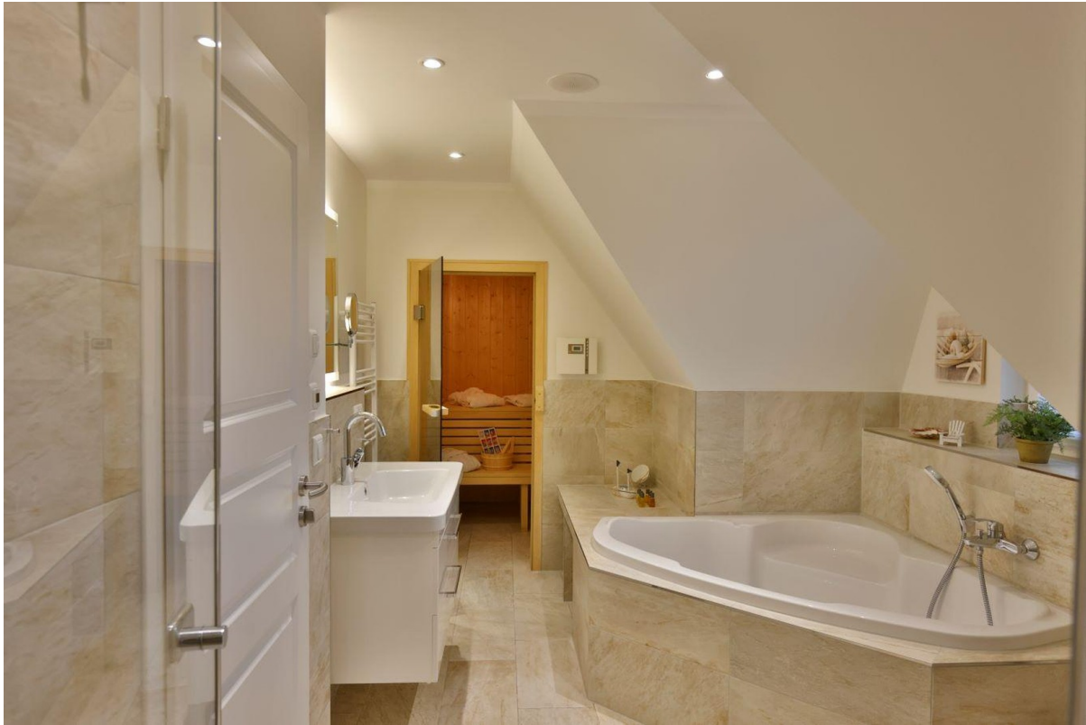
Badezimmer 1. OG