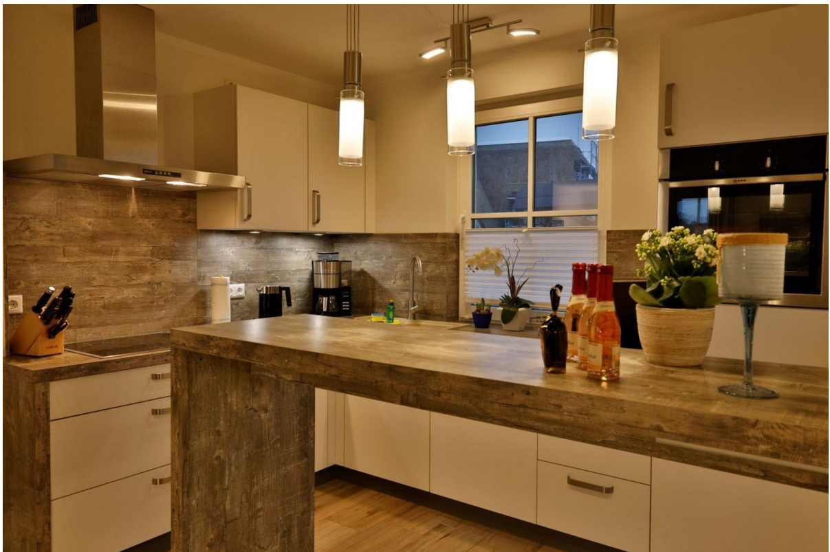
Küche mit Bartheke