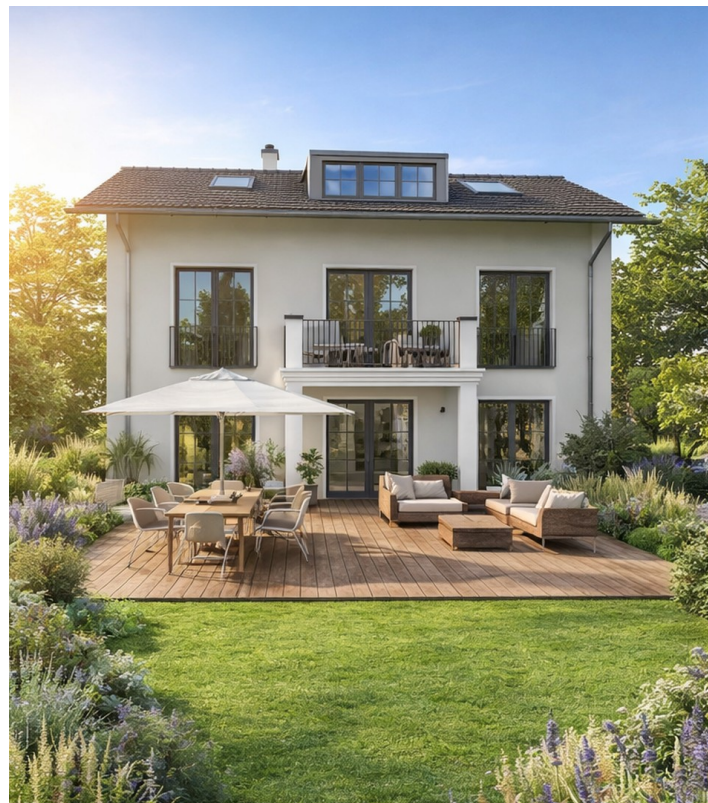
Vision des genehmigten Hauses