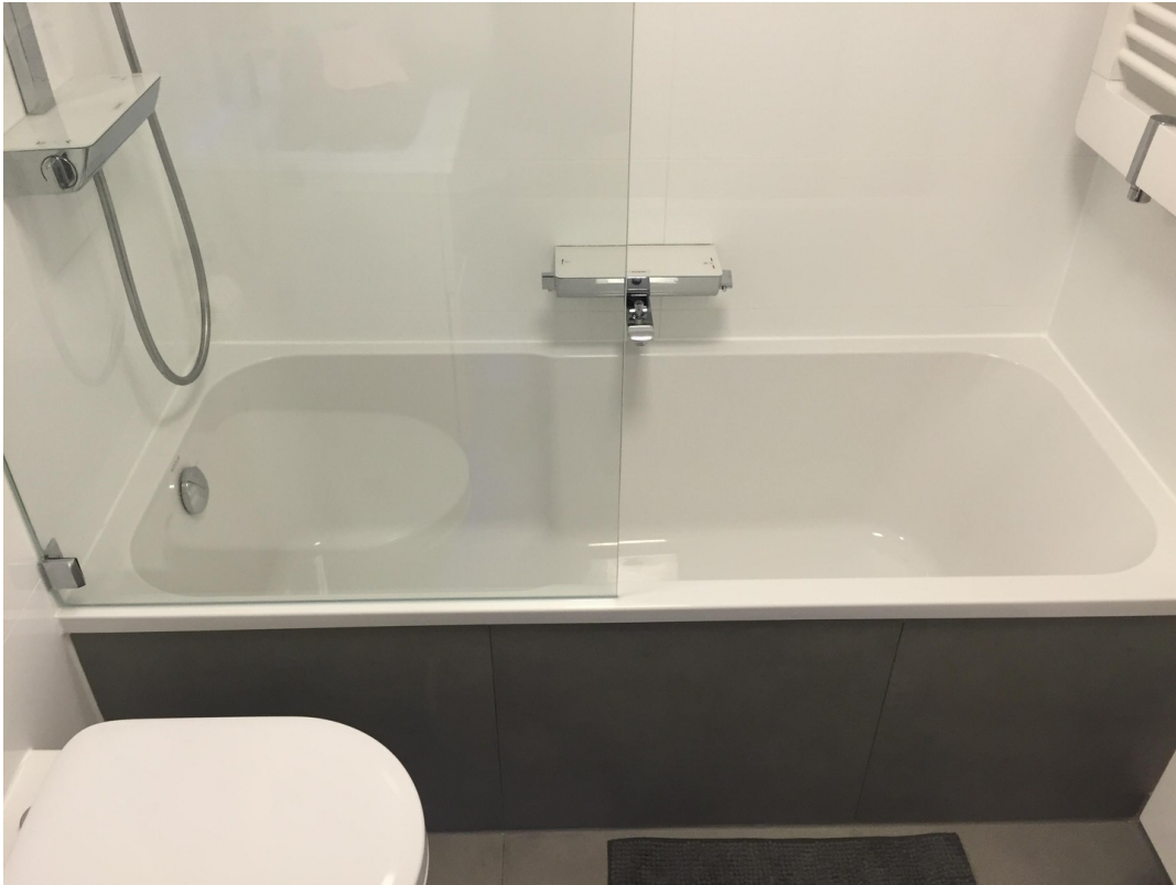
Badewanne mit Dusche