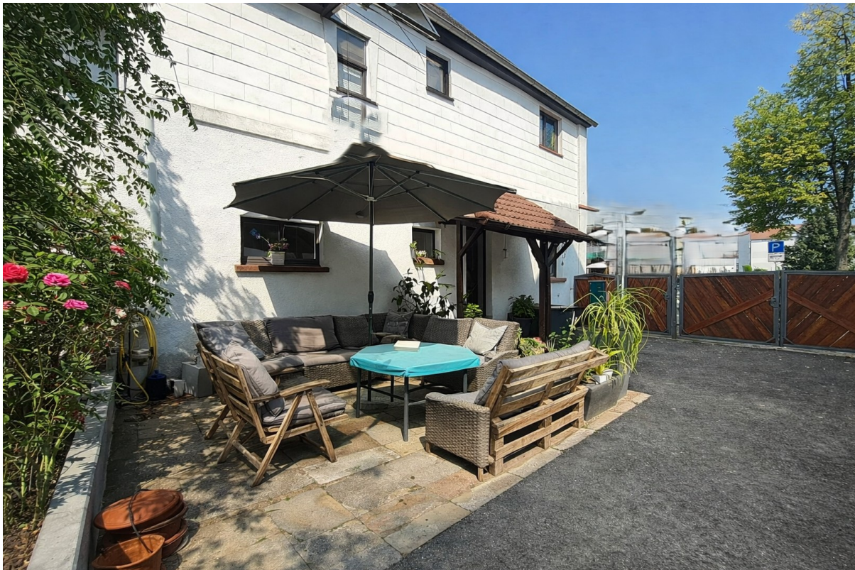
Freisitz / Terrasse